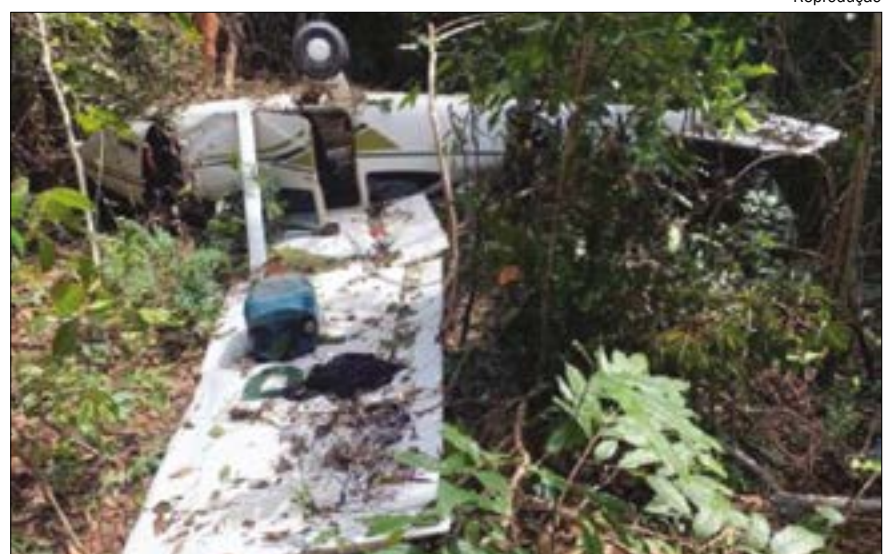
No trabalho investigativo, a polícia conseguiu levantar que um oficial da PM, um advogado e um estagiário estavam envolvidos no roubo

As informações preliminares da Polícia Civil é que o adolescente morto teria matado um membro da facção e por esse motivo estava apreendido.