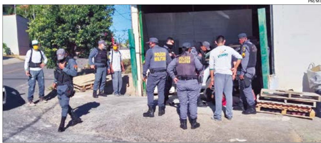
O policial, que aguardava dentro da Hilux, reagiu a tentativa de assalto e atirou contra ladrão que não resistiu ao ferimento e morreu

A Polícia Civil esteve no local junto com a Polícia Militar. O comparsa que conseguiu fugir segue sendo procurado.