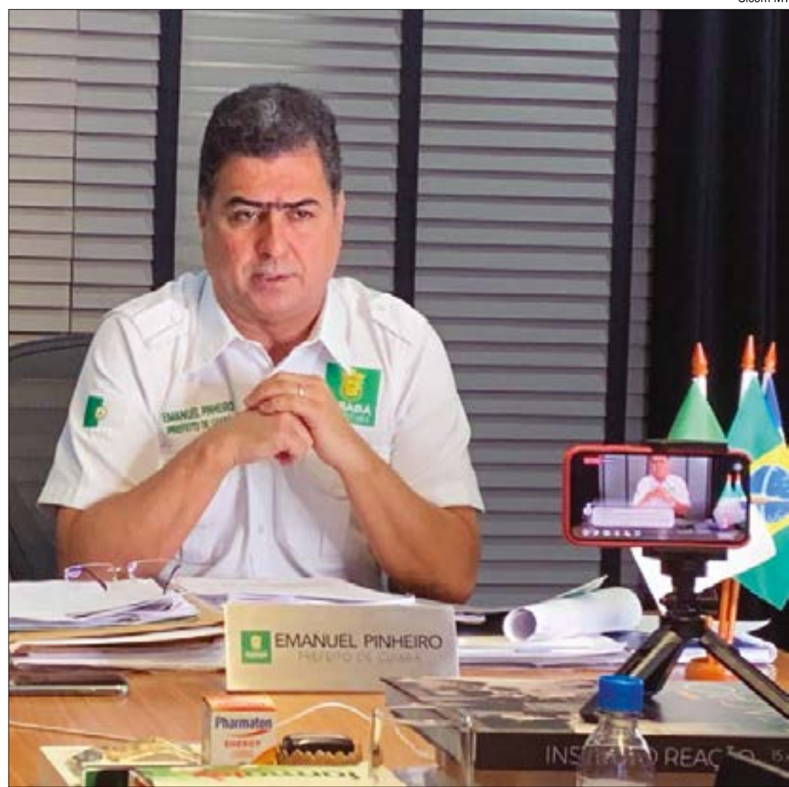
Prefeito destaca que segurança conquistada pelo isolamento social permite liberar funcionamento de shoppings, bares e restaurantes

O descumprimento das medidas do decreto acarretará medidas administrativas e multa para o estabelecimento.