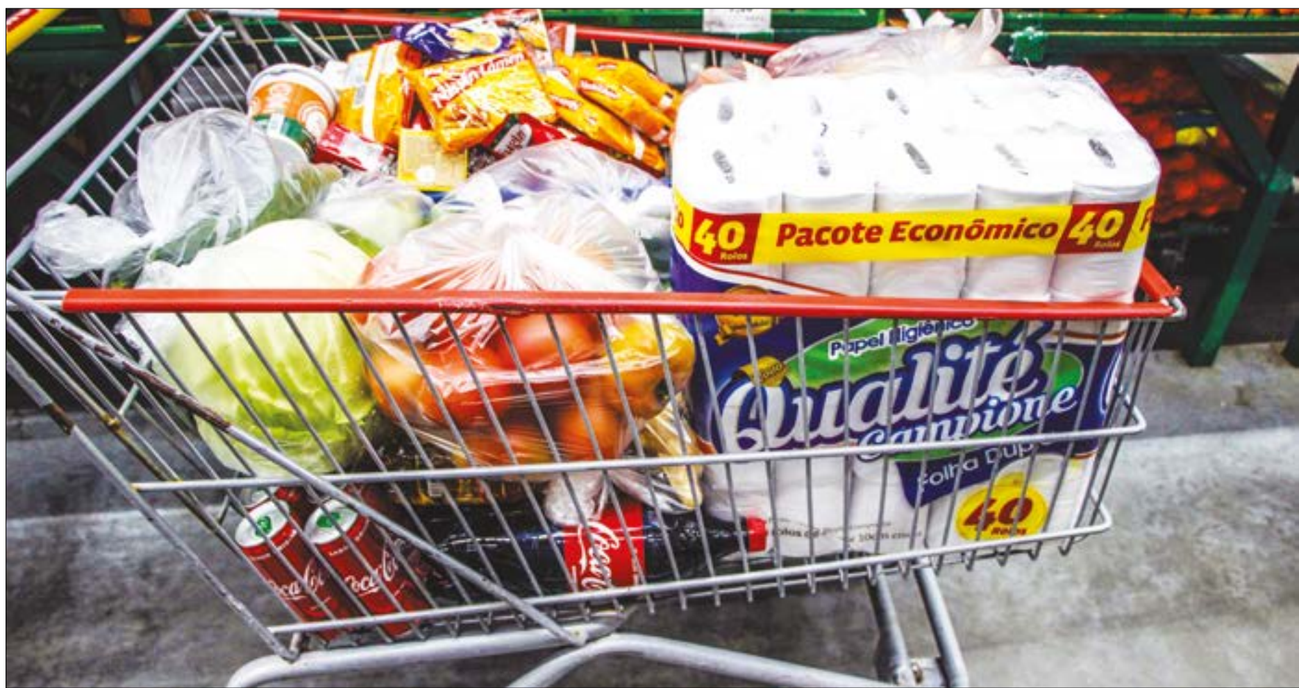
Mercado atacadista teve aumento de 3% nas vendas com relação ao mesmo período de 2019

O isolamento social, iniciado em março deste ano, provocou o fechamento do comércio nas cidades brasileiras, o que afetaria o desempenho