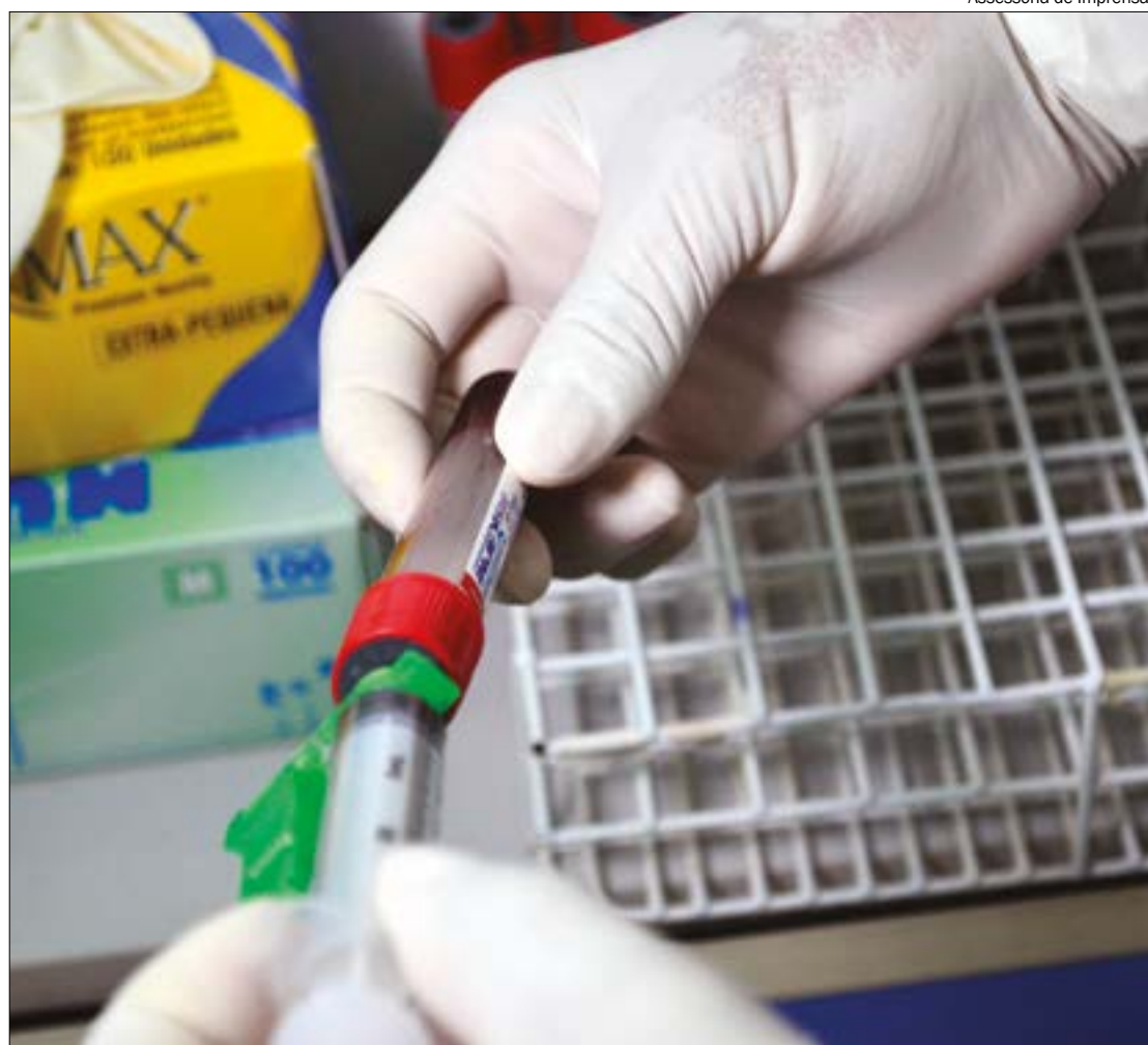
Atualmente, não existe vacina para prevenir a infecção pelo novo coronavírus. A melhor maneira de prevenir a infecção é evitar ser exposto ao vírus

RECOMENDAÇÕES - Atualmente, não existe vacina para prevenir a infecção pelo novo coronavírus. A melhor maneira de prevenir a infecção é evitar ser exposto ao vírus. Os sites da SES e do Ministério da Saúde dispõem de informações oficiais acerca do novo coronavírus. A orientação é de que não