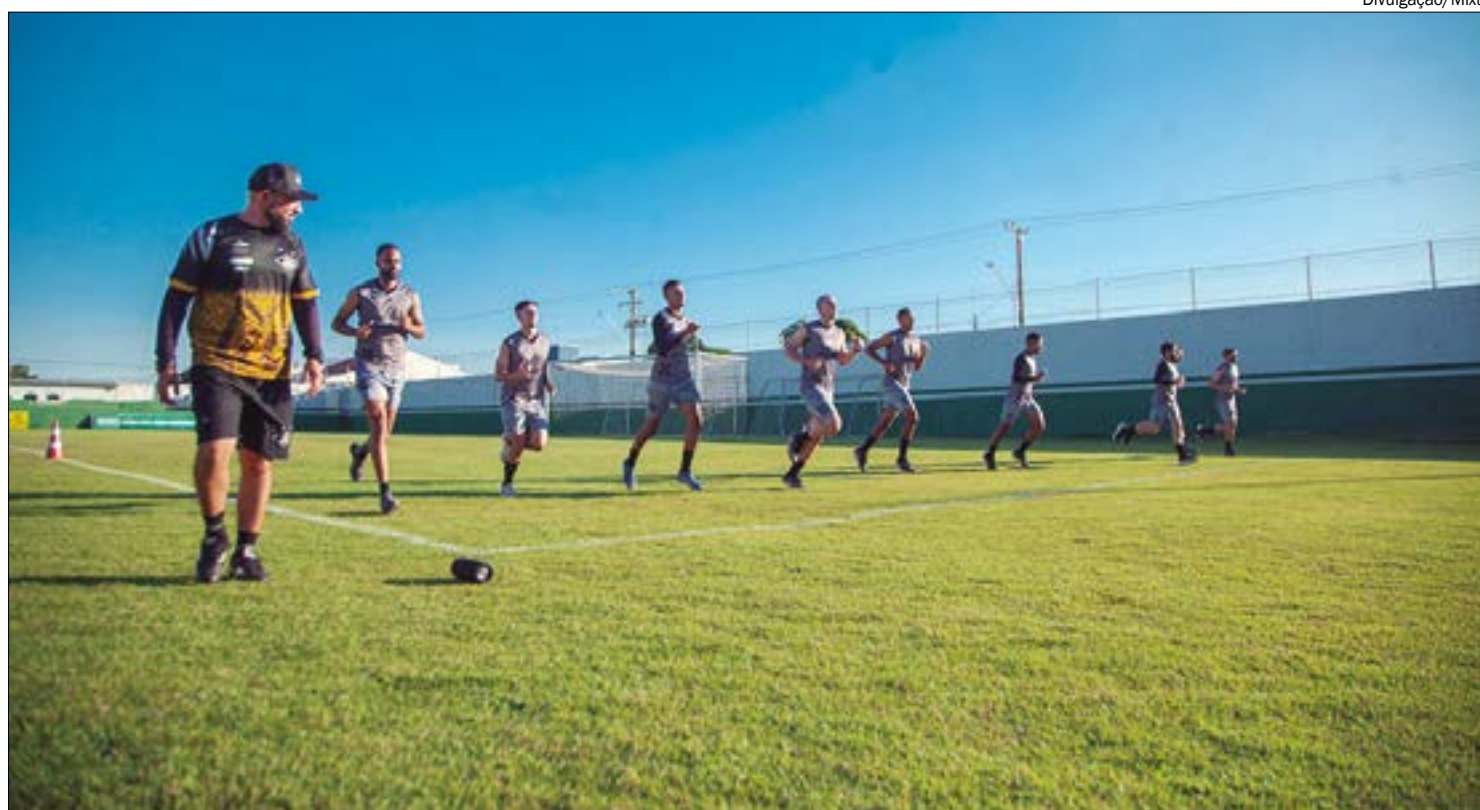
Mixto se reforçou para o Estadual com a contratação de 15 jogadores, além de uma nova comissão técnica