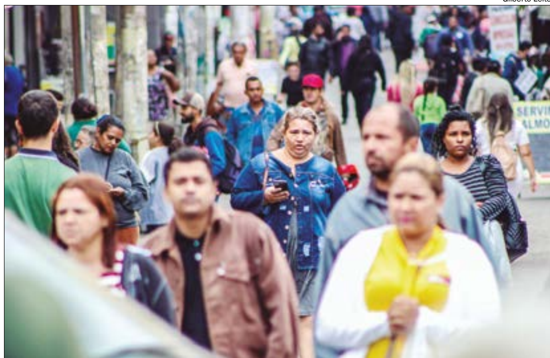
Mato Grosso registrou um óbito pela doença, desde que as notificações começaram a ser registradas no estado

Os casos recentemente detectados apresentaram uma preponderância de lesões na área genital. A erupção cutânea passa por diferentes estágios e pode se parecer com varicela ou sífilis, antes de finalmente formar uma crosta, que depois cai. Quando a crosta desaparece, a pessoa deixa de infectar outras pessoas. A diferença na aparência com a varicela ou com a sífilis é a evolução uniforme das lesões.