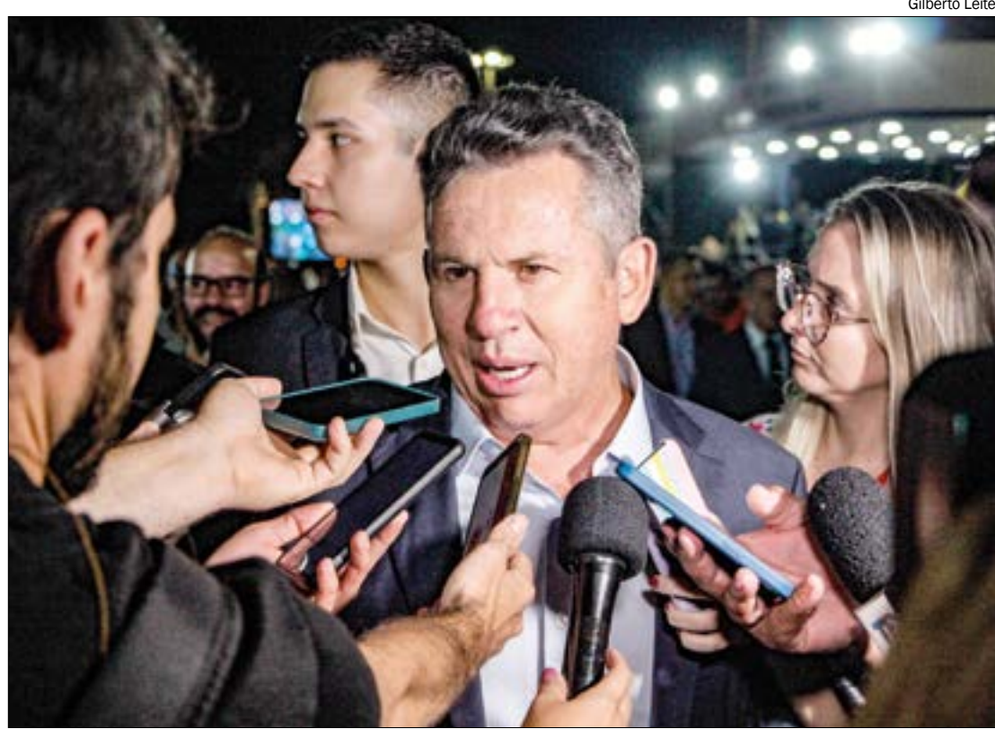
Mauro pretende avaliar indicações de partidos que ajudaram na eleição antes de anunciar os novos secretários

A posse dos novos secretários vai acontecer no dia 1º de janeiro de 2023, depois da posse de Mauro Mendes, no Palácio Paia-guás.