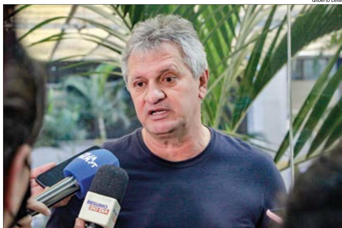
Dilmar explica que o governo aguarda o fechamento do índice inflacionário de 2022 para concluir projeto da RGA