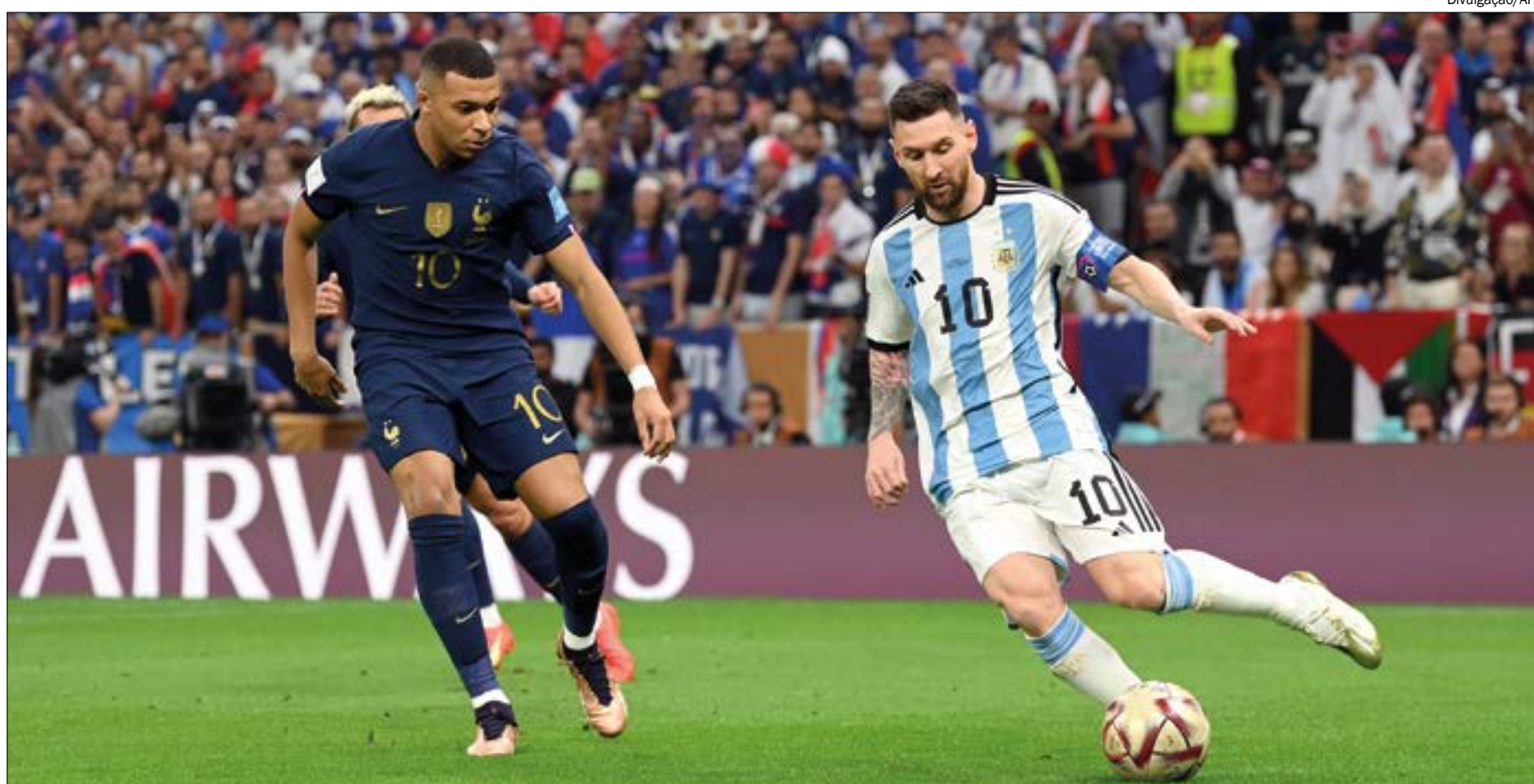
Messi e Mbappé foram os principais responsáveis pelo recorde de gols da Copa do Catar

As estrelas da competição contribuíram para o alto número de gols, já que Mbappé terminou na artilharia, fazendo oito gols e dando duas assistências,