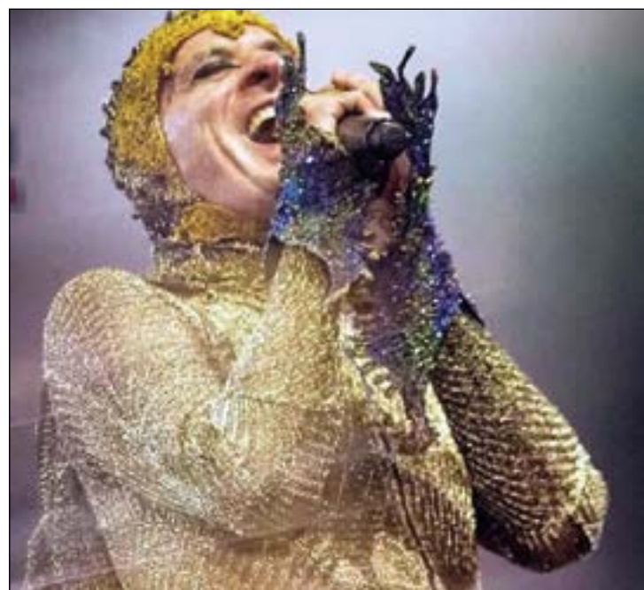
Ney Mato Grosso aterrissa amanhã no Centro de Eventos do Pantanal para memorável show