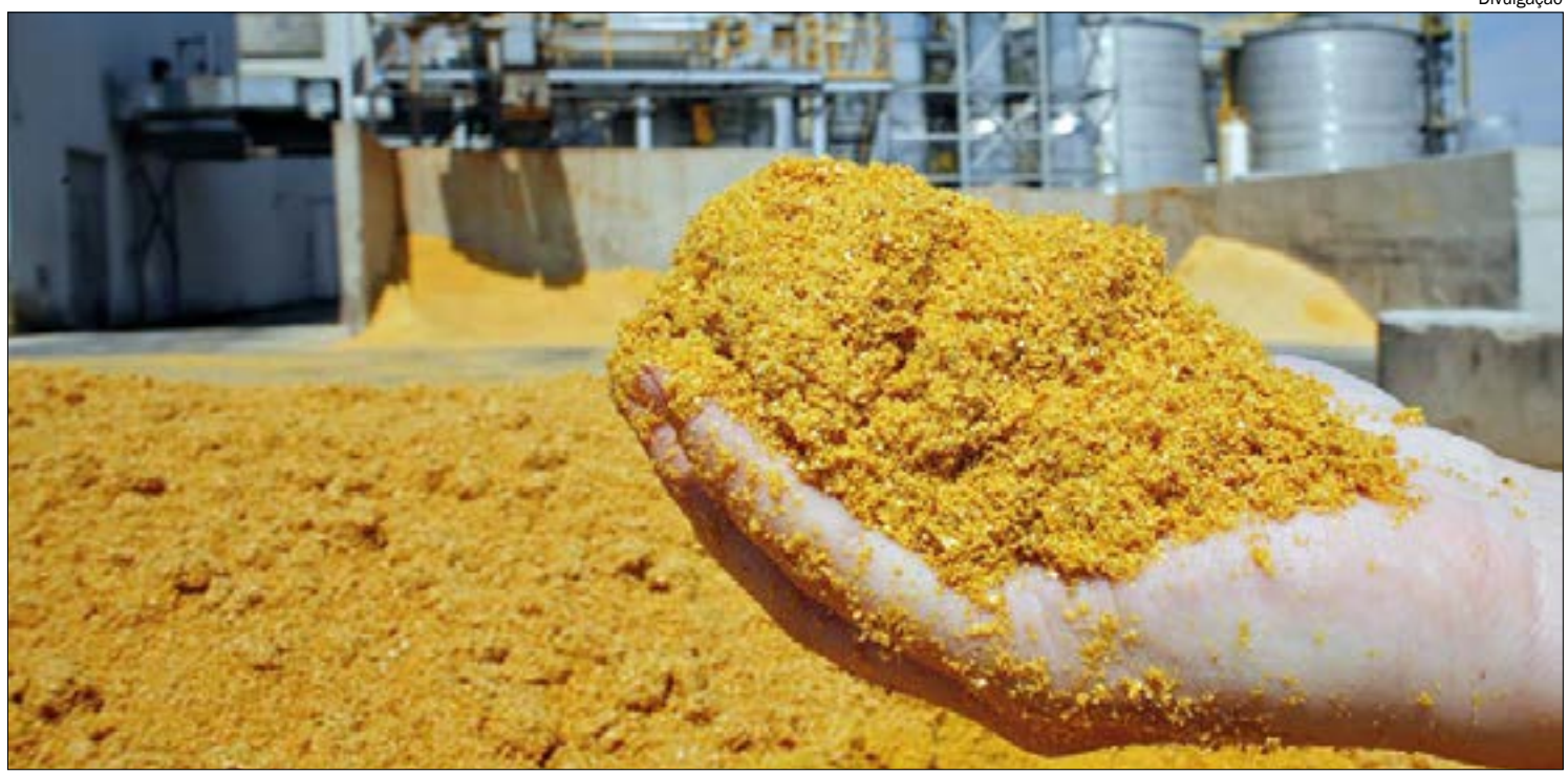
Com alto valor proteico, DDG tem sido usado como ração animal em grandes mercados, como nos EUA