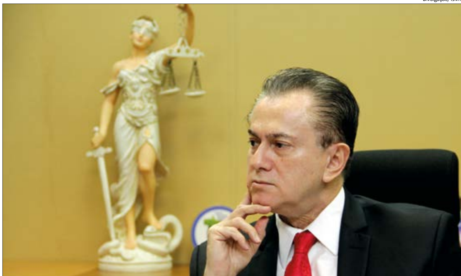
Orlando Perri conduziu casos importantes e se destacou na atuação de processos que mudaram a configuração política

O desembargador presidiu o Tribunal de Justiça entre 2013 e 2014. Antes disso, atuou como corregedor-geral (2007-2009), vice-presidente (1999-2000), além de ter sido presidente do Tribunal Regional Eleitoral (TRE-MT) entre 1999 e 2000.