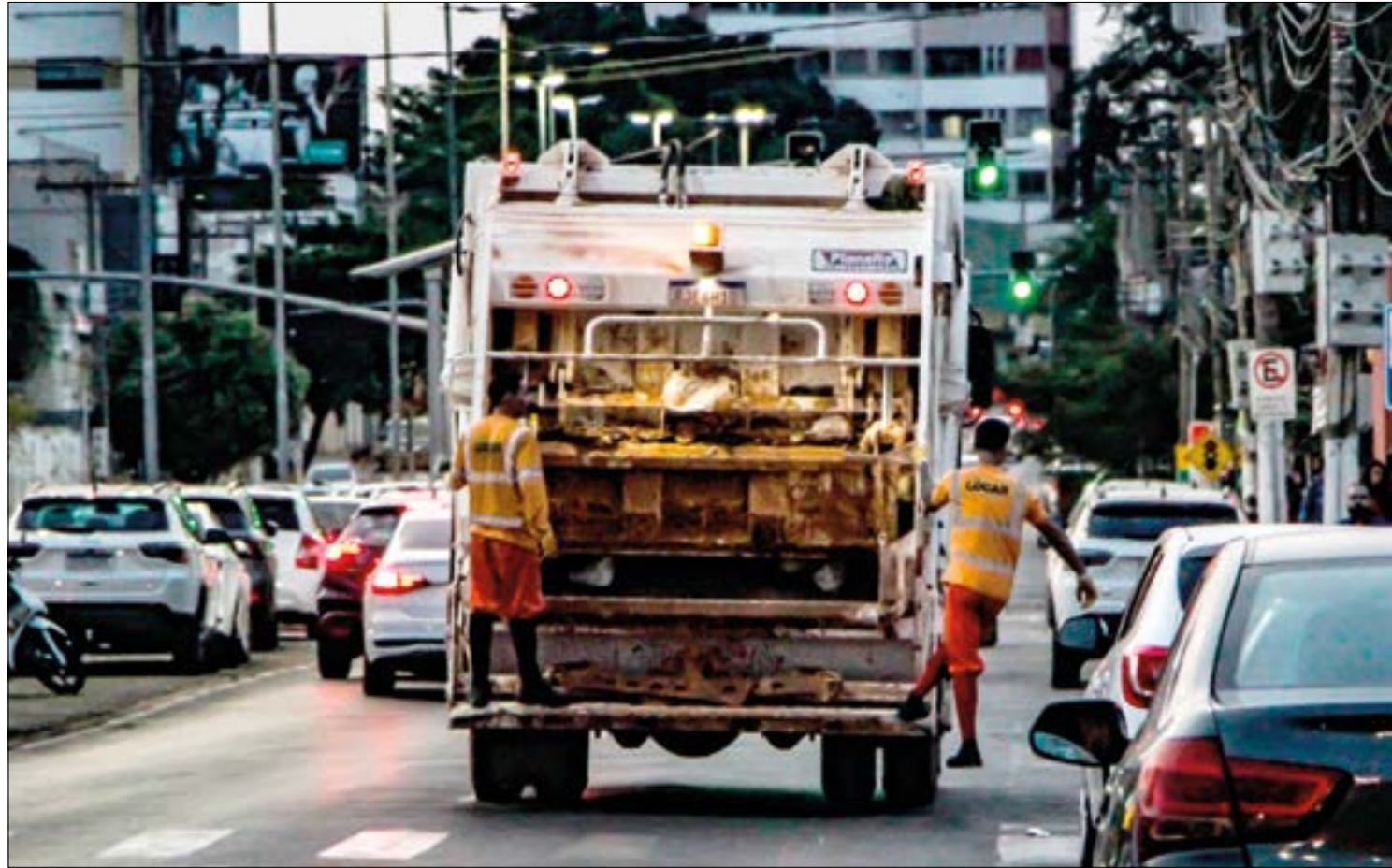
A proposta não atende a todas as exigências do Marco Regulatório, que estipula a criação de um aterro sanitário