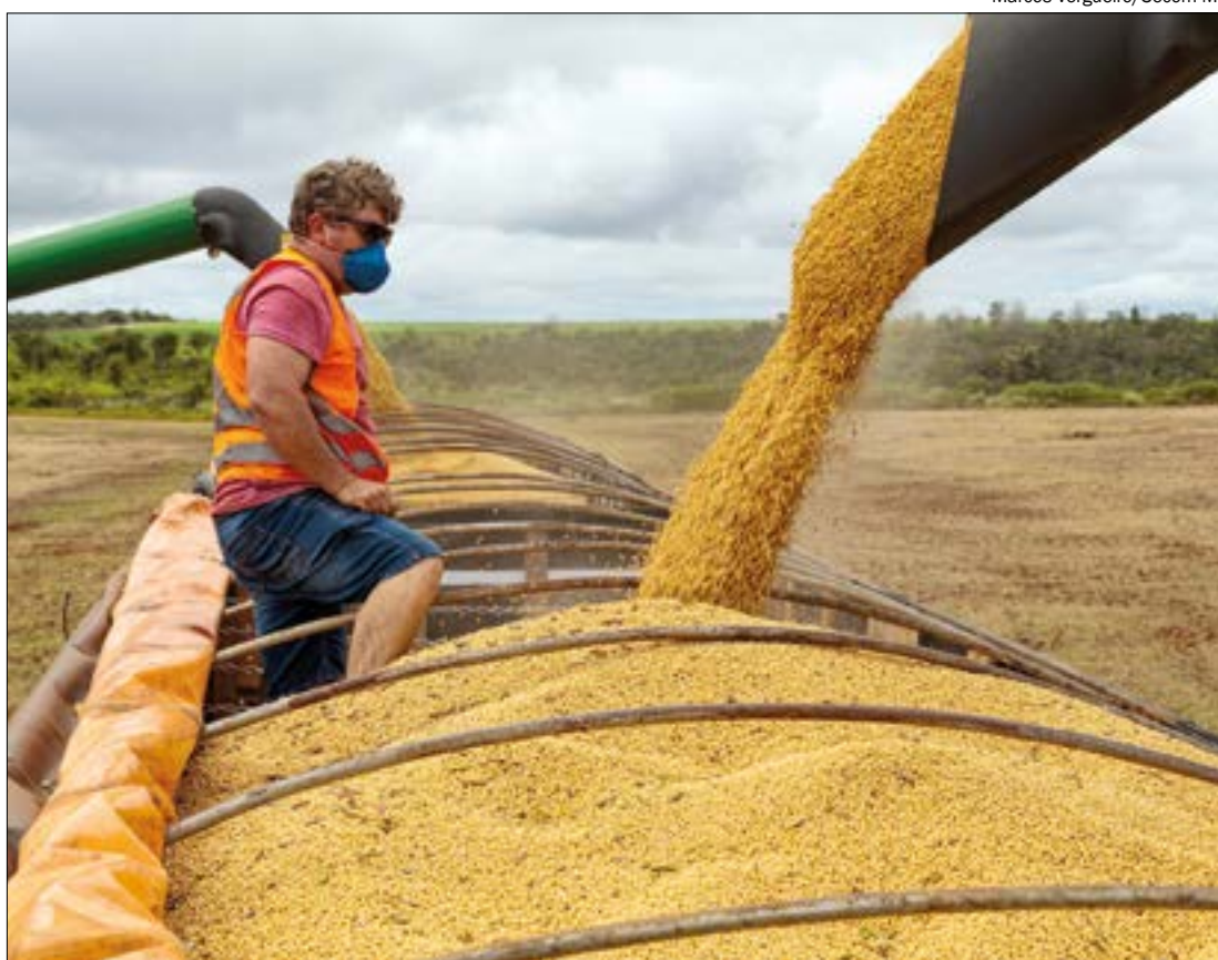
Fethab é cobrado sobre as commodities agrícolas produzidas em Mato Grosso, como soja, milho e algodão

A cobrança do Fethab é calculada com base em um percentual da UPF (Unidade de Padrão Fiscal), que atualmente é de R$ 219,59 em Mato Grosso. Para cada tonelada de soja transportada, é cobrado 10% da UPF. Já para o algodão, é cobrado 30% da UPF sobre a tonelada que é exportada e 45% sobre o algodão vendido internamente. Também é cobrado 11,5% da UPF sobre cada bovino transportado para abate. Outros itens como carne de frango, milho, feijão