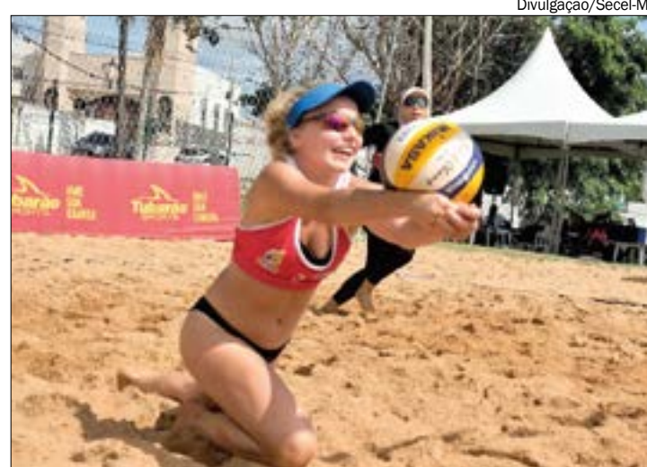
Circuito MT de Vôlei de Praia reuniu 57 duplas de dez municípios de Mato Grosso