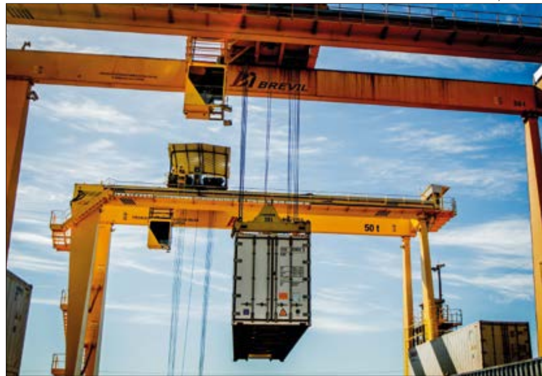
Safra de grãos compensou queda nas exportações de ferro

No setor agropecuário, o aumento do volume embarcado, provocado pela safra de grãos, principalmente pela segunda safra de milho, pesou mais nas exportações. O volume de mercadorias embarcadas avançou 35,9% em novembro na comparação com o