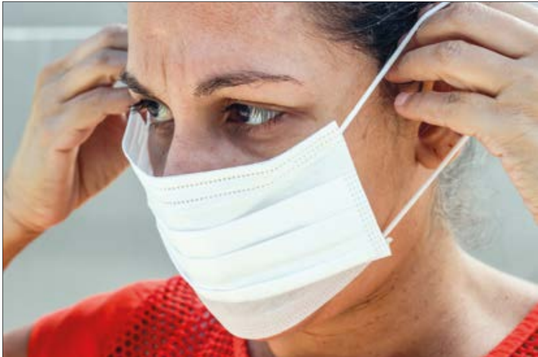
Uso de máscara e vacinação continuam sendo as melhores formas de prevenir o contágio pelo coronavírus