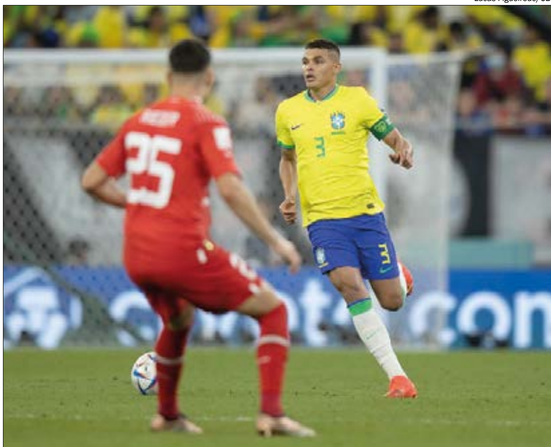
Brasil é a única seleção que classificou sem nem sofrer um chute ao gol

porém nenhum foi ao gol de Alisson, que praticamente não trabalhou nas duas partidas. Um dos pilares da defesa brasileira para auxiliar o goleiro, é o zagueiro Thiago Silva, que joga sua terceira Copa e ajuda o sistema defensivo a se manter firme nas partidas. Porém, o fato de os adversários não acertarem nenhum chute no gol de Alisson surpreendeu Thiago.