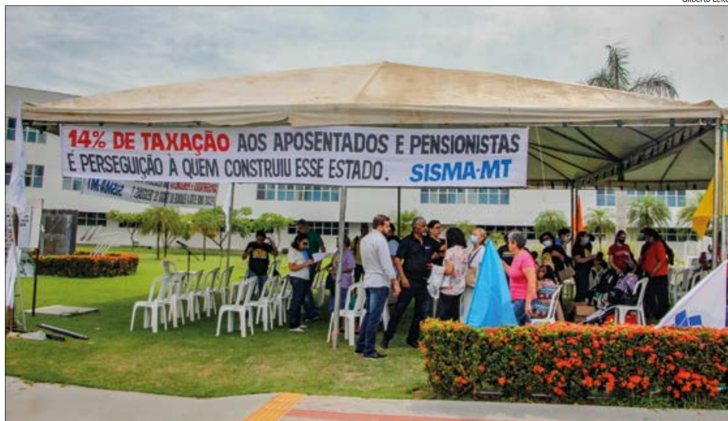
Os aposentados e pensionistas realizaram uma manifestação em frente ao Parlamento estadual para cobrar providências

Servidores inativos fizeram manifestação para cobrar aprovação da PEC dos Aposentados