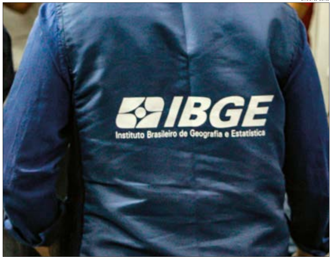
Responder ao Censo é obrigação legal de todos os cidadãos brasileiros