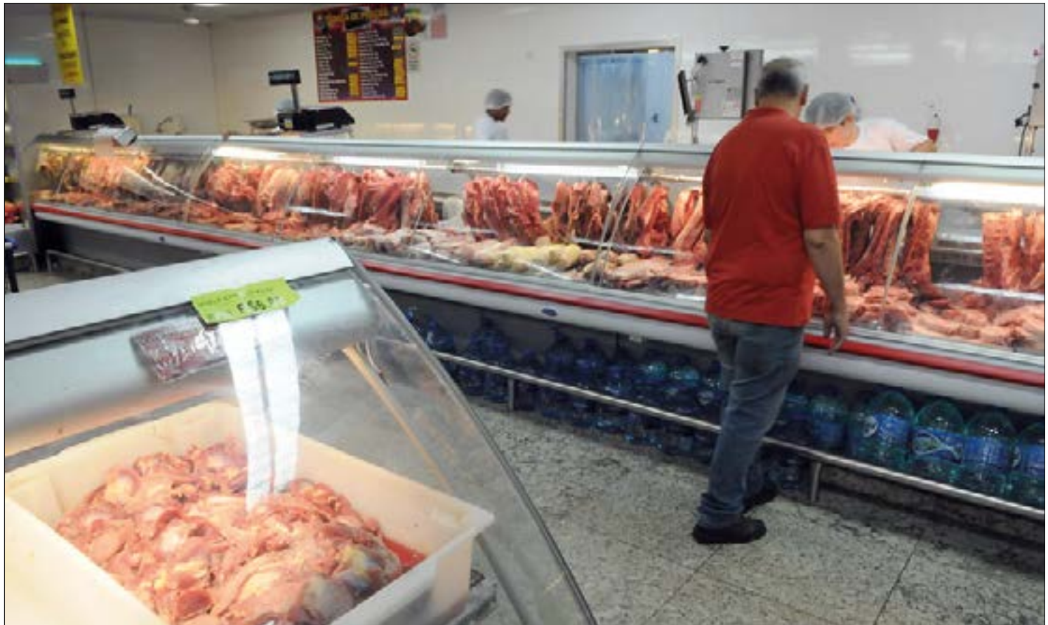
Aumento do consumo de carne no final de ano pode impedir que redução de preços seja maior para o consumidor

"No contexto geral, esse abate de fêmeas deve bater, principalmente, para baixo o preço do boi gordo e da carne bovina nesses próximos meses e talvez até anos", afirma.