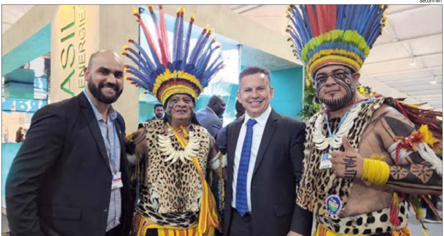
Paresi usam 15,5 mil hectares para plantar soja, milho, batata-doce, abóbora e vários outros produtos

O governador Mauro Mendes também ressaltou a importância da presença da etnia no evento. "Os paresis estão representando muito bem os povos indígenas aqui na COP. Eles contaram dezenas de vezes