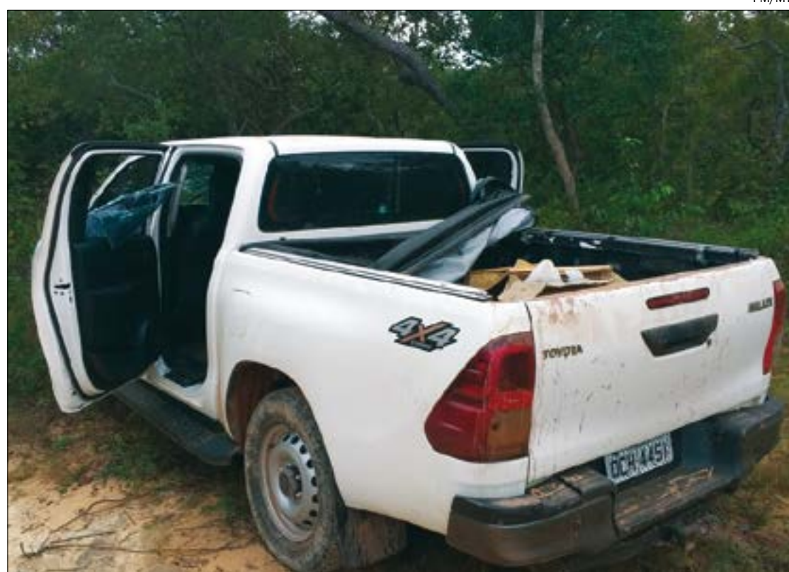
Altamiro ficou ferido e foi encaminhado ao Hospital Municipal de Cuiabá (HMC), onde está em observação e não corre risco de morte