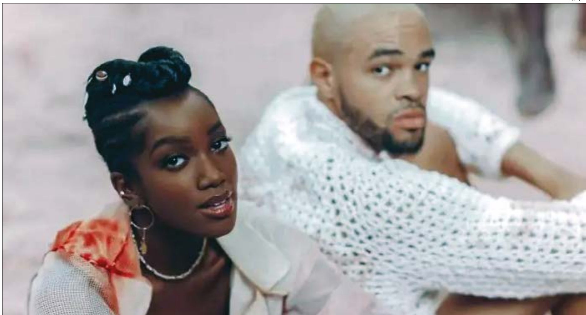
Uma das surpresas da quarentena é o reggae bilingue de Iza em parceria com o rapper americano Maejor

Quem também voltou para suas raízes pop foi a britânica Ellie Goulding com a novíssima Power. Apesar de ter lançado músicas avulsas nos últimos dois anos, a canção foi anunciada como o primeiro single do seu quarto álbum de estúdio, ainda sem nome. Power remete às produções do elogiado Future Nostalgia de Dua Lipa. A faixa está presente em serviços de streaming, mas, ao contrário de Gaga, o