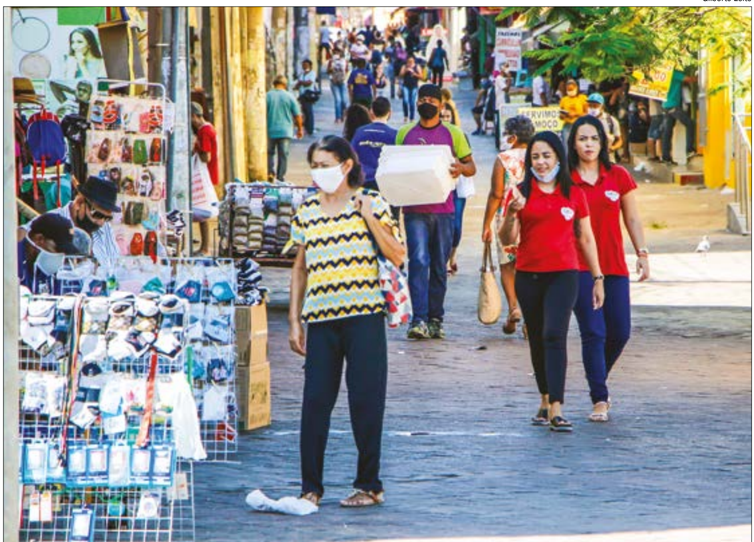
Isolamento social comprometeu a renda familiar de 50,6% dos cuiabanos entrevistados pela CDL