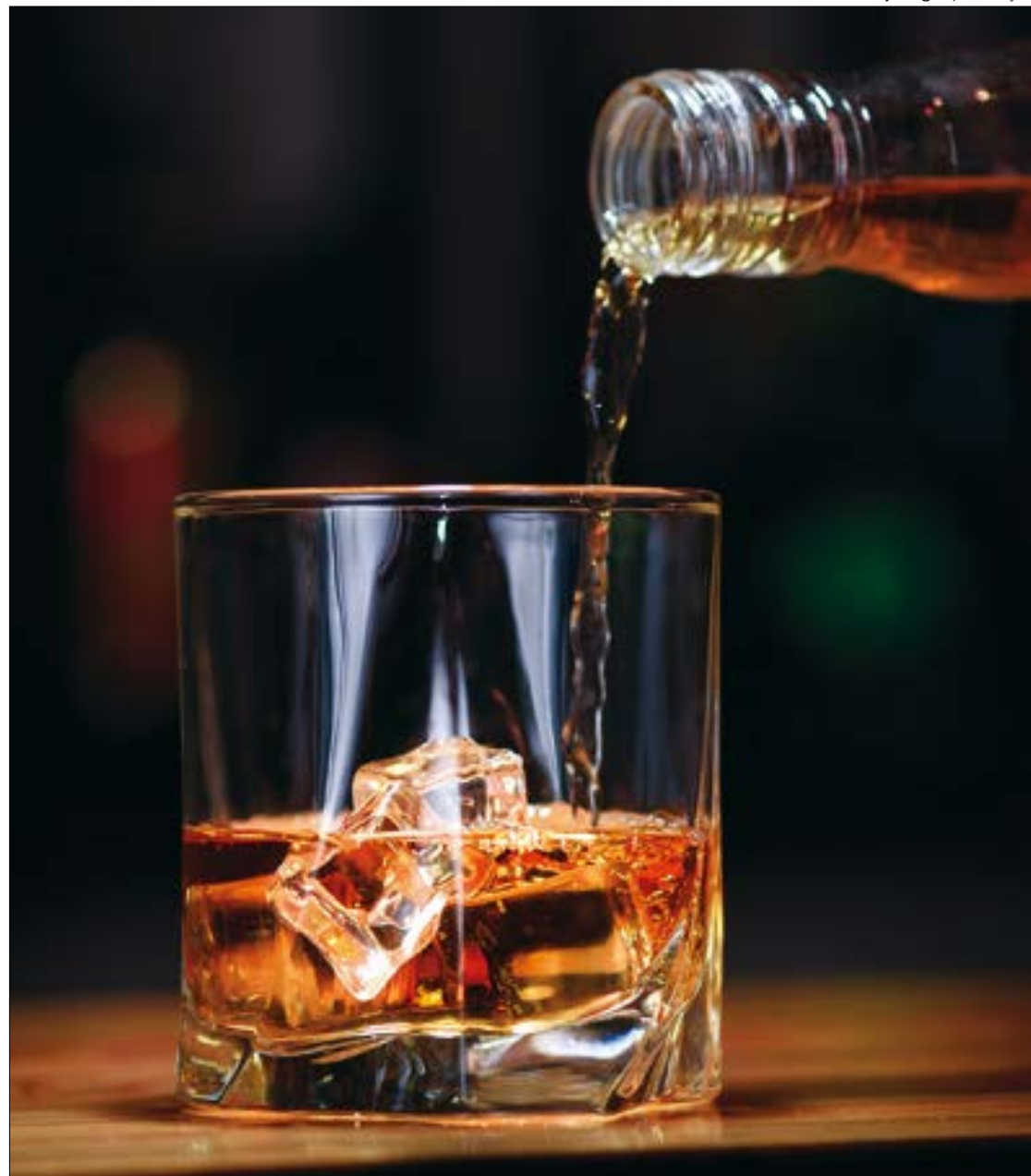
A mudança de consumo foi maior entre os homens: 12% responderam estar bebendo mais. Entre as mulheres, o consumo aumentou em 9%

- Apesar de prova em contrário, você continua afirmando que bebe