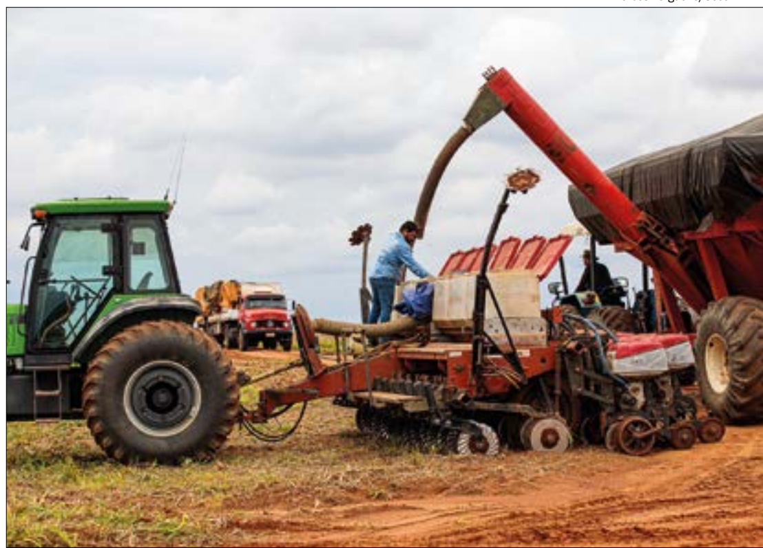
Região mais prejudicada é a Nordeste, no Vale do Araguaia, onde a semeadura está mais atrasada

Por outro lado, o último boletim aponta uma redução do custeio para a safra 22/23 em 2,68%, impactado principalmente pelo recuo da semente da soja (-12,55%), fertilizante e corretivo (-15,68%). Já o custo operacional total (COT) teve aumento de 4,81%. Para cobrir o COT, o produtor deve vender a saca acima de R$ 116. Nesta terça (22), a saca estava cotada em até R$ 170.