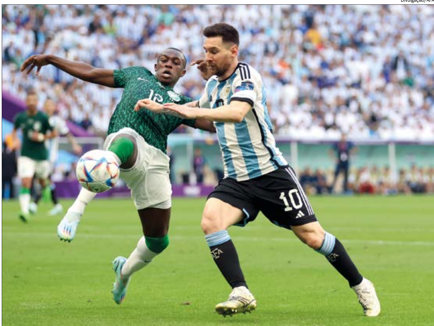
Derrota para a Arábia Saudita deixa a Argentina em situação complicada na fase de grupos

Dentro de campo, mesmo com a vitória parcial na primeira etapa, a Argentina já demonstrava um baixo nível técnico. O desempenho fraco se confirmou no segundo tempo e até piorou. Apesar da má partida, o técnico da Argentina, Lionel Scaloni,