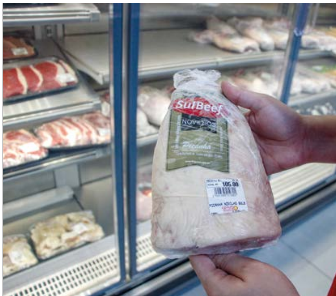
Aumento no abate de fêmeas deve causar queda no preço da carne no curto prazo

Pecuaristas reclamam que o valor da arroba se mantém no mesmo patamar, ou em queda, nos últimos anos. Porém, os