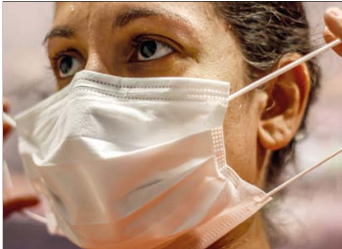
A vacinação, além de medidas de proteção individual, como o uso de máscara, contribuem para reduzir a transmissão de infecções

"Estou muito preocupado com essa subvariante, que tem atingido alguns estados, inclusive que já estabeleceram o uso de máscara em ambientes fechados.