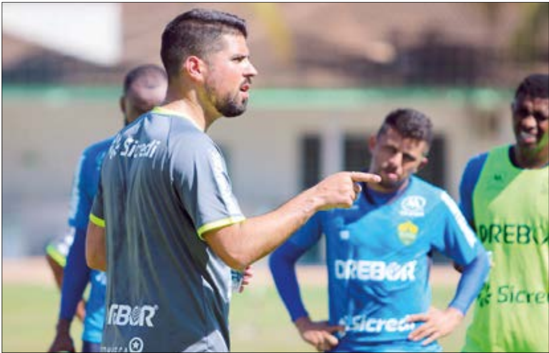
Campanha do Cuiabá foi marcada por altos e baixos, mas o time conseguiu se livrar do rebaixamento no último momento

Sobre o assunto, o vice-presidente de futebol do