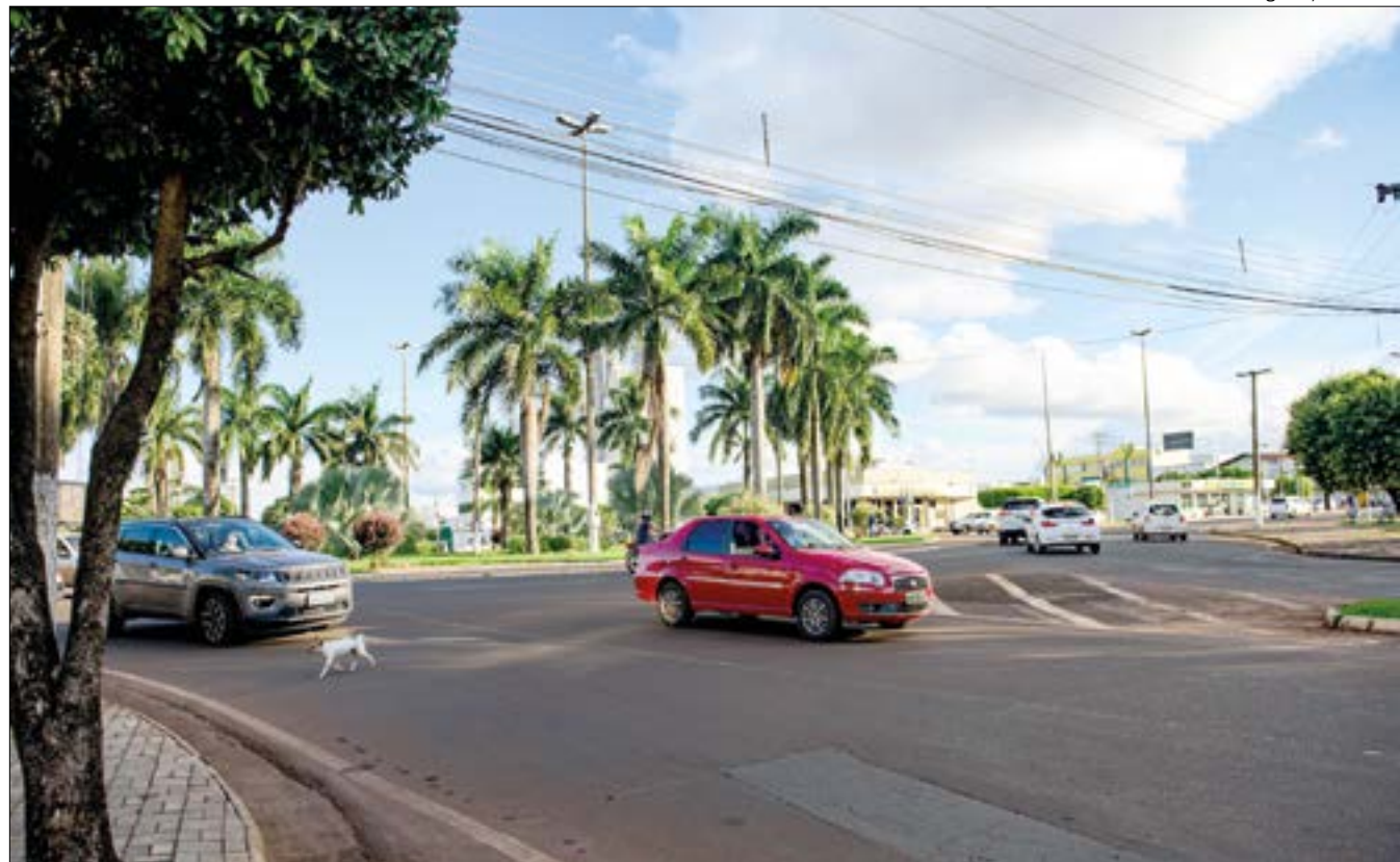
A Prefeitura fará micro revestimento, que também faz parte do processo de conservação

A expectativa é que a obra seja entregue à população no próximo aniversário de emancipação da cidade, em 13 de maio.