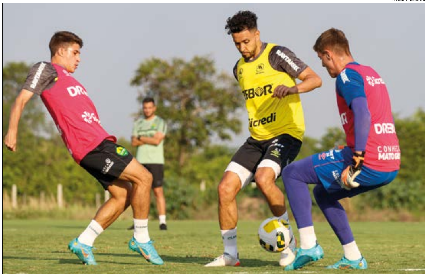
O Dourado já enfrentou o Galo por três vezes, tendo perdido em duas e empatado em uma