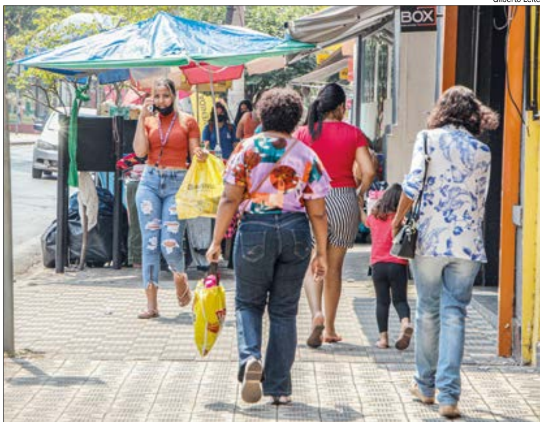
O movimento coincide com um momento de crise econômica, em um mês com dois feriados nacionais e um regional

VEJA A NOTA NA ÍNTEGRA - A Federação das Câmaras de Dirigentes Lojistas (FCDL/MT), vem por meio desta nota manifestar