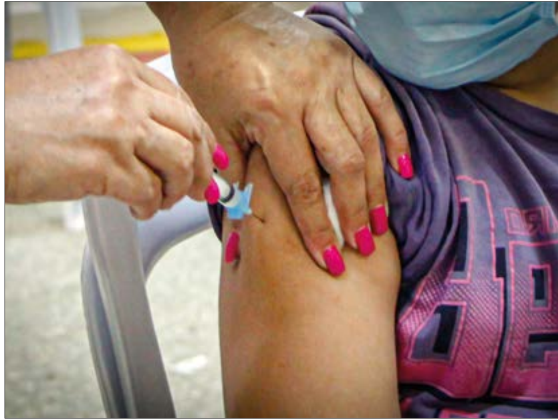
Na capital, a maior incidência de casos está sendo registrada em pessoas com idades entre 31 e 40 anos