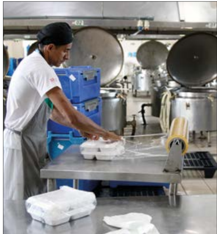
CNI aponta melhora na situação financeira de micro e pequenas empresas