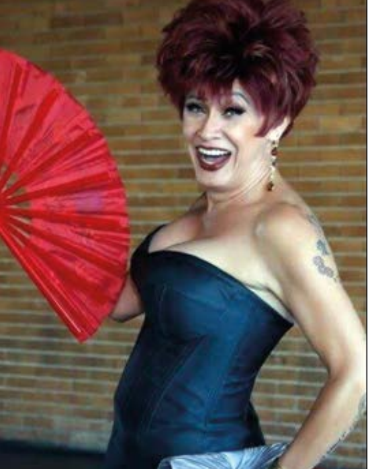
Nany People vai estar em Cuiabá 19 de novembro em grandioso espetáculo

A prefeitura de Peixoto de Azevedo (200 quilômetros de Sinop) abriu as inscrições para o festival de música do município, realizado nos próximos dias 9 e 10 de dezembro e distribuirá R$ 8,8 mil para intérpretes em cinco categorias. Os candidatos poderão concorrer nas categorias mirim (5 a 9 anos), infanto-juvenil (10 a 14 anos), adulto gospel (acima de 15 anos), adulto MPB (acima de 15 anos) e música sertaneja (acima de 15 anos). As inscrições são limitadas a 15 participantes por categoria. Os prêmios para as categorias sertanejo, MPB e gospel são de R$ 1 mil para o primeiro colocado, R$ 700 para o segundo e R$ 500 para o terceiro. Os vencedores da categoria infanto-juvenil receberão R$ 600 (1º lugar), R$ 400 (2º lugar) ou R$ 300 (3º lugar). Já na categoria mirim a premiação será de R$ 400 para o vencedor, R$ 300 para o segundo e R$ 200 para o terceiro. O edital está disponível no site da prefeitura de Peixoto de Azevedo.