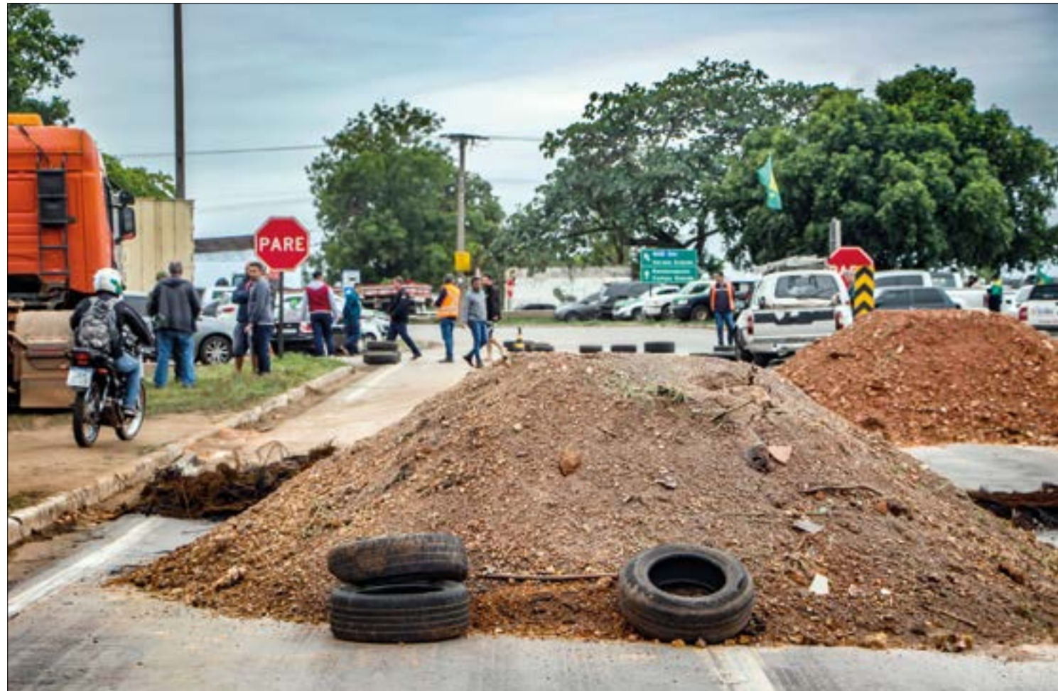
As manifestações são consideradas criminosas e participantes sofrerão consequências, garantiu Alexandre de Moraes

Ao chegar no local, os policiais prenderam o homem e levaram para o plantão de violência doméstica.