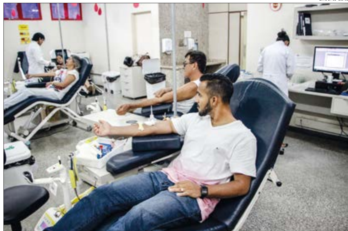
As coletas ocorrerão entre 7h30 e 12h e podem ser agendadas virtualmente

13 de Junho, 1.055, Centro Sul, Cuiabá. O funcionamento regular da unidade ocorre de segunda a sexta-feira, de 7h30 às 17h30.