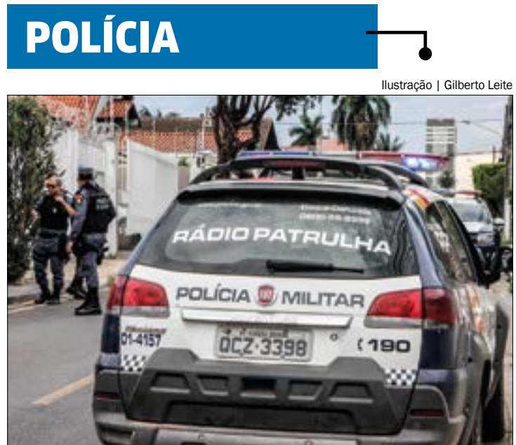
O homem foi alvejado após puxar uma arma contra criminosos que estavam batendo nele

A redação entrou em contato com a Secretaria Estadual de Segurança Pública (Sesp) para obter os números dos trechos nas rodovias estaduais que estavam bloqueados por manifestantes, mas até o término dessa matéria, não obteve resposta.