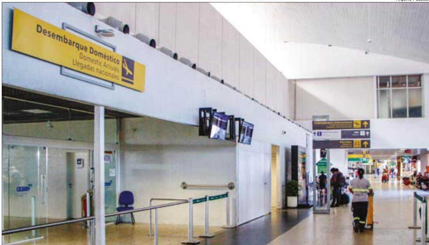
Com fronteiras fechadas, oito estudantes da UFMT que estão na Colômbia enfrentam dificuldades para retornar ao Brasil

“Com o fechamento das fronteiras, o meu voo que era previsto para o dia 11 de junho foi cancelado, e a situação fica um pouco mais delicada também porque eu viajaria pela Avianca e a companhia, há poucos dias, iniciou um processo de recuperação judicial. Não sei bem como funcionará, mas a companhia, por exemplo, já tinha cancelado os voos desde março e cancelaram os voos de junho antes mesmo do novo decreto estendendo o fechamento das fronteiras sair. Eu dependo de auxílio e da moradia cedida pela Univer-