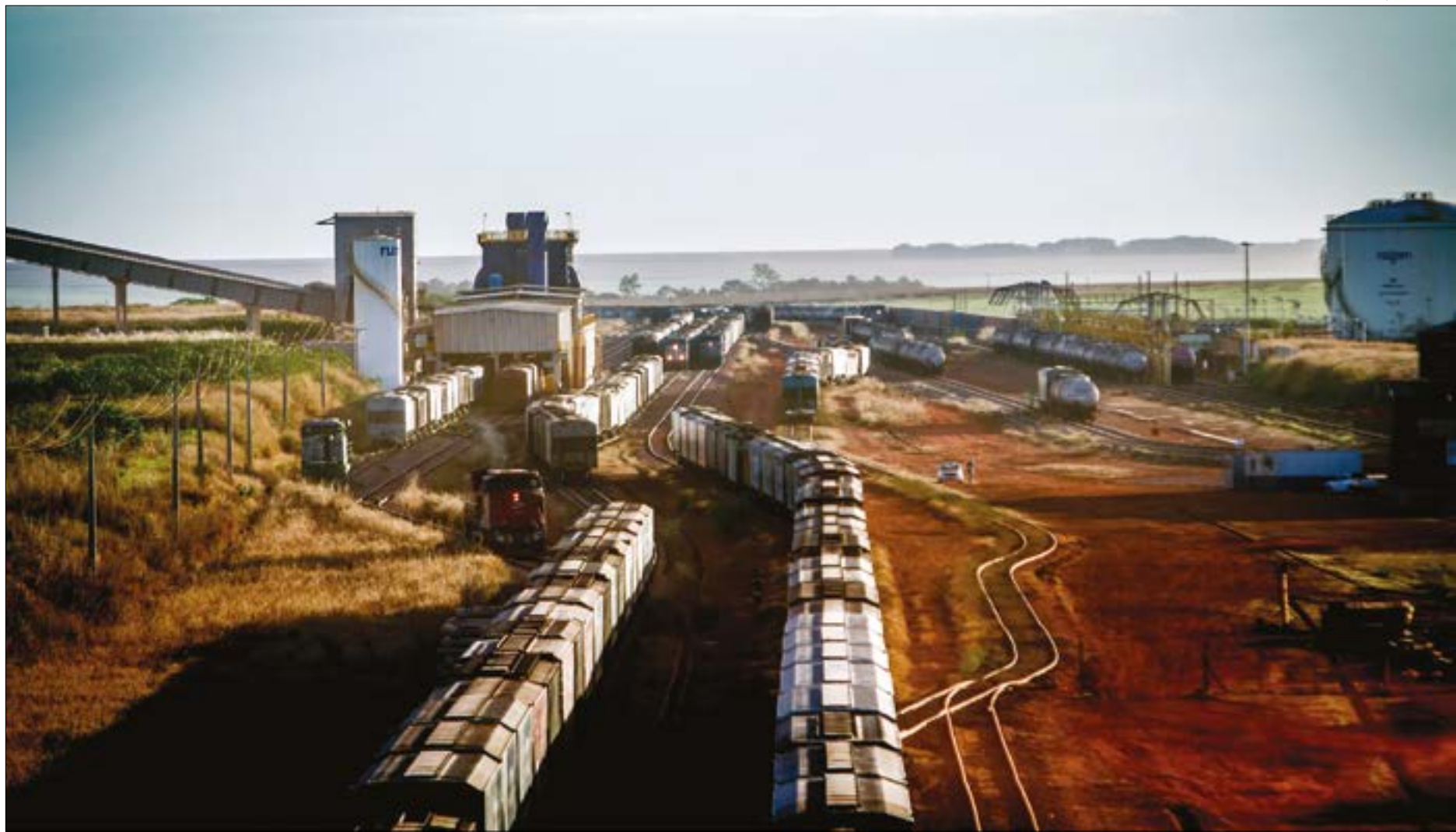
Com a decisão do TCU, empresa fica liberada para fazer investimentos na expansão da Ferronorte até Sorriso, passando por Cuiabá

“Em minha opinião, os ajustes propostos pelo ente regulador são suficientes para dirimir quaisquer ruídos, pois