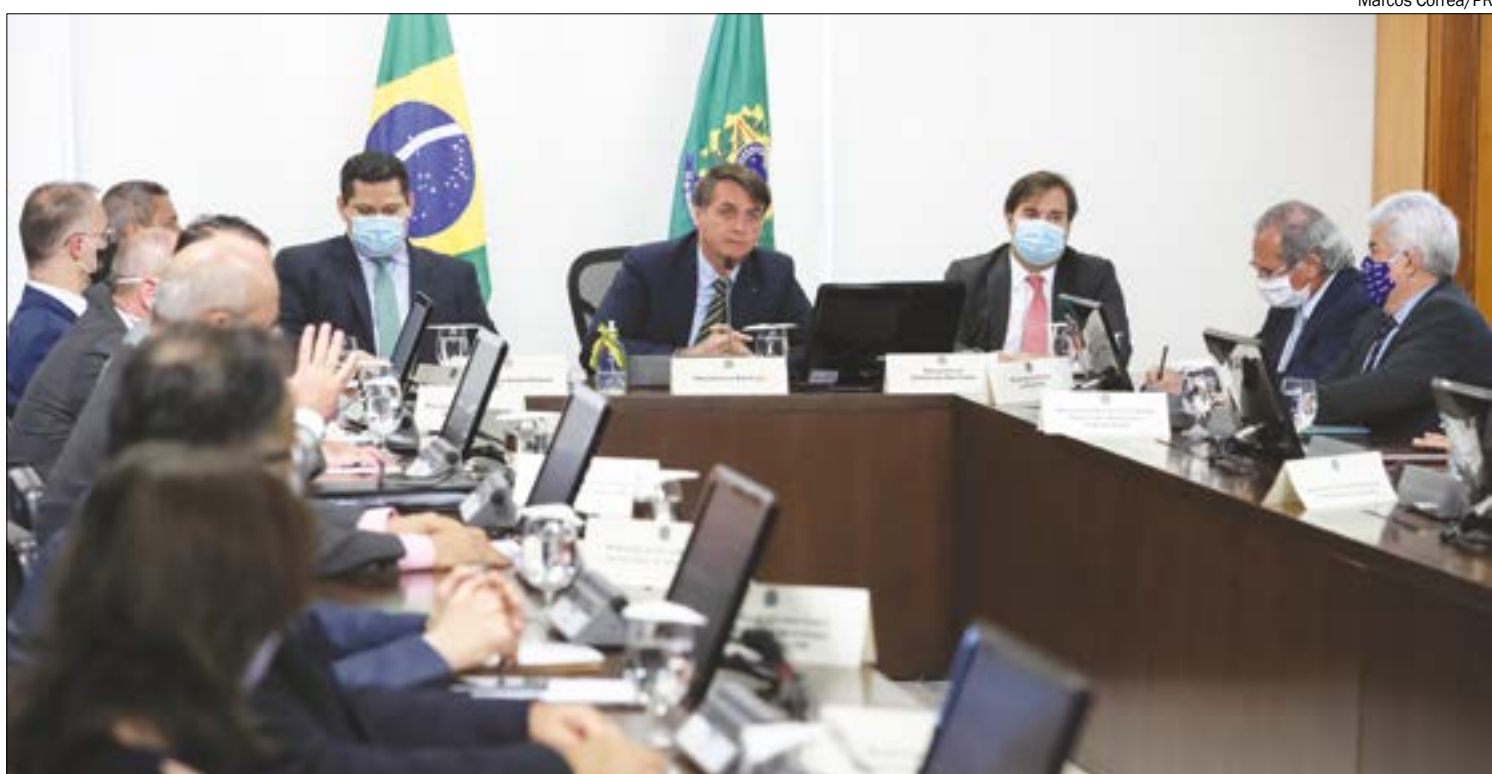
Presidente pede que governadores apoiem congelamento de salários para os servidores públicos

"Nesse momento difícil que o trabalhador enfrenta, alguns perderam seus empregos, outros tendo salário reduzido, os informais que foram duramente atingidos nesse momento, buscar maneiras de, ao