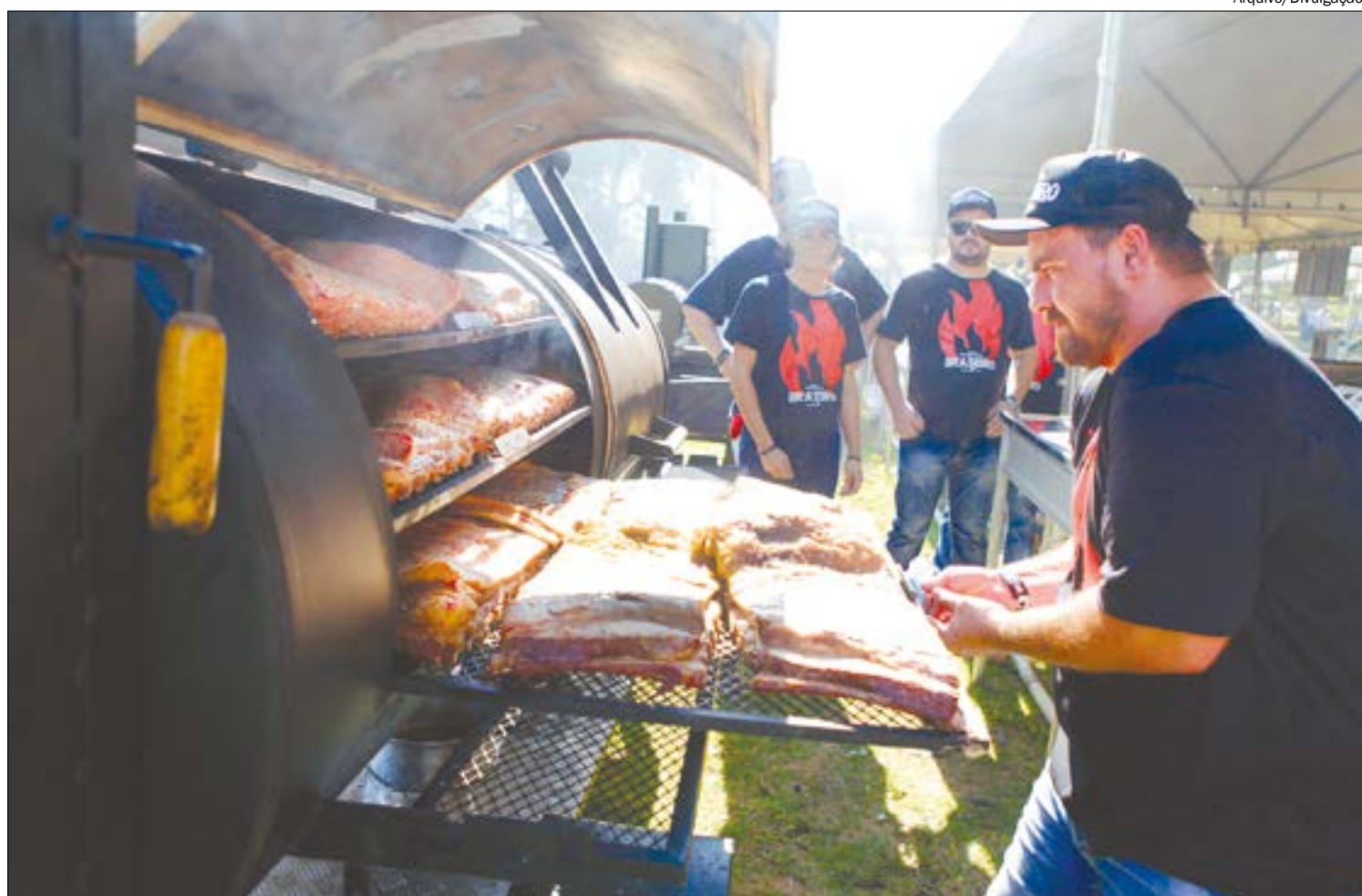
Churrasqueiros experientes darão aulas de cortes e técnicas para você assar uma carne deliciosa. Em troca, pedem ajuda para famílias carentes

As doações às famílias carentes serão intermediadas pela Igreja Católica. Em Rondonópolis, por exemplo, a Igreja identificou 692 famílias em situação de fome. A indicação das famílias que receberão as doações será feita pelas paróquias de Cuiabá e Rondonópolis.