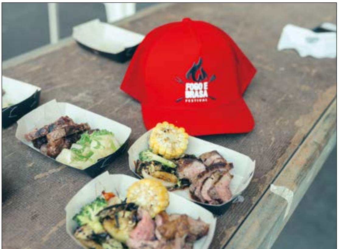
Gente bonita, estrutura impecável, carne da boa: parabéns Festival Fogo e Brasa!