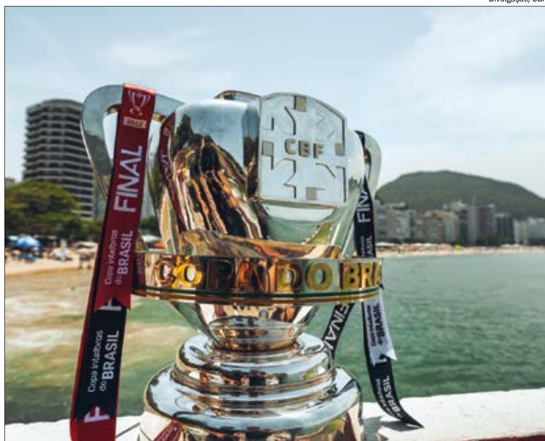
Após Flamengo e Corinthians empatarem em 0 a 0, jogo segue aberto para a grande final no Maracanã

Para o jogo, duas coincidências marcarão a disputa. A primeira é que qualquer que seja o campeão, ele será consagrado como tetra, pois as duas equipes já somam três troféus da competição. A segunda é que os dois times vêm de