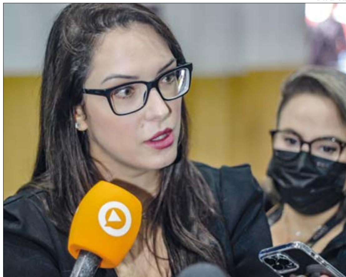
Janaina diz não haver espaço para disputar presidência da Casa com Max e Botelho