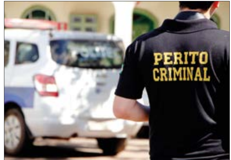
Thaynan foi morto dentro do pátio de uma concessionária em Sinop. Suspeitos foram presos em um bar