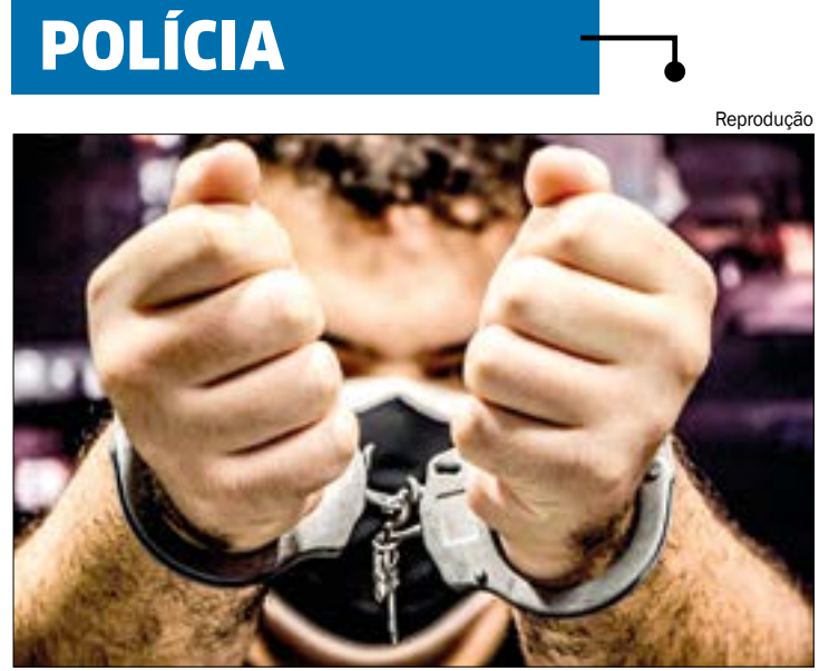
O homem já havia tentado entrar na residência e todos estavam esperando para saber a motivação

O que levar no dia da prova: documento de identidade com foto; cartão de inscrição (local de prova); caneta esferográfica fabricada em material transparente e de tinta preta.