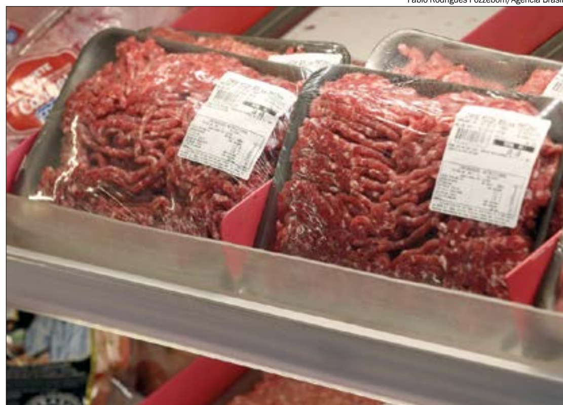
Não é permitida a obtenção de carne moída a partir da raspagem de ossos

A carne moída resfriada deverá ser mantida entre 0°C e 4°C e a carne moída congelada à temperatura máxima de -12°C. O produto não poderá sair do equipamento de moagem com temperatura superior a 7°C e deve ser submetido imediatamente ao resfriamento ou ao congelamento rápido.