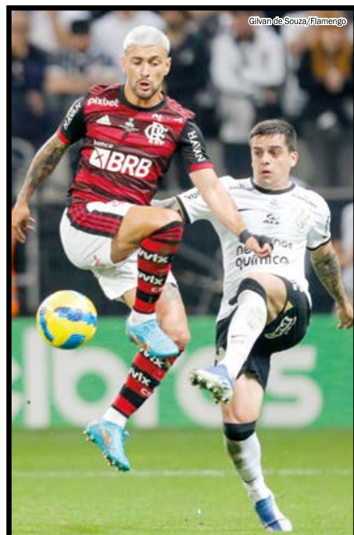
Givan de Souza/Flamengo