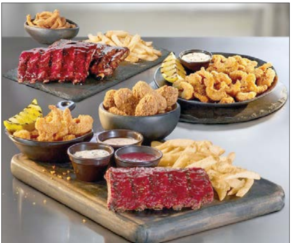
Prato Master Chef