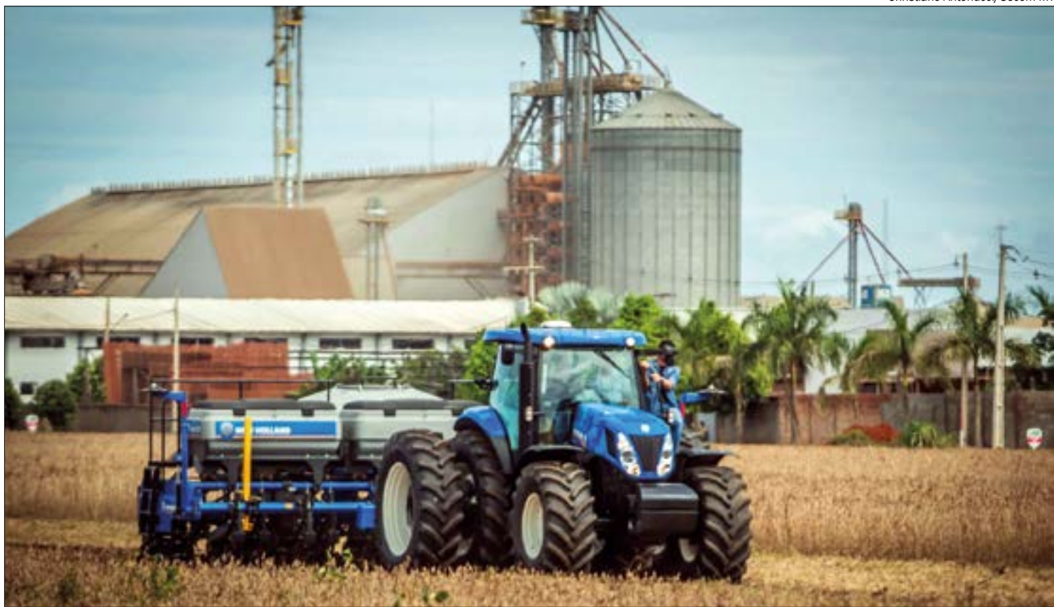
Produtividade prevista para nova safra cresceu, o que aumenta a necessidade de armazenamento

A estimativa de produção também sofreu elevação, puxada pela perspectiva de aumento de