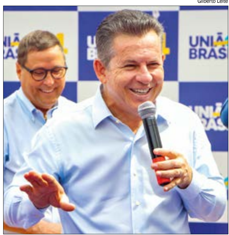
Mauro citou que outros países da América do Sul estão sofrendo consequências da 'guinada à esquerda'