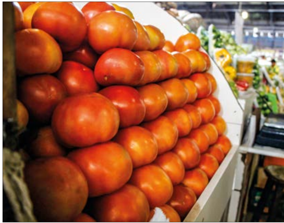
Tomate é o 'grande vilão' da cesta básica, com aumento de 48% no último mês