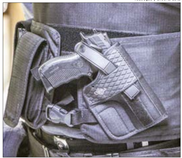
O suspeito estava na praça do bairro quando foi abordado pela polícia