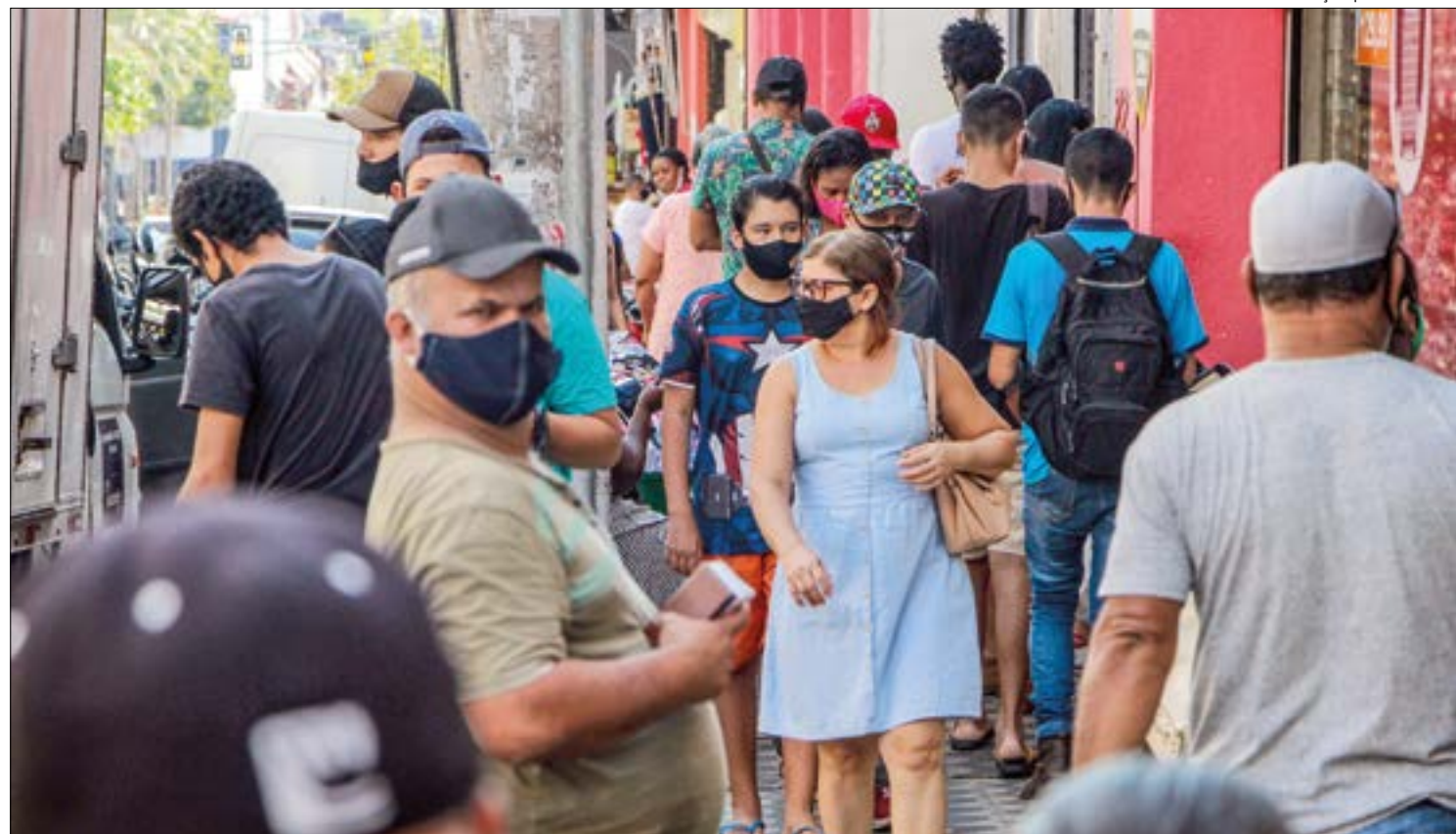
Ilustração | Gilberto Leite

Não havia nada de ilícito em posse do suspeito e ele foi levado à delegacia.