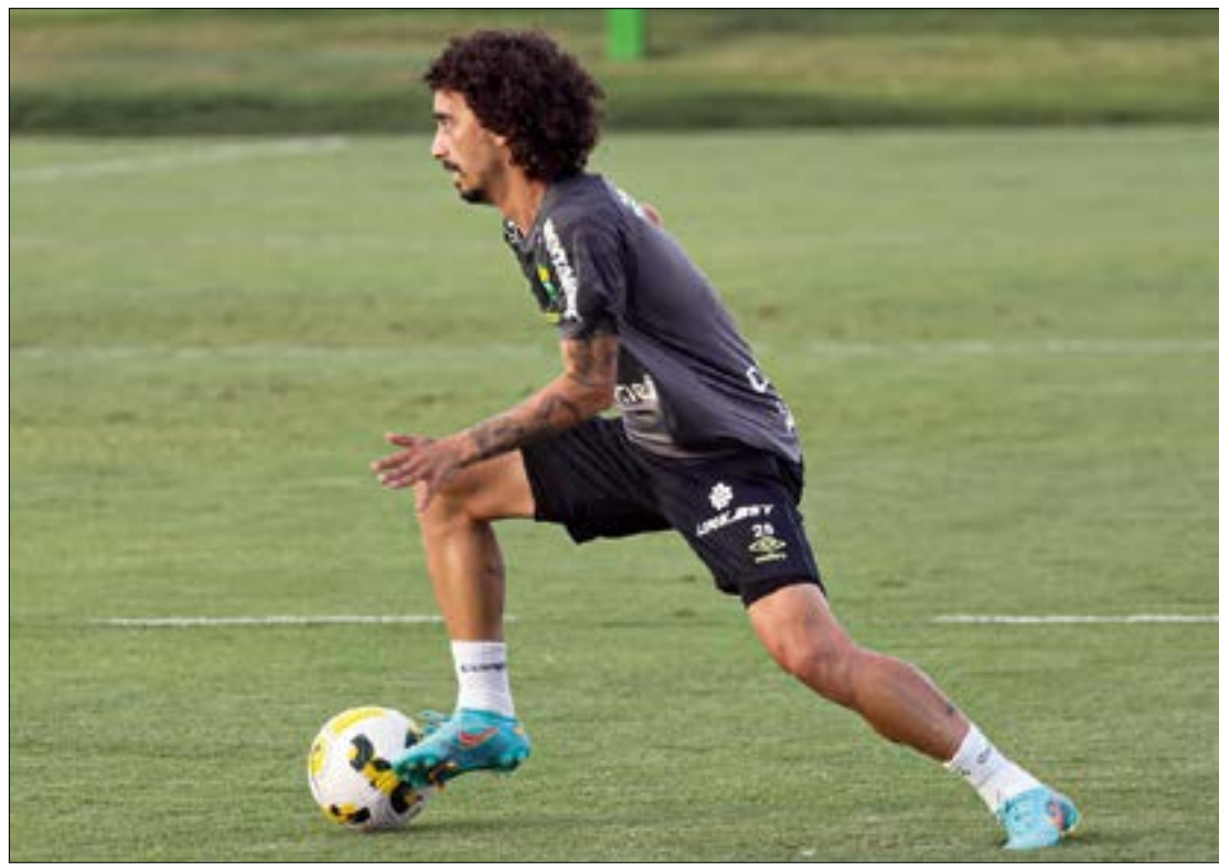
Valdivia está de volta para ajudar o Cuiabá em jogo contra adversário que só venceu uma vez na história