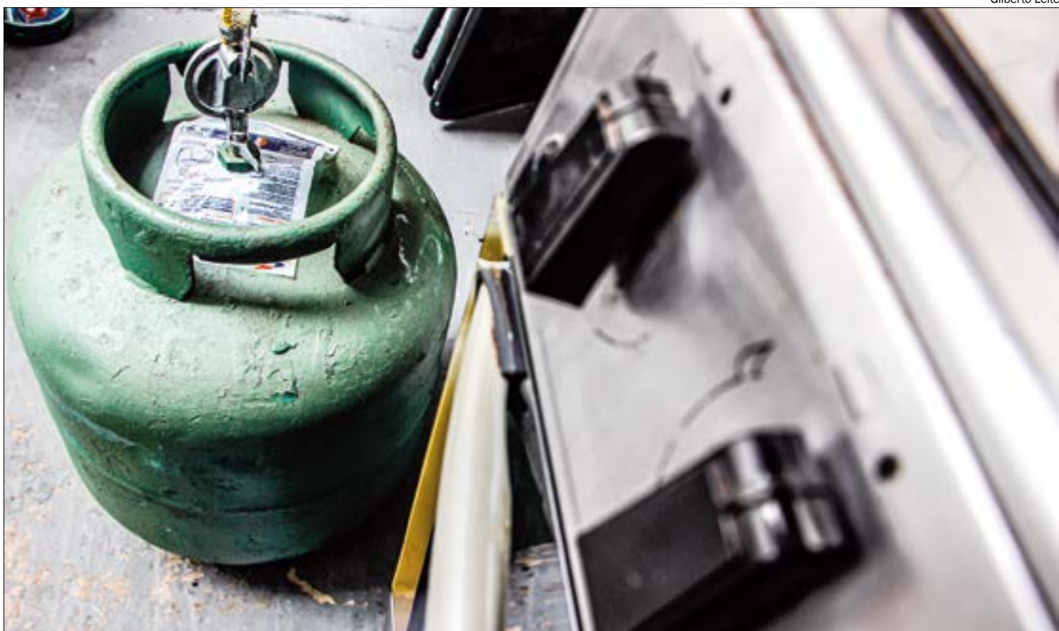
Empresário aponta que preço do botijão de gás deve cair ao longo da semana, variando conforme o bairro

Os números são do último levantamento de