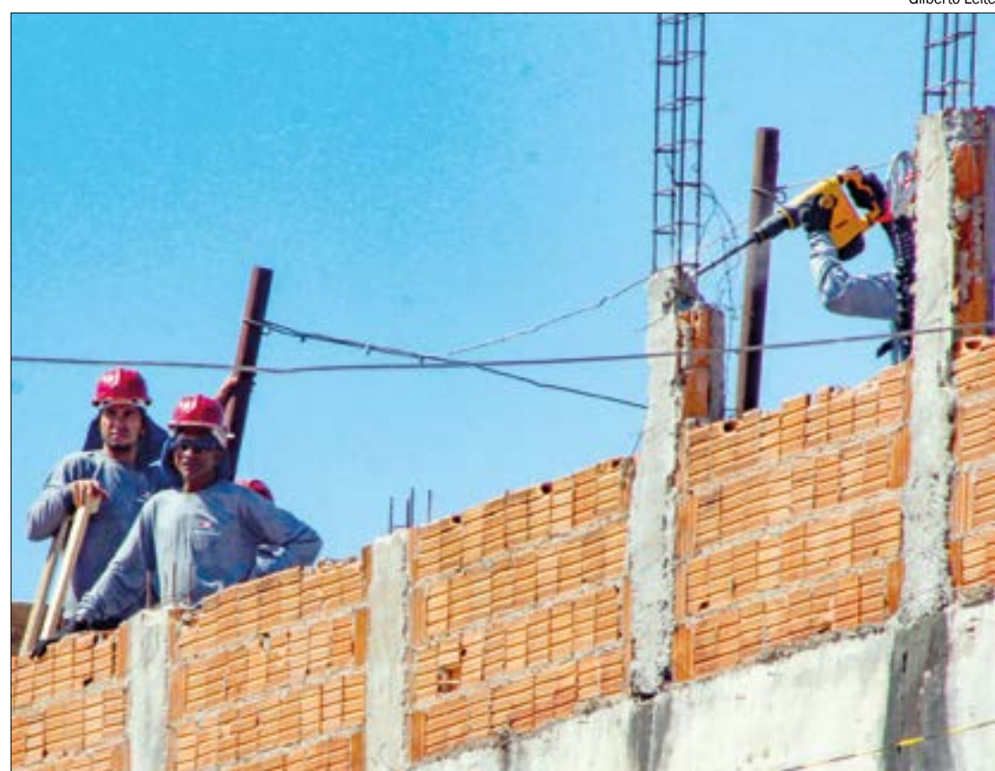
Advogado alerta que processo de distrato sempre traz prejuízos ao comprador

Para o advogado, a melhor saída para o consumidor que comprou imóvel na planta e não conseguiu