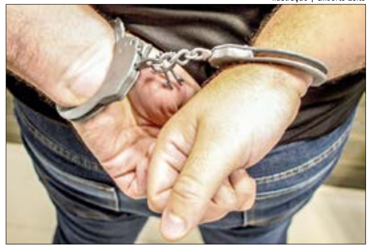
Sônia estava separada do ex-marido e trabalhava em um bar. Ele chegou armado e a matou