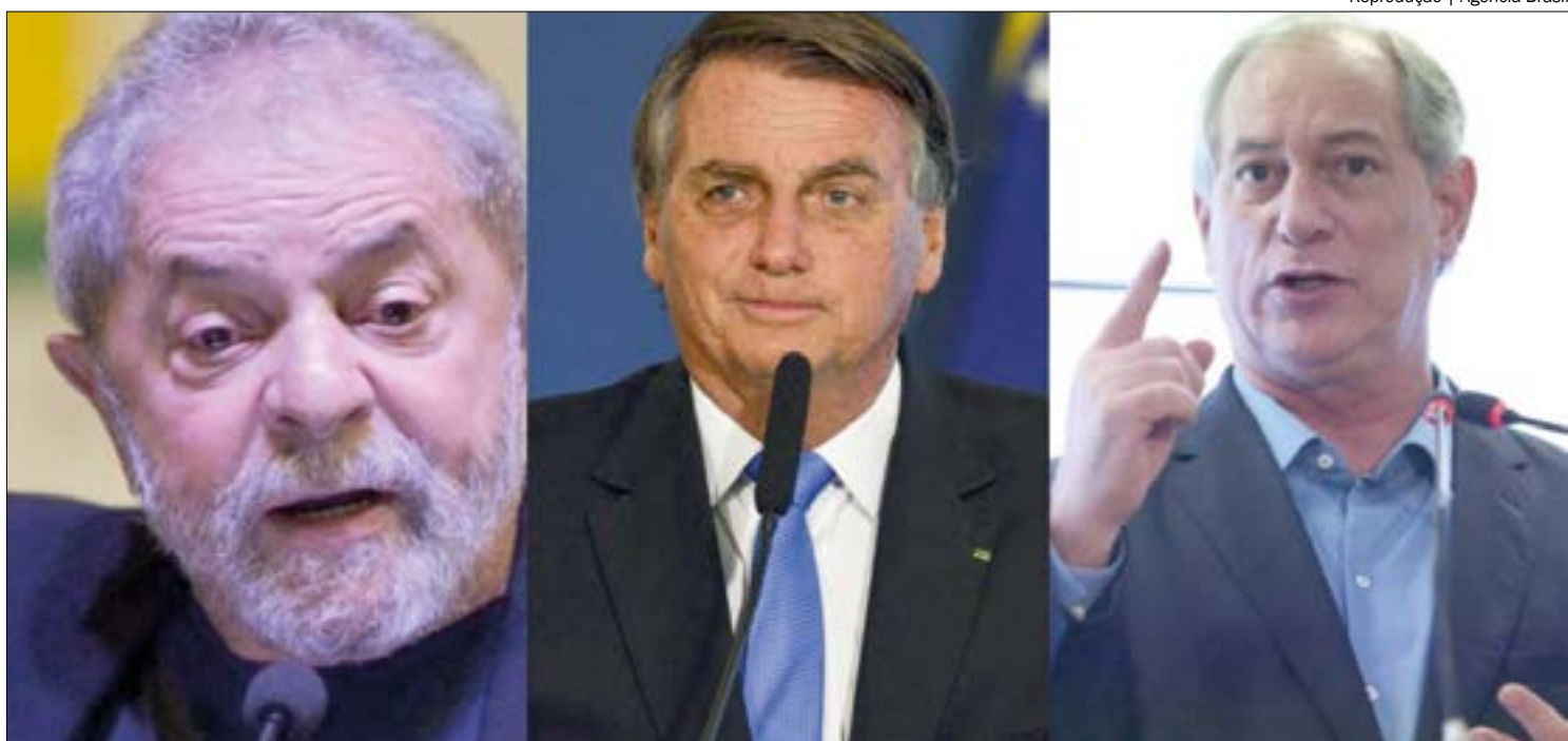
Principais candidatos à presidência 'ignoraram' Mato Grosso e mais cinco estados durante a campanha

Lula aceitou 14 propostas elaboradas por