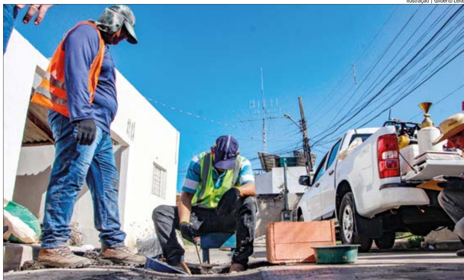
Ilustração | Gilberto Leite

Stopa ressaltou ainda que a medida não causará impactos ou aumento no custo da fatura para os demais munícipes. "Não estamos tirando de um lado para colocar em outro. É uma ação feita com responsabilidade, que vai expandir a justiça social. Um benefício que parece pouco, mas que fará uma diferença enorme na vida dessas famílias e pode significar um alimento a mais na mesa de mais de 30 mil pessoas", completou. Com informações da Assessoria de Imprensa.