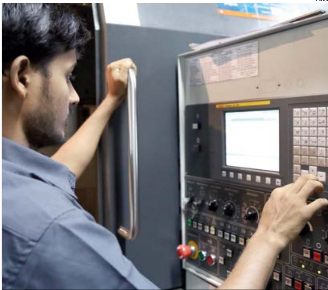
Estudo apontou a falta de 'capital humano' como um dos grandes desafios para o crescimento de MT

“É fato que, assim, trabalhador profissional, mão de obra, está faltando. Tem gente que não está pron-