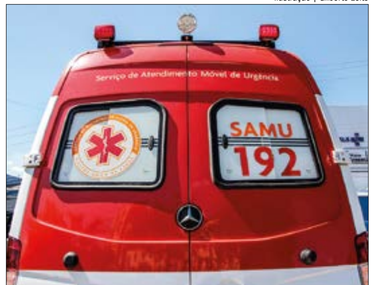
Ilustração | Gilberto Leite

O condutor disse que os adolescentes saíram de forma abrupta da escola e não conseguiu evitar o acidente