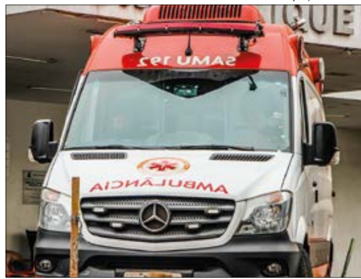
O homem estava discutindo com o irmão quando a mulher tentou apartar a briga