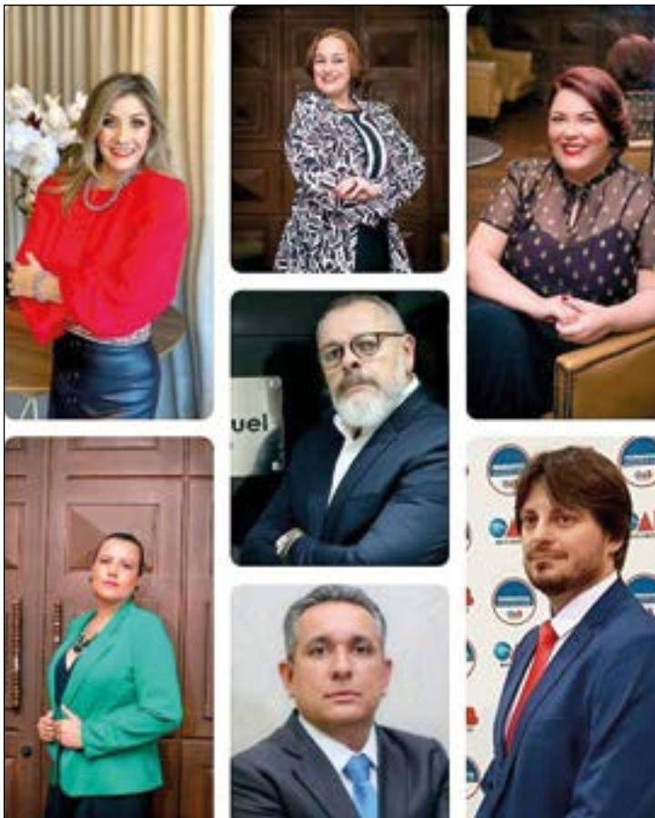
Acaba de nascer o Instituto Mato-Grossense de Advocacia Network - IMAN - de forma pioneira e inovadora ao mundo jurídico no Brasil, com dezenas de associados. A Solenidade de Posse vai contar com a cobertura do Programa Estilo e a entrega dos certificados aos associados será no próximo dia 30