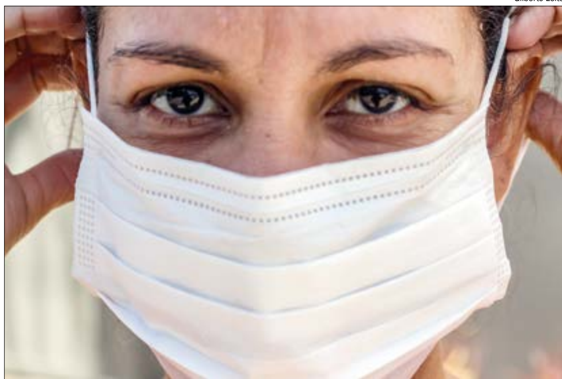
Sinop é o município que mais registrou novos casos de infectados pela doença nas últimas duas semanas

Entre os municípios que mais registraram casos de covid-19 nos últimos dias, Sinop aparece em primeiro lugar no ranking. Foram 30 novos casos, seguido por Cuiabá com 13 e Sorriso com 12.