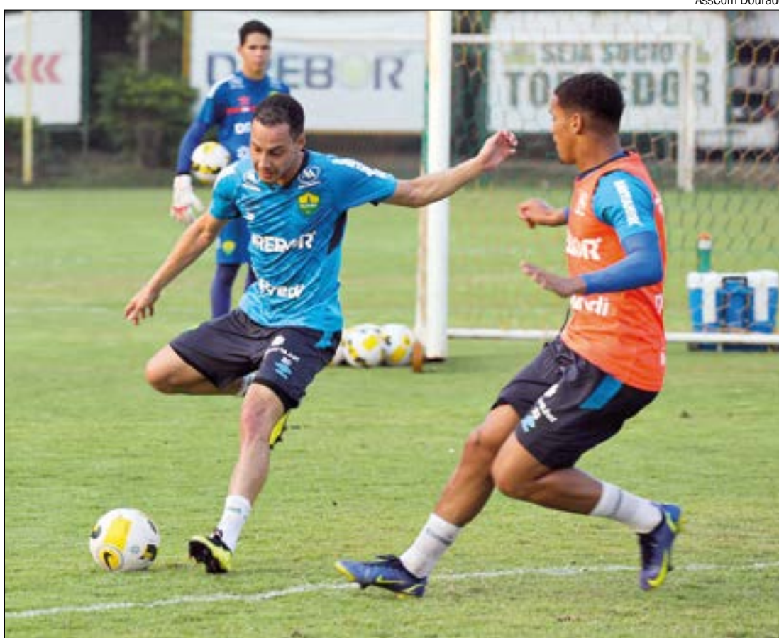
Apesar do adversário difícil, jogadores do Dourado acreditam que conseguem trazer ao menos um ponto da Arena da Baixada

“Eu saí do Athletico faz bastante tempo, mas o clube hoje é uma potência, está mostrando isso, tanto que chegou à final da Libertadores com méritos. Tem um grande elenco, um estádio que é difícil de jogar e uma torcida que apoia o tempo