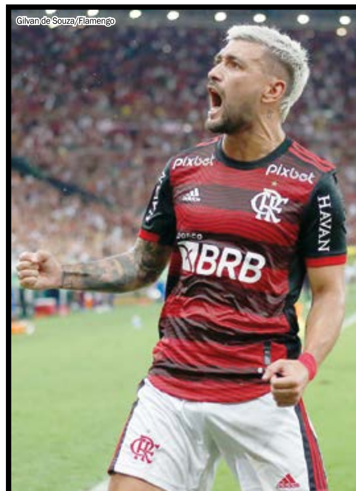
Gilvan de Souza/Flamengo