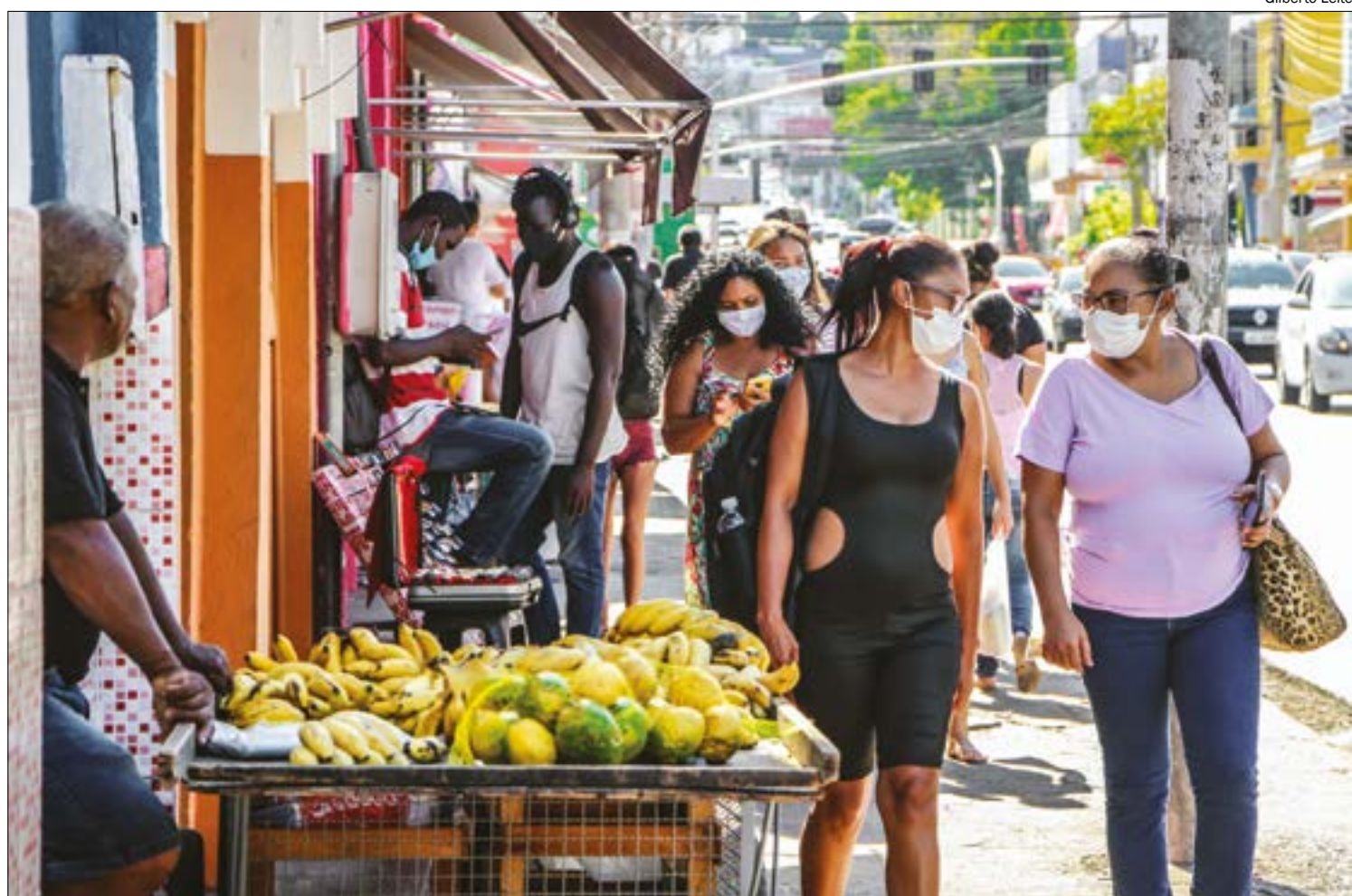
Ainda proibidos de atuar, ambulantes e feirantes terão direito a auxílio de R$ 500 da Prefeitura

Segundo o prefeito, ao longo dos três meses serão R$ 2.530.500 aplicados nessa iniciativa, sendo todo o recurso fruto de remanejamento orçamentário feito pela administração do município. “Vamos promover pelo período que preve-