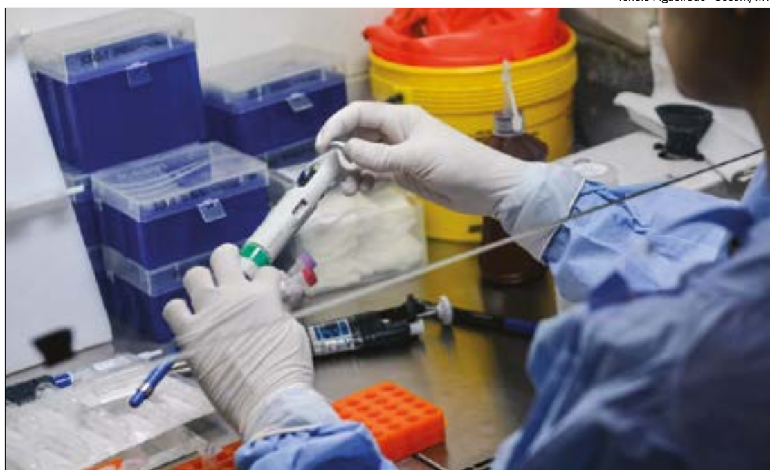
A maior parte dessas suspeitas é em servidores municipais que compõem o Comitê de Prevenção instalado na Prefeitura

A Vigilância Sanitária do Município também realizou teste em um paciente da rede particular que apresentou sintomas. O resultado foi positivo, com fase ativa da doença. Por causa disso, as pessoas de sua convivência também foram submetidas ao exame e uma delas testou positivo, em fase de cura, e assintomática.