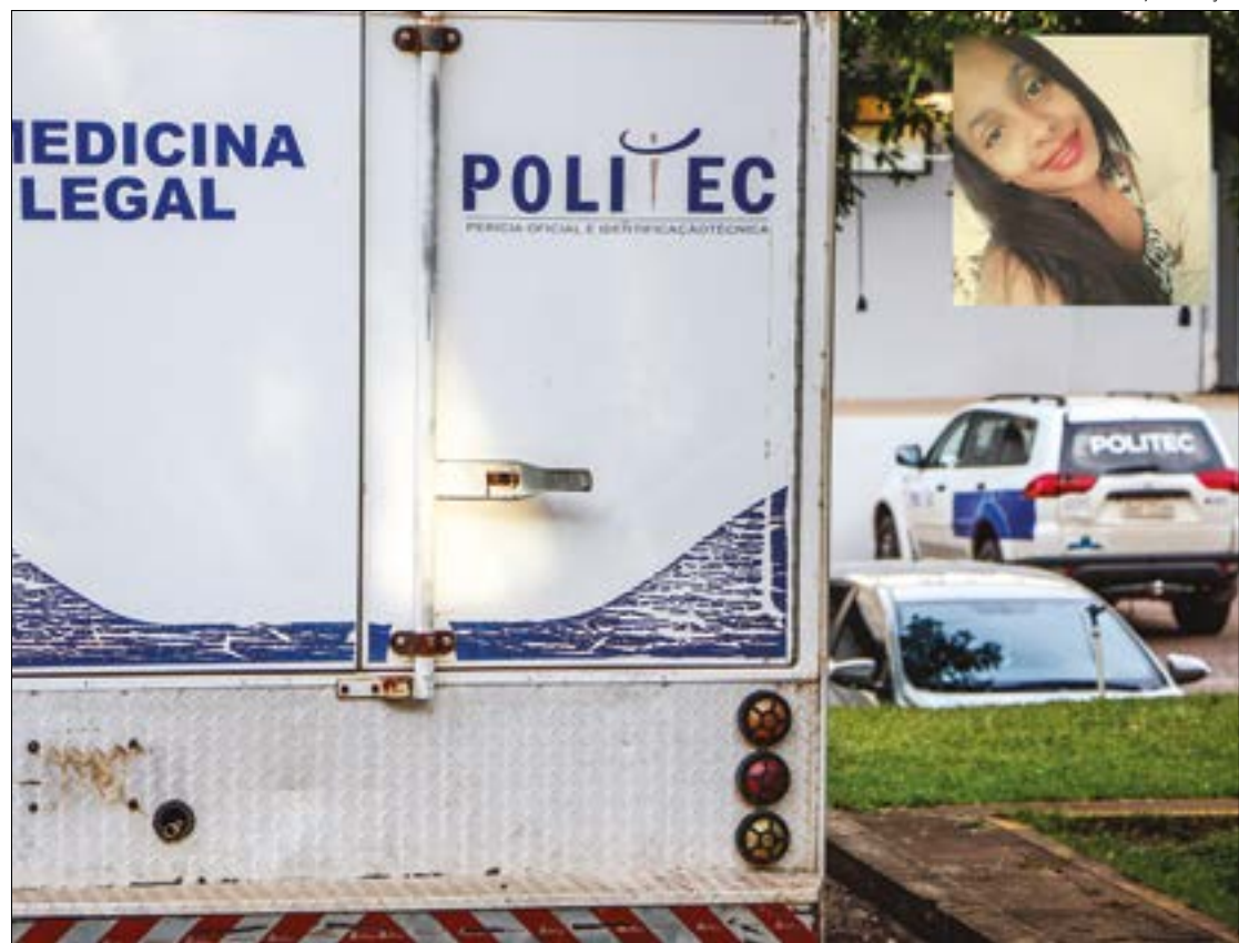
Gilberto Leite/ Ilustração