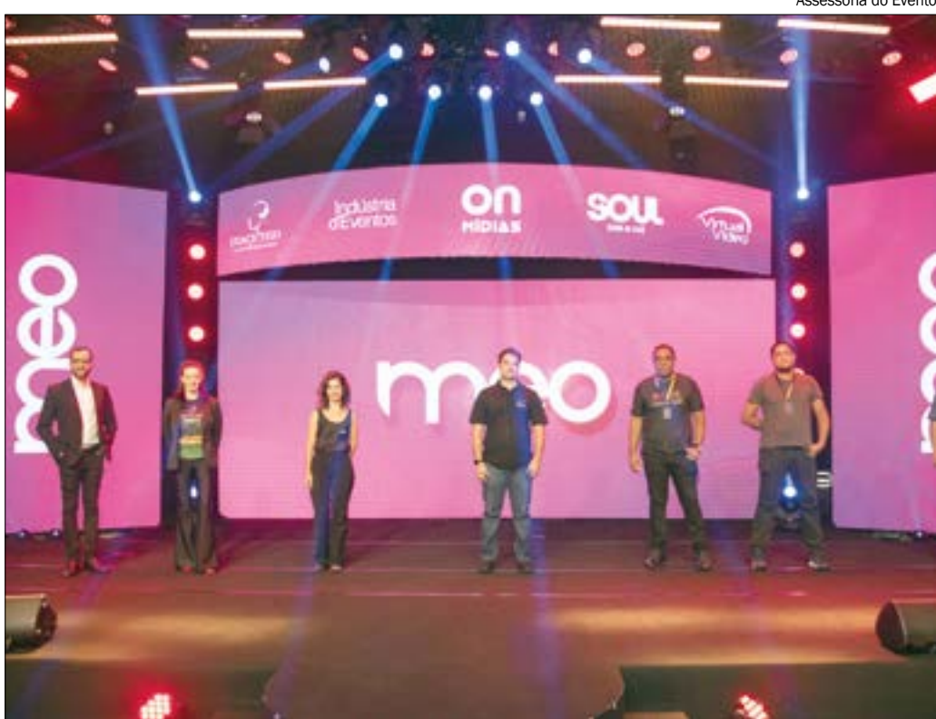
Assessoria do Evento