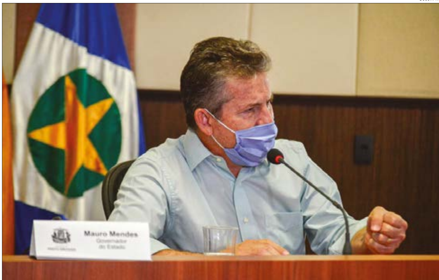
Mendes afirmou que o Estado já tem dinheiro em caixa para tocar a obra do Parque Tecnológico até a conclusão, daqui a dois anos

O Parque Tecnológico foi projetado para atrair empresas interessadas em investir em pesquisa científica e desenvolvimento tecnológico. O projeto prevê a instalação de três universidades públicas no local, que irão desenvolver pesquisas em parceria com as empresas que lá se instalarem. Segundo o governador, já há 18 companhias interessadas.