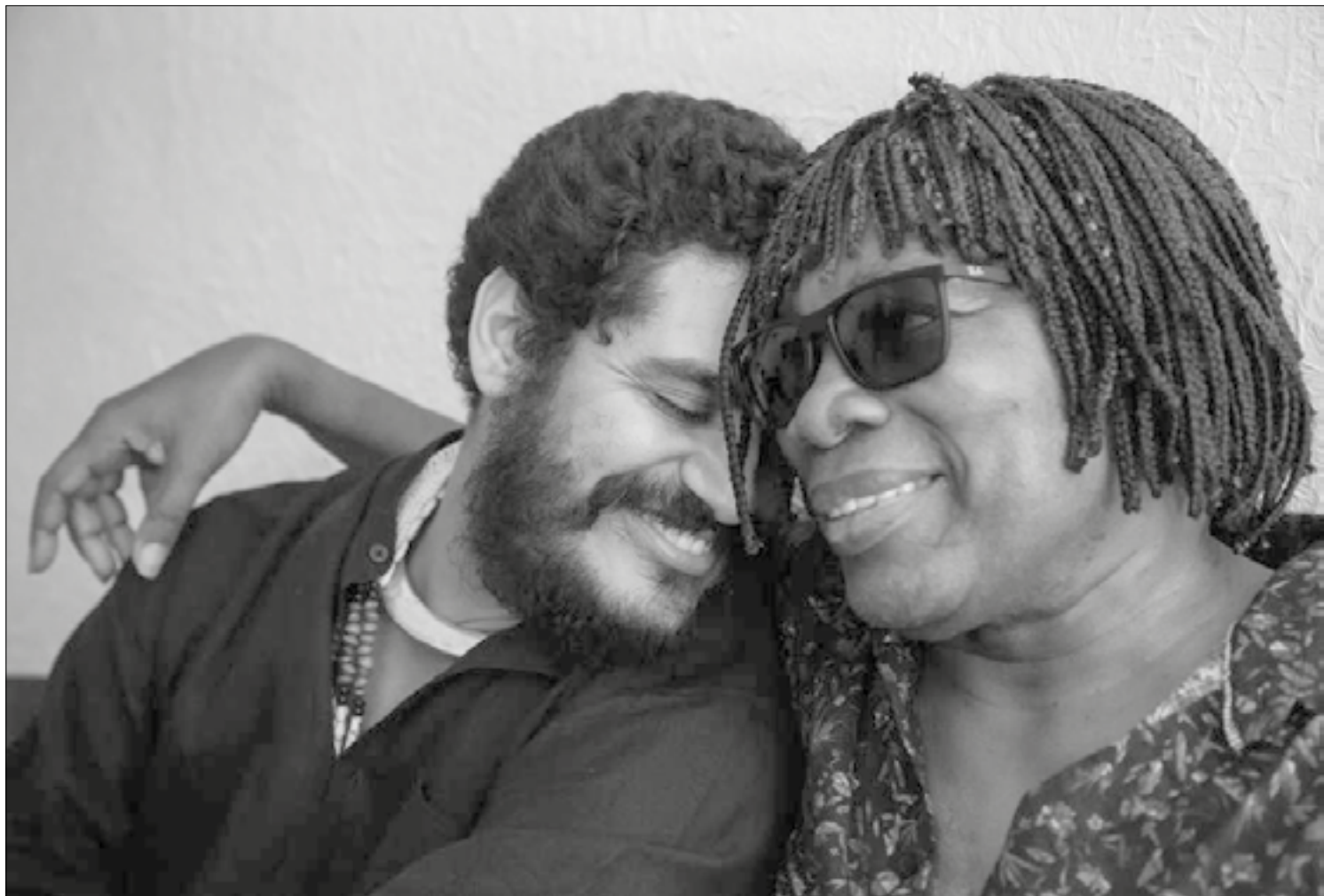
Criolo e Milton Nascimento se unem novamente, desta vez para ajudar músicos com problemas financeiros

A dupla vem acompanhada pelo pianista recifeense Amaro Freitas nas releituras de Existe Amor em SP, lançada originalmente no disco de estreia do rapper, Nó Na Orelha; e Cais, clássico do Clube da Esquina (que ganharam videoclipes filmados apenas dias antes de a quarentena começar). Já o maestro Arthur Verocai é responsável pela produção de O Tambor e Dez Anjos, esta última composta por Criolo e Milton a pedido de Gal Costa para Estratosférica, seu álbum de 2015.