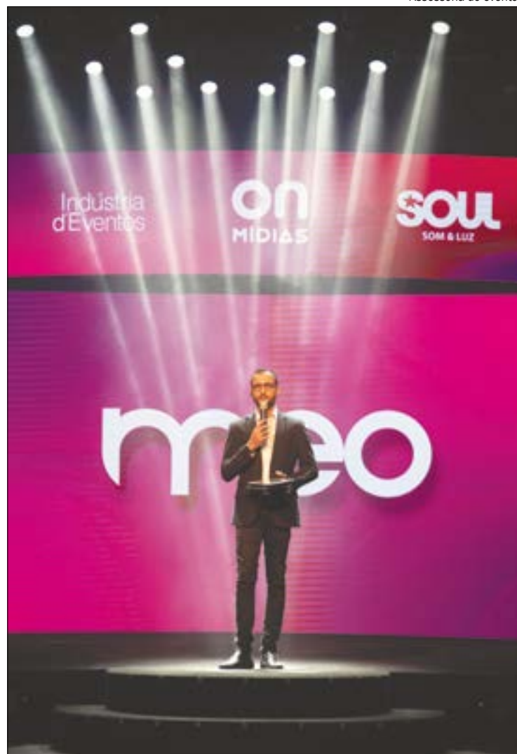
Quando todos trabalham juntos é possível elaborar projetos e políticas assertivas para o desenvolvimento

(Com informações da assessoria de imprensa)