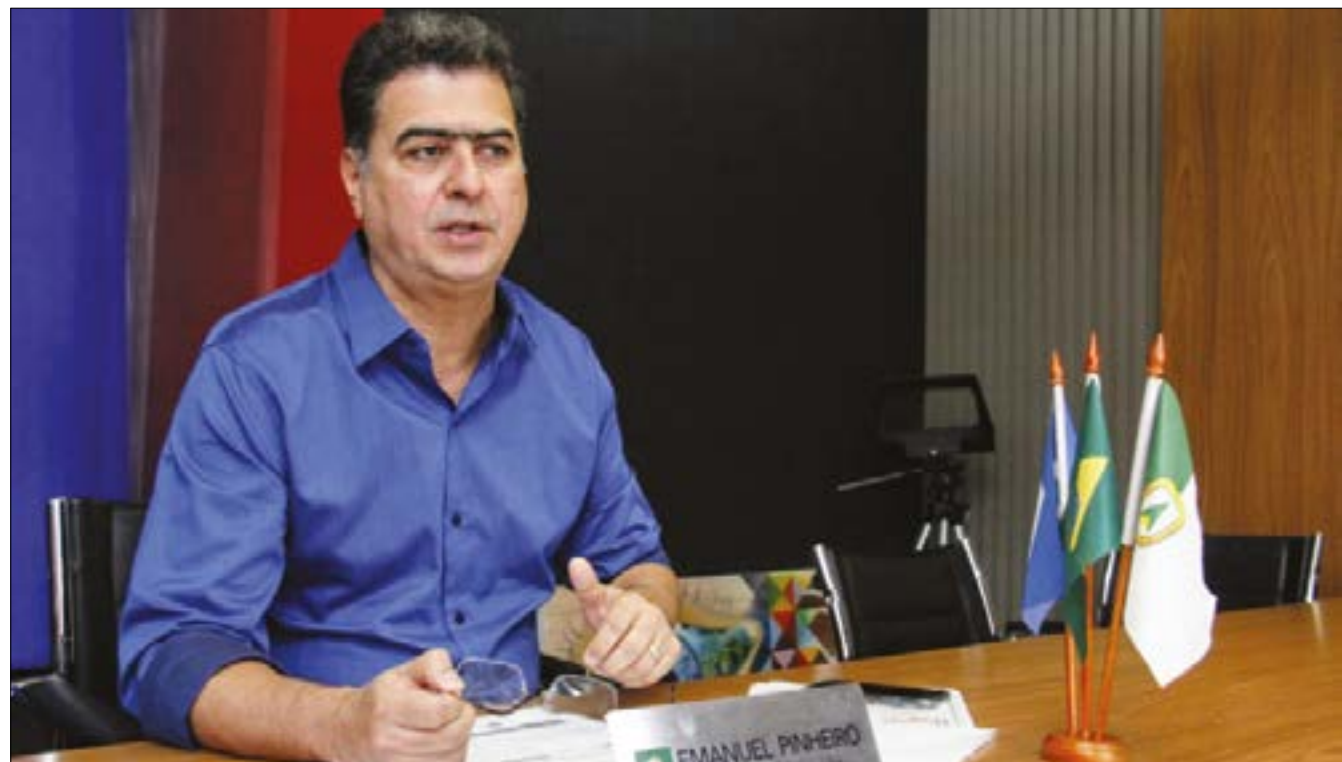
Novo decreto de Pinheiro cria restrições para uso de instalações dos condomínios em Cuiabá

bilização civil, administrativa e penal dos infratores.