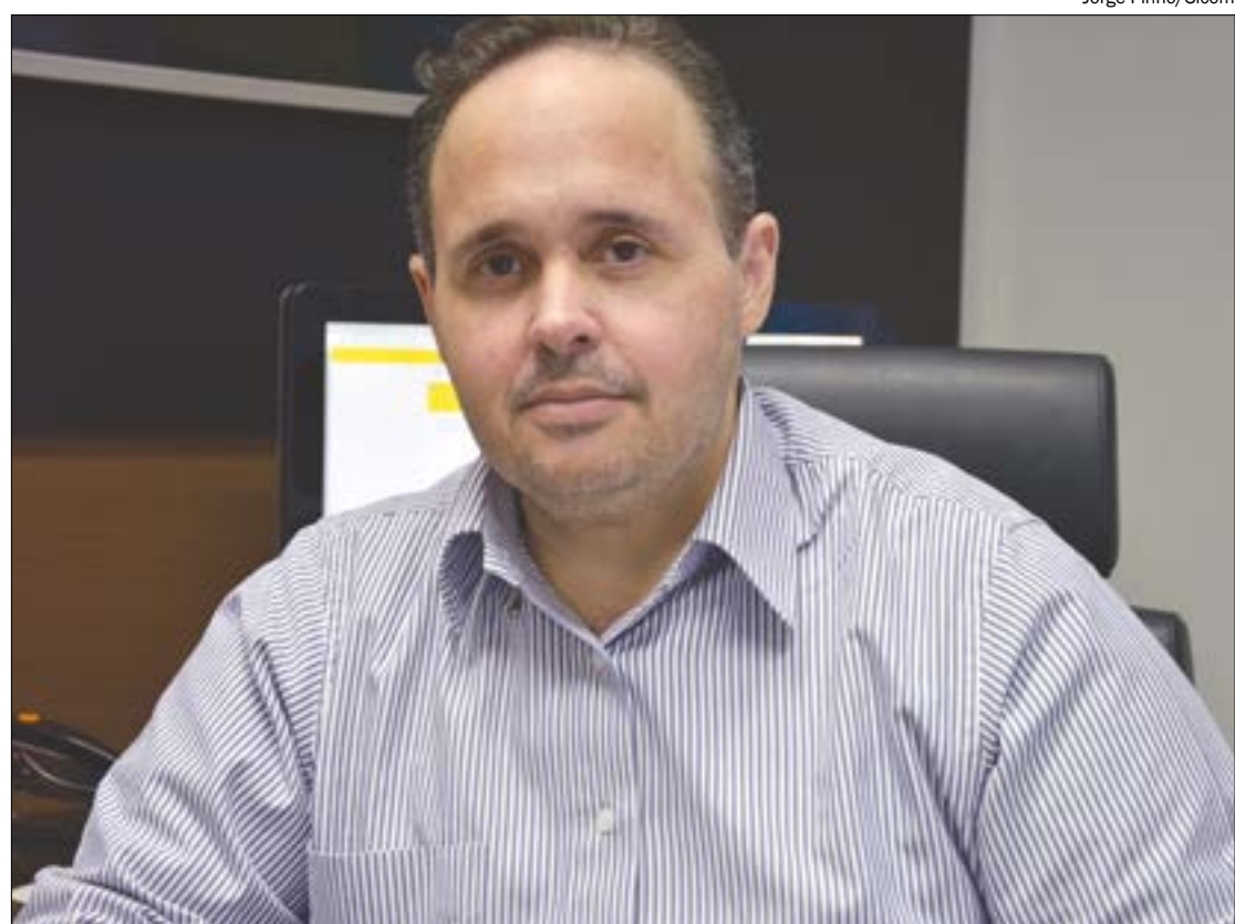
Secretário afirma que denúncia de vereador tem objetivo eleitoral e vai processá-lo judicialmente

O secretário também afirmou que o sinal da televisão chega aos 300 bairros da capital e que a pasta possui comprovação dessa afirmação. Sobre o processo de contratação, Passos afirmou que se tratou de um processo limpo e com preços abaixo do esperado.