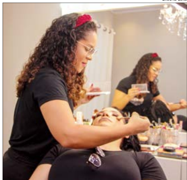
MEIs terão acesso a linha de crédito de até R$ 4,5 mil