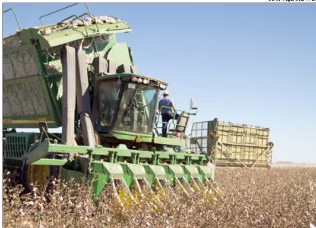
Produtores relatam perda de até 30% na produção devido a problemas climáticos

“89,56% da área estimada para a safra 21/22 já havia sido colhida, e na medida em que a colheita se aproxima do fim, a tendência é que o ritmo do beneficiamento fique mais acelerado. Assim, é esperado que os preços dos subprodutos continuem em ritmo de queda, como sazonalmente é observado neste período da colheita”, afirma o boletim.