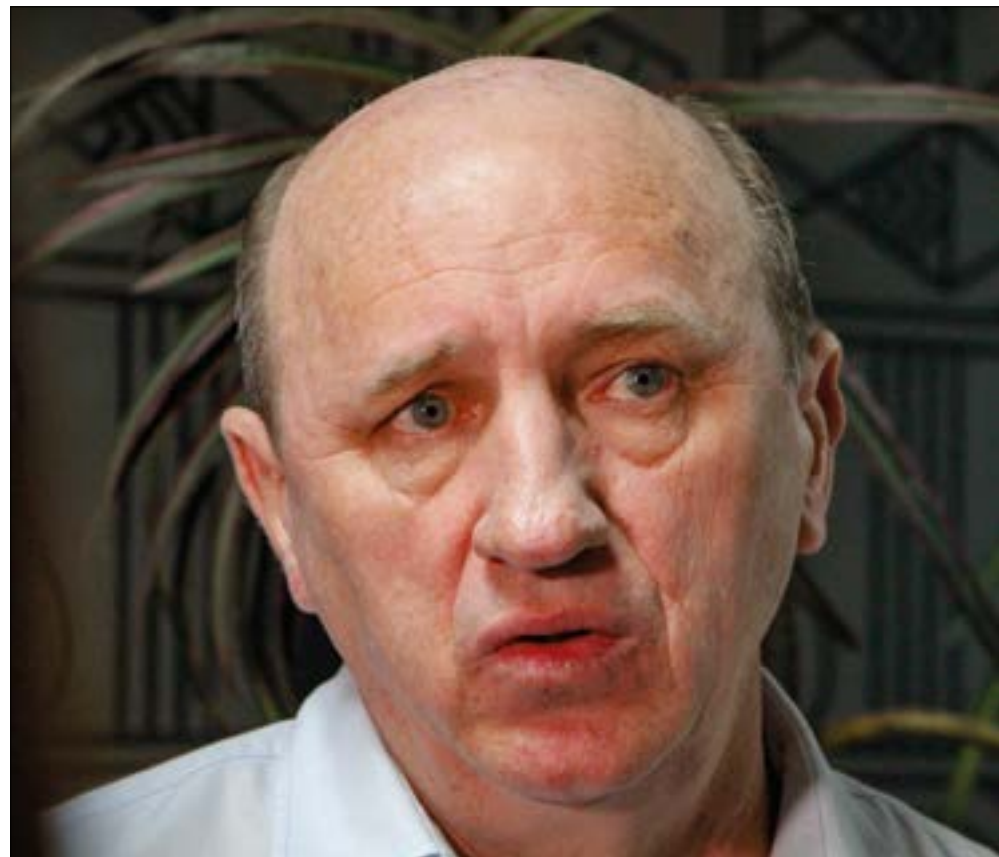
Juíza afirmou que Geller pode continuar com sua campanha, mas apenas com recursos próprios e privados