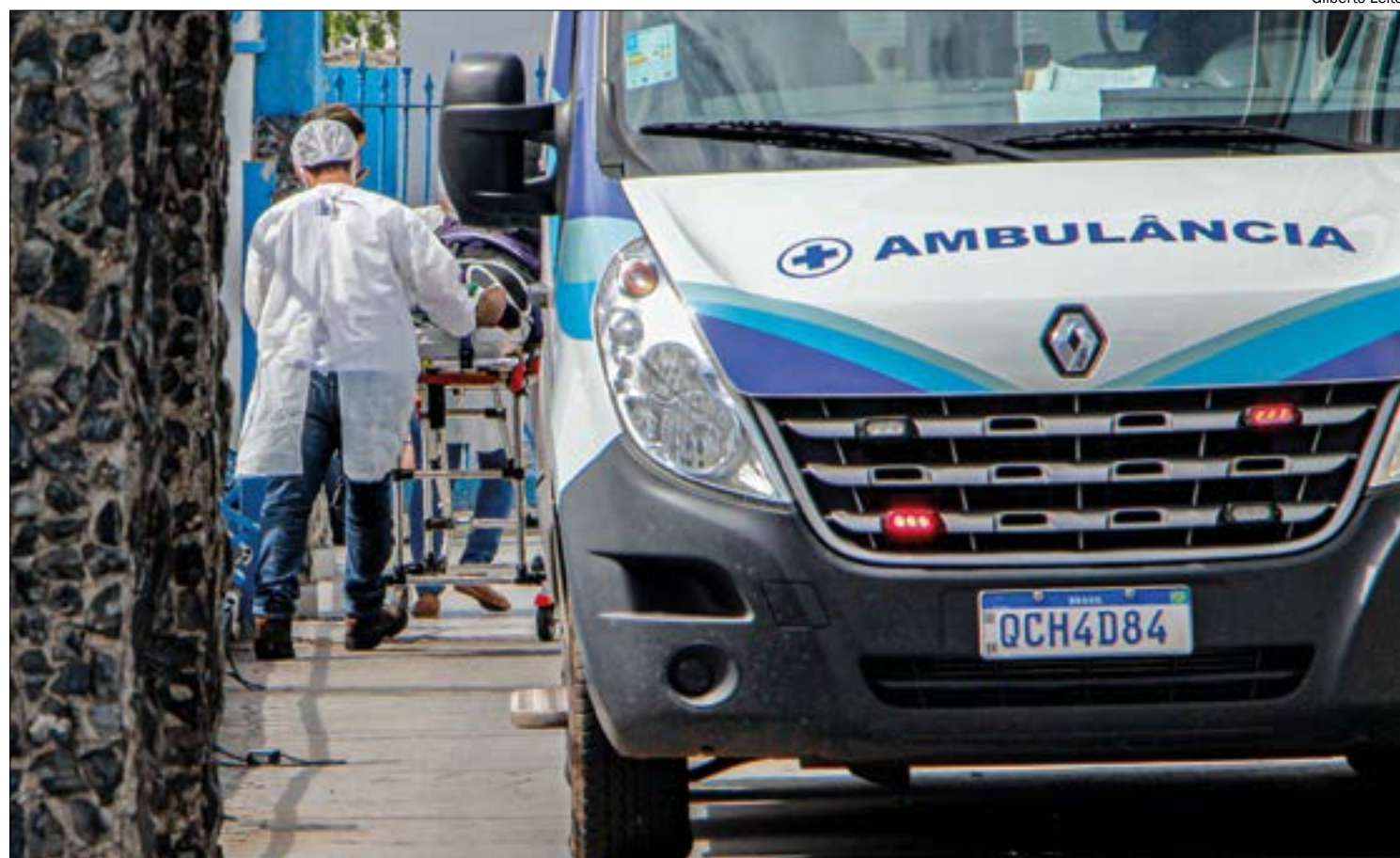
Apesar da queda nos números de novos casos, internações e óbitos, os cuidados para prevenir a doença devem ser mantidos

A Politec esteve no local e encaminhou o crânio e os restos mortais ao Instituto Médico Legal (IML) para exames de necropsia. A Polícia Civil investiga o caso.