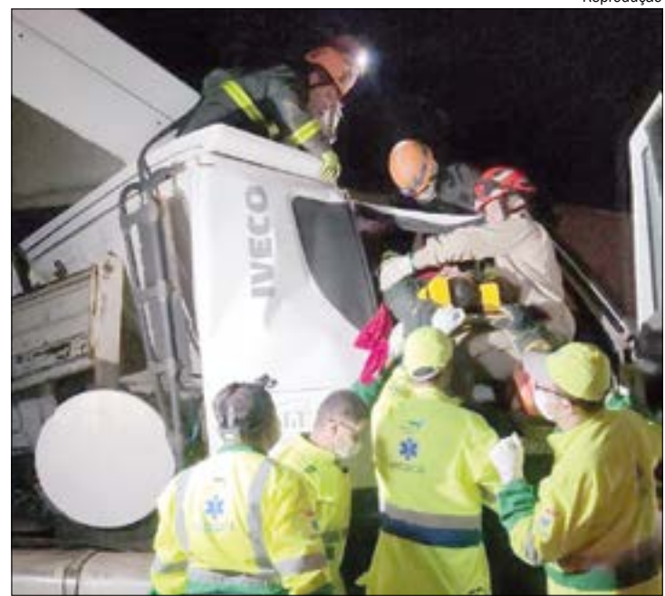
Com o forte impacto, parte da cabine ficou destruída e o motorista preso às ferragens

Já o motorista da outra carreta assinou o termo de recusa de atendimento.