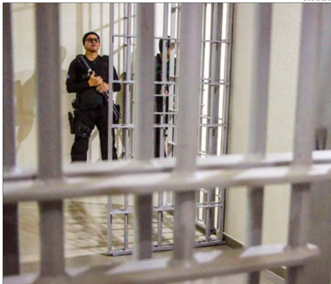
Além do preso, a família acaba sendo ‘arrastada’ para as prisões ao serem coagidas a, principalmente, traficar drogas

O sistema carcerário de Mato Grosso conta atualmente com 11.069 pessoas privadas de liberdade. A previsão é de que a partir de meados de setembro haja sobra de vagas disponíveis nas unidades prisionais do Estado.