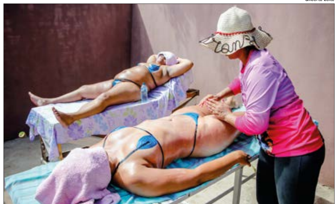
Setor de serviços criou mais de 20 mil vagas com carteira assinada no 1º semestre de 2022

Com relação ao estoque de emprego, houve um crescimento de 5,23% no período, com destaque para o segmento de construção, que teve incremento de 10,90% no setor no primeiro semestre deste ano.