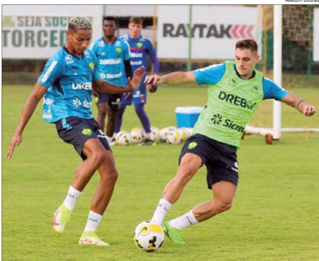
Apenas dois pontos separam o Cuiabá do Atlético-GO, o que aumenta a pressão por resultados neste domingo (21)

Para o restante da temporada, Denilson espera um bom rendimento da