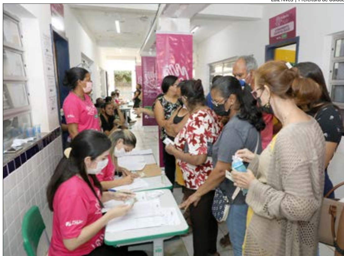
Mais de 50 serviços serão ofertados das 8h às 16h, no bairro Altos do Parque, em Cuiabá

Assunto: 6ª edição do Programa "Mulheres em Ação" Data: Sábado (20) Onde: EMEB Clóvis Hugueneq Neto - Avenida A, Altos do Parque 1 Horário: 8h às 16h