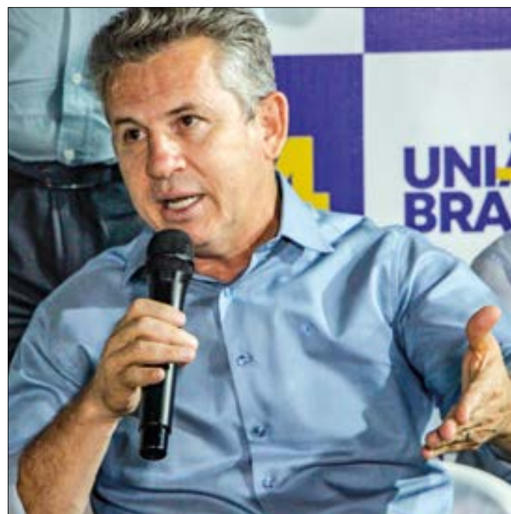
Na avaliação de Mauro, TCU cometeu "grande equívoco" ao suspender a troca do VLT pelo BRT

Na última terça-feira, 16 de agosto, o Pleno do Tri-