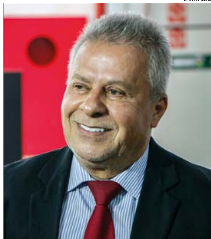
Chico diz ter bom trânsito entre os 24 vereadores e acredita que conseguirá emplacar chapa de consenso na Câmara

Além de presidente, o processo ainda define os novos primeiro vice-presidente, segundo vice-presidente, primeiro-secretário e segundo secretário.