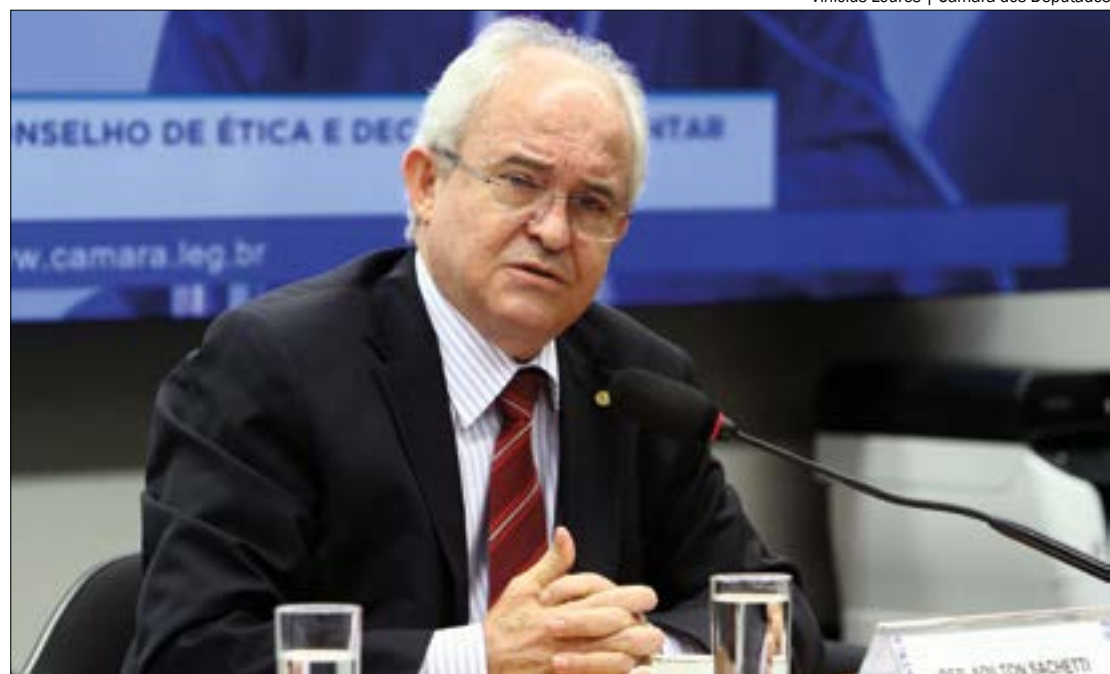
Sachetti diz que partido não pode intervir na briga entre os filiados e pede paciência aos dois