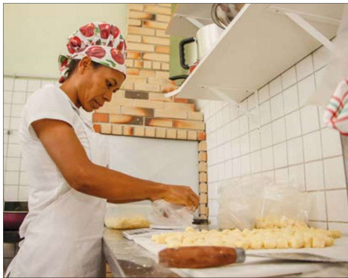
Crédito para MEIs deve ter juros limitado a 1,75% ao mês, segundo o BNDES