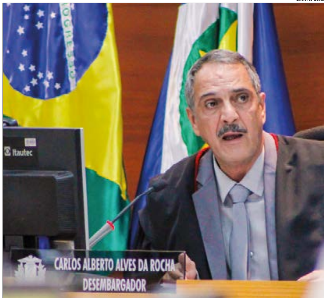
Presidente do TRE afirmou que tem aprimorado os sistemas para punir os candidatos que não cumprem as regras eleitorais

"A gente tem visto que todas as eleições nós falamos isso e há muito abuso ainda: 'porque a Justiça Eleitoral acaba não punindo a todos, acaba muitos não sofrendo qualquer punição ou qualquer penalidade', mas os senhores devem observar que a cada ano a justiça eleitoral tem se aparelhado mais, os sistemas nossos têm sido aprimorados, os nossos meios tem avançado muito, então eu acho que nessa eleição está na hora de acreditar mais no que nós podemos fazer", ressaltou.