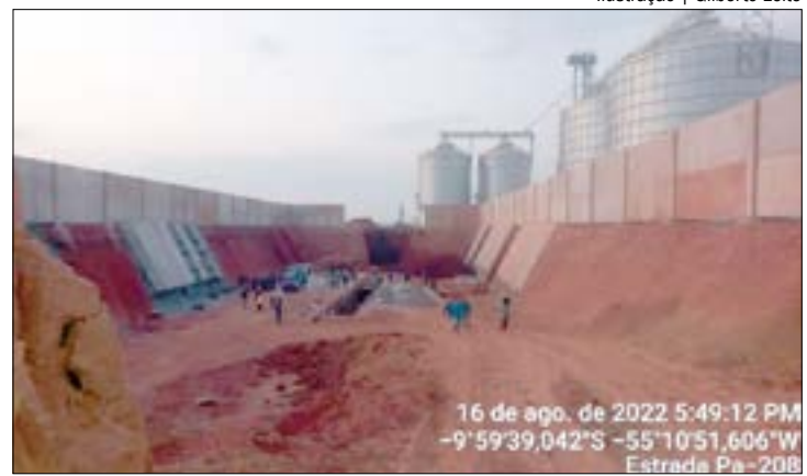
Os corpos foram encontrados em uma profundidade de cerca de 13 metros abaixo do nível do solo