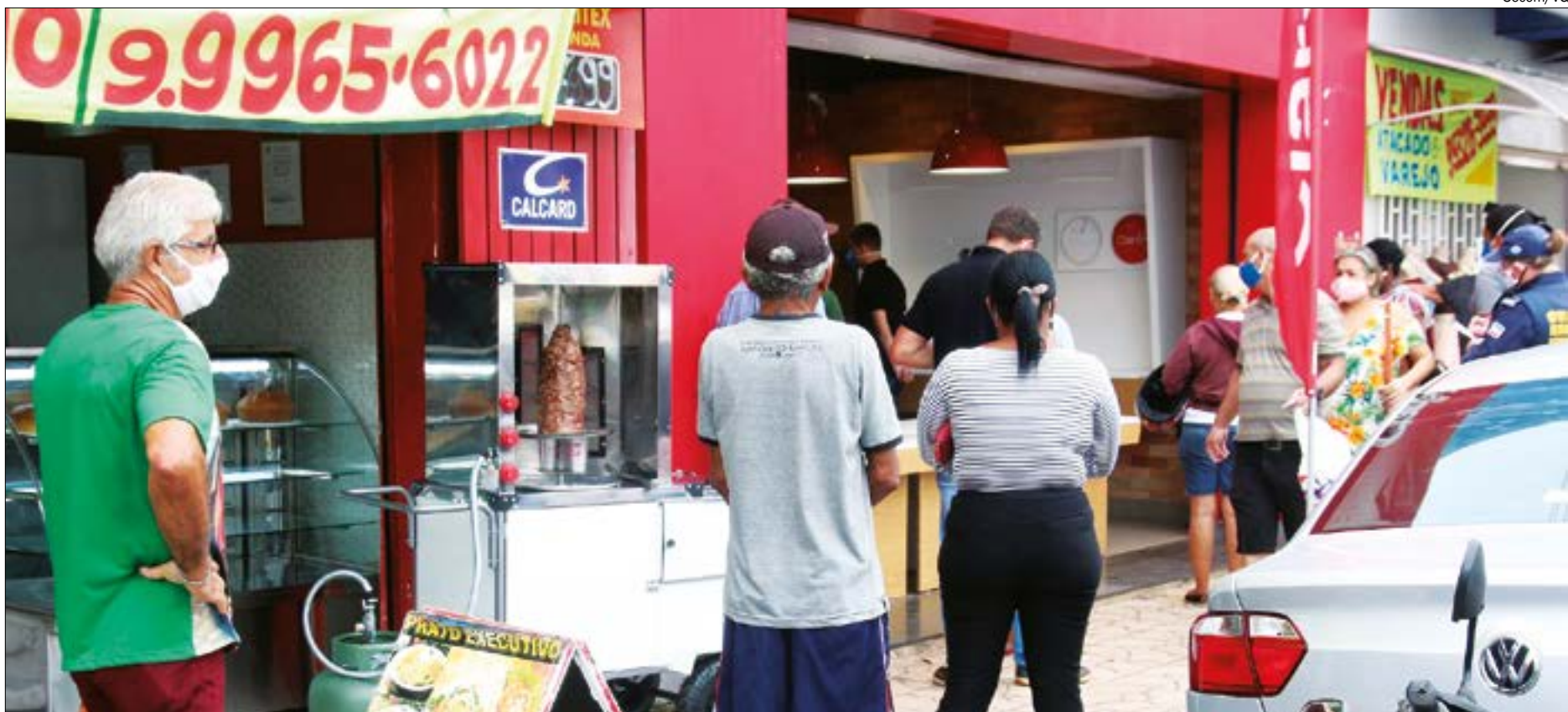
Várzea Grande registrou mais um óbito por Covid-19 nesta quarta-feira (13) e prefeitura impõe regras mais rígidas

De acordo com as novas normas, os estabelecimentos comerciais, varejistas e atacadistas cuja atividade econômica seja do gênero alimentício estão com o horário de funcionamento limitado das 6h às 21h.