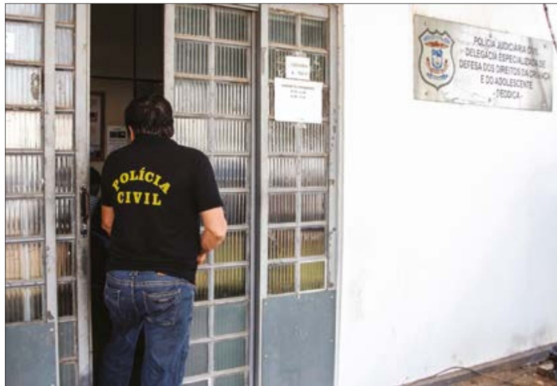
A mãe da garota denunciou o companheiro por estupro a filha de 12 anos. O homem tentou fugir, mas foi preso