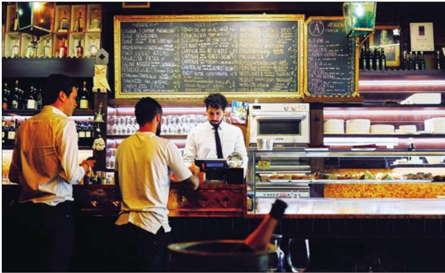
Em Mato Grosso, os reflexos no setor de bares e restaurantes já prejudicam quase 10% dos trabalhadores

Apesar de a Medida Provisória compensar as perdas salariais dos tra-