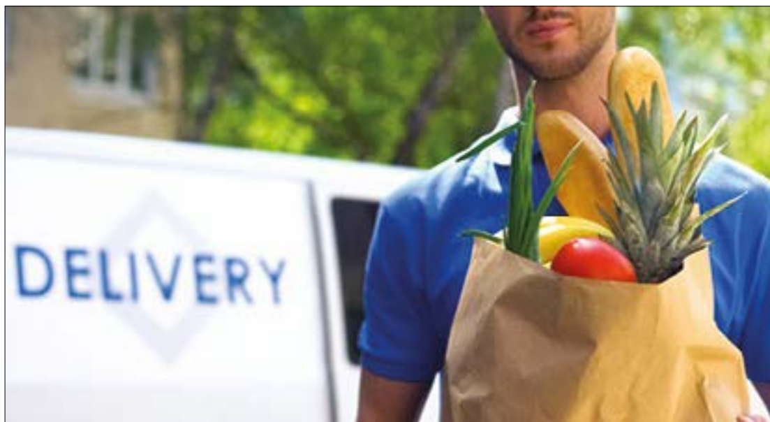
Empresas entregam desde remédios até hortifrúti na porta da sua casa

Entrega de compras a partir de R$ 50, podendo ter taxa de entrega de R$ 10. Pedidos podem ser feitos das 10h às 16h, de segunda a sexta-feira.