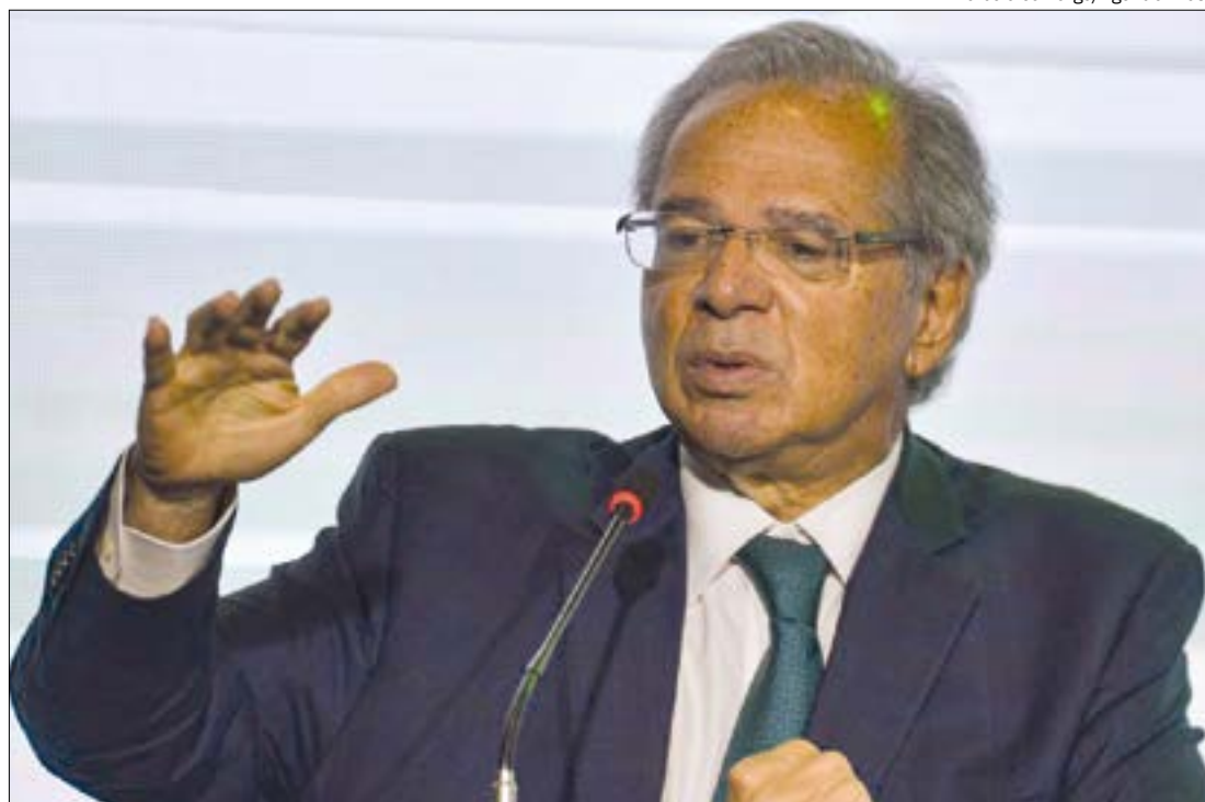
Na avaliação de Guedes, o Brasil está entrando num longo ciclo de investimentos

RENEGOCIAÇÃO - Sem dar detalhes, Guedes disse que a equipe econômica pretende ampliar os programas de transação tributária (renegociação de dívidas com o governo). Segundo ele, o comércio, os serviços e o setor de eventos devem ter as mesmas possibilidades para regularizar os débitos que outros segmentos afetados pela pandemia de covid-19 tiveram nos últimos anos. Guedes disse que o modelo de transação tributária já foi desenhado pelo Ministério da Economia.