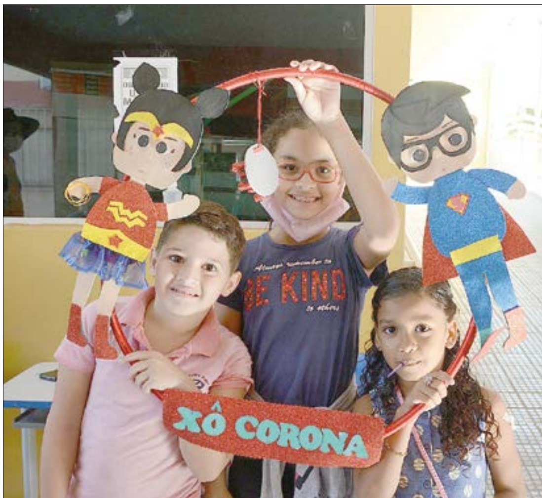
Cadastro de crianças tem objetivo de acelerar a vacinação, já que o município ainda aguarda remessa de doses da Coronavac

Entre as crianças de 5 a 11 anos, 40% já foram va-