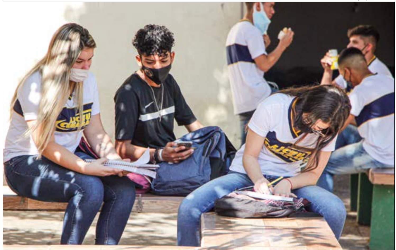
Aumento de conflitos, indisciplina e brigas estão mais recorrentes após o retorno às salas de aula

A suspeita é que uma pane elétrica tenha provocado o incêndio, mas a versão só será confirmada após perícias. Não houve feridos.