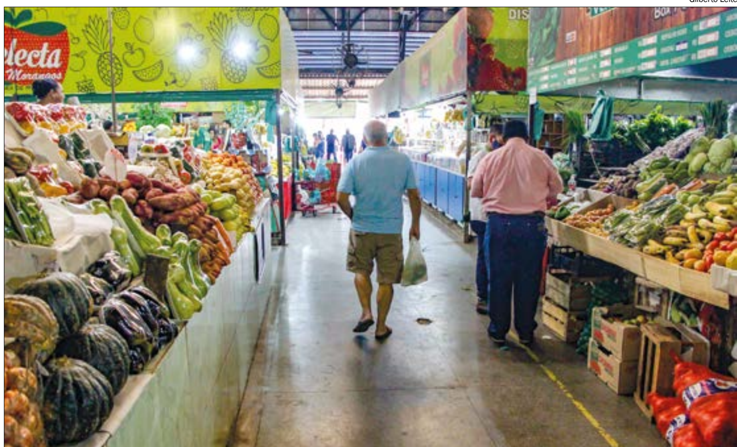
Fazer a feira ficou mais caro na última semana, com aumento de cerca de 20% no preço do tomate

"O leite registra variação semanal de -2,94%, após ter sofrido um aumento considerável no primeiro semestre de 2022. Essa redução em seu valor pode estar associada ao aumento dos produtos nos mercados e a necessidade de estabilidade de preços, devido à queda no consumo", afirma