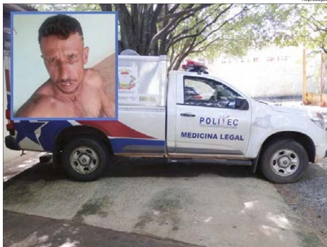
O adolescente confessou que matou o pai com 11 facadas após ter sido ameaçado por ele. Em uma emboscada o genitor foi morto e enterrado pelo filho