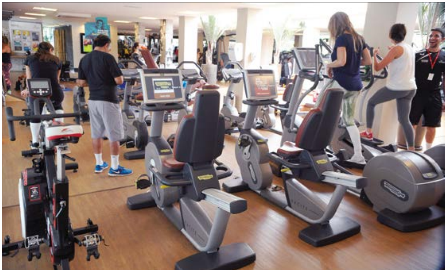
Academias foram classificadas como ‘serviço essencial’ pelo presidente, mas governadores não querem reabrir

Já Figueiredo afirma que essencial é aquilo que garante a preservação da vida das pessoas e se não for essencial à preservação da vida, não deve ser flexibilizado. Conforme o secretário, os serviços essenciais são as farmácias, alimentação, atuação de