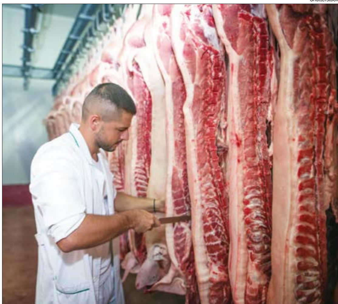
Funcionário de frigorífico verifica carcaças destinadas à exportação

"A destinação para a China seguiu em crescimento, a alta foi de 8,21% no período, totalizando 21,02 mil toneladas, assim como para o Egito, em 20,79%, com volume de 1,54 mil toneladas. Desta forma, as habilitações de plantas em Mato Grosso para esses mercados têm trazido resultados rapidamente, assim como em breve pode-se ver escoamento para o mercado americano", aponta o Imea.