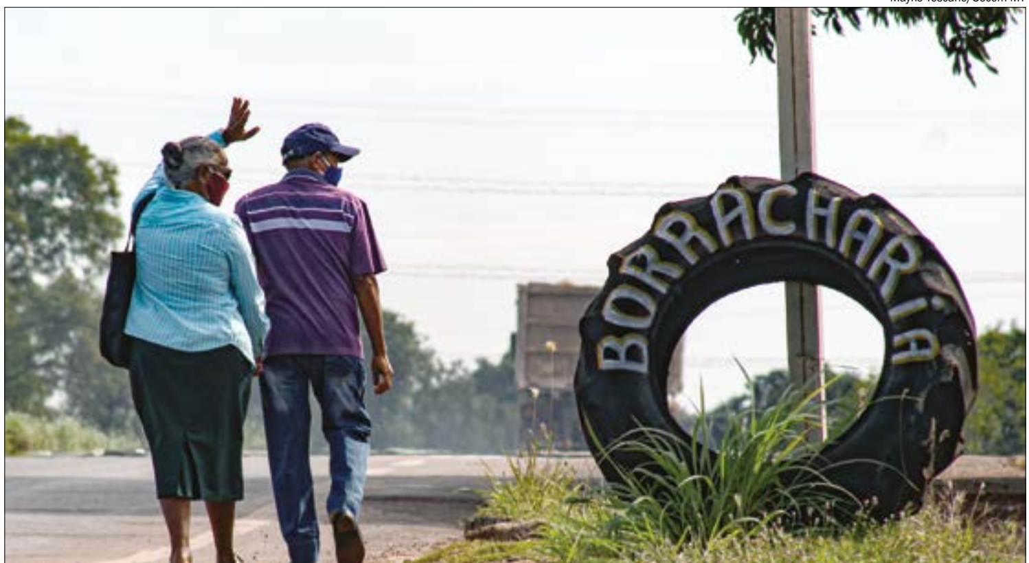
Secretário afirma que lockdown será necessário caso 80% dos leitos de UTI fiquem ocupados e defende medidas mais rígidas adotadas por municípios