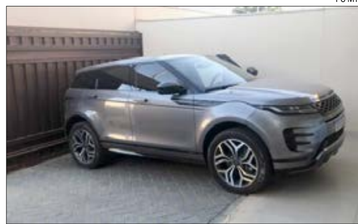
Os policiais perceberam a tentativa de furto quando o alarme do veículo começou a disparar