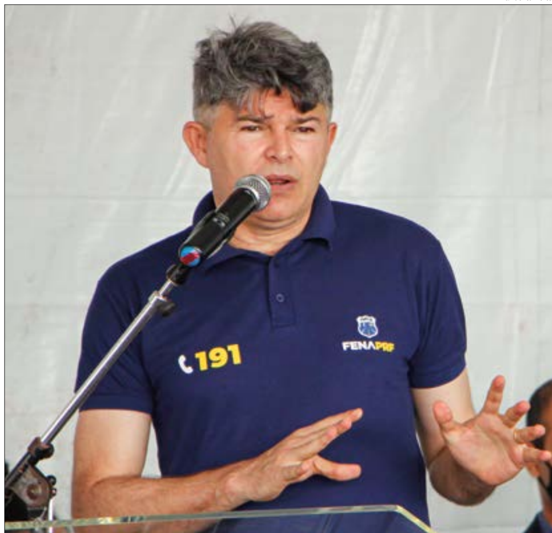
Segundo Medeiros, proposta de palanque aberta não foi bem vista pelo presidente Jair Bolsonaro

Segundo ele, a única possibilidade de mais de um candidato ao Senado no palanque de Mendes seria se os demais candidatos e seus partidos não fizessem coligação nas chapas ao Senado.