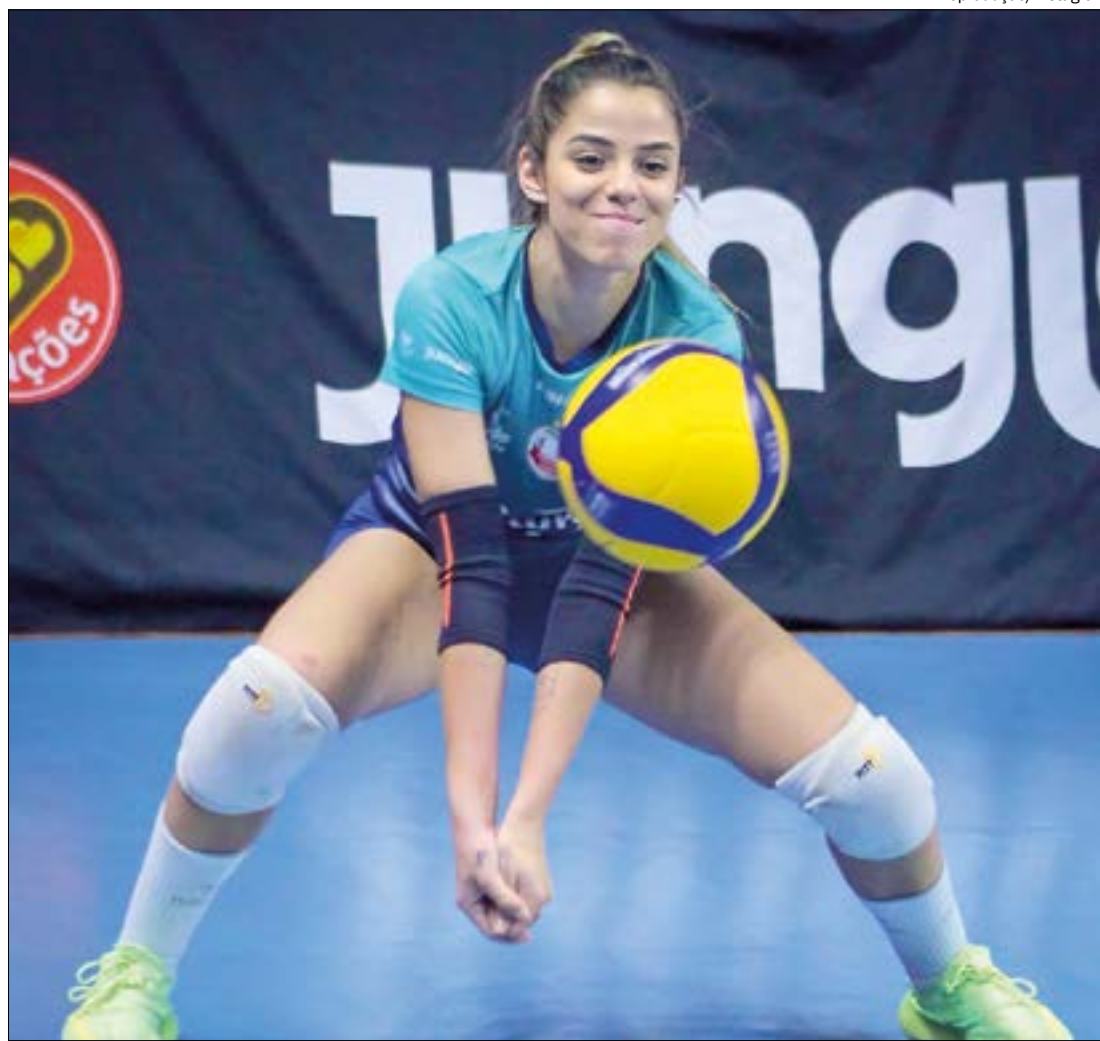
Key Alves sonha em ser atleta desde a infância e hoje é a jogadora de vôlei com mais seguidores nas redes sociais

“Quando começaram a falar que eu era a jogadora de vôlei mais seguida do mundo, pensei que precisava aproveitar o barulho e ganhar dinheiro em cima disso. Por coincidência, um empresário me mandou uma mensagem me dizendo que ele cuidava da plataforma e que eu tinha que fazer um perfil. Eu já postava fotos sensuais no Instagram e podia lucrar com elas. Eu topei. Só dis-