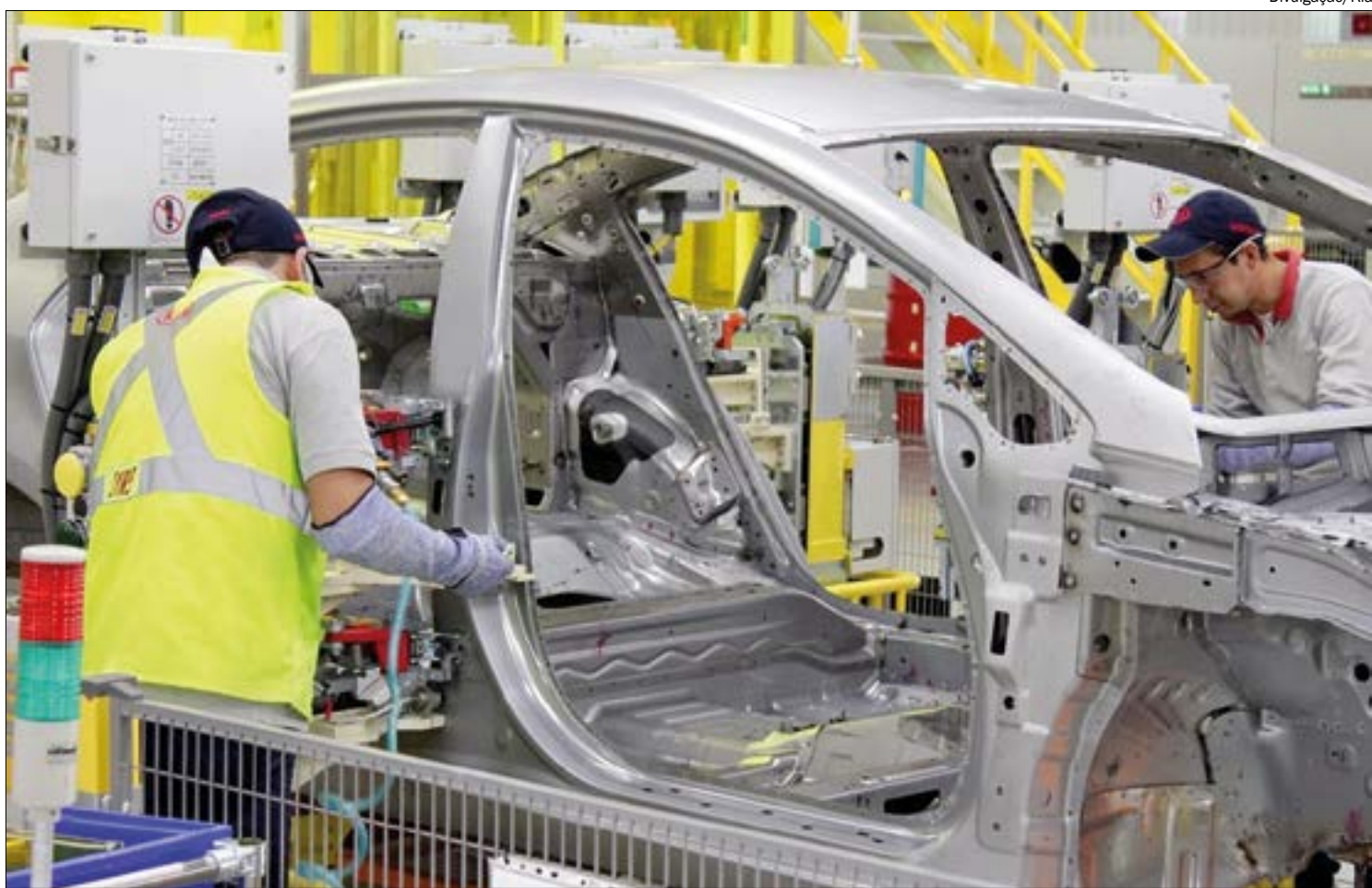
Normalização das linhas de produção é um dos fatores apontados para redução dos preços dos seminovos

A normalização das linhas de produção das montadoras permitiu que os carros novos voltassem ao mercado e, diante dos preços caros dos usados, os consumidores estão preferindo os novos