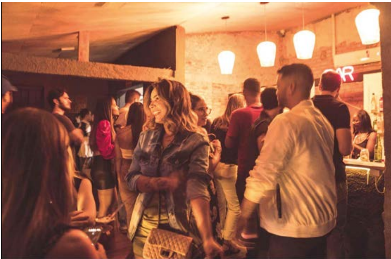
Gente bonita e descolada na noite de inauguração do Bar/Club Frvin