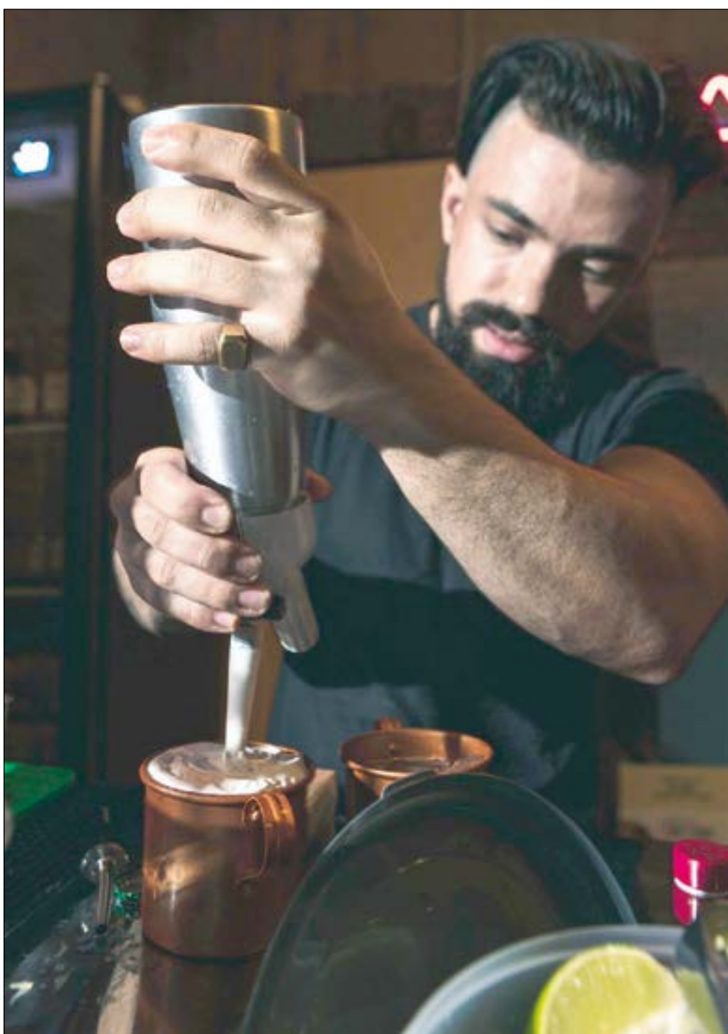
Bebidas honestas e bons drinks você encontra no Bar/Club Frvin