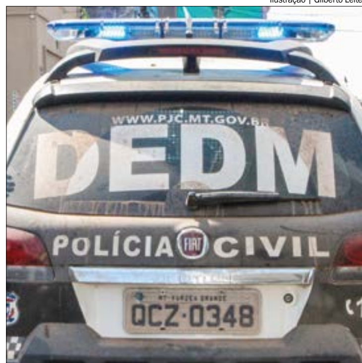
Ilustração | Gilberto Leite