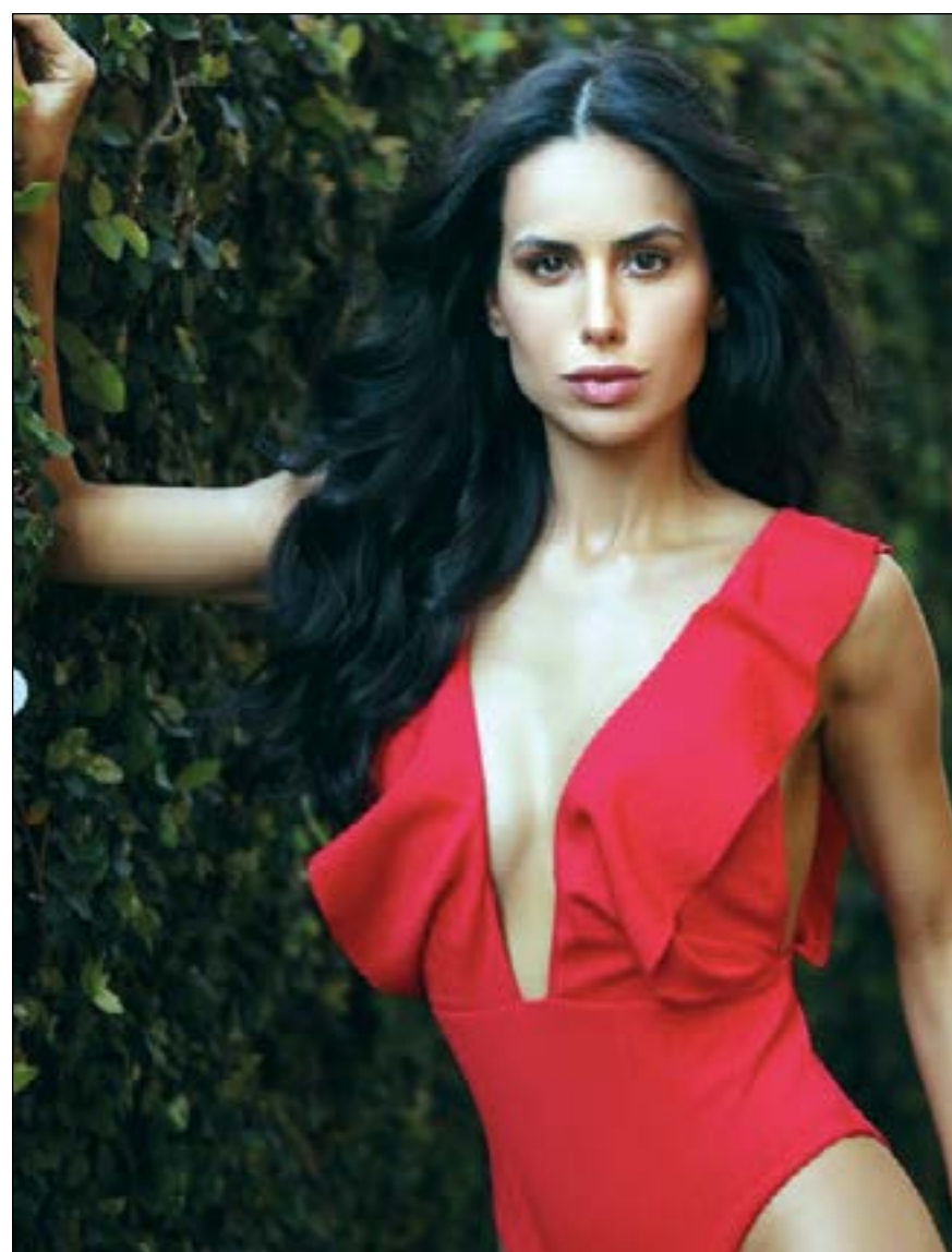
A belíssima Miss Universo Brasil, Mia Mamede que acaba de ser eleita e merece o destaque da coluna Estilo