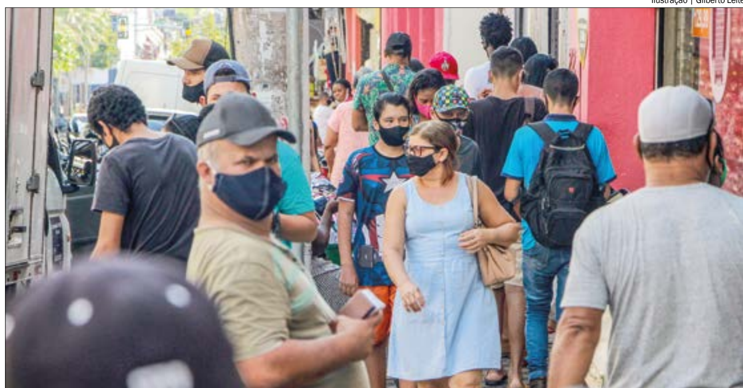
Ilustração | Gilberto Leite

No Brasil, os crimes de racismo cresceram 31%, enquanto que os de injúria racial tiveram queda de 4,4%.