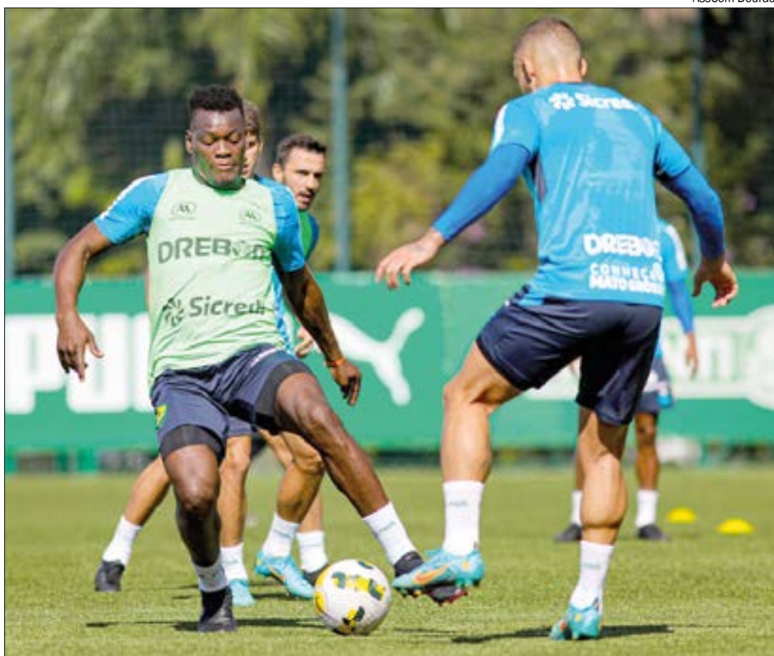
Cuiabá fez primeiro treino ainda no CT do Verdão, antes de voltar para casa, onde receberá o Galo

*Estagiário sob supervisão do editor Gabriel Soares