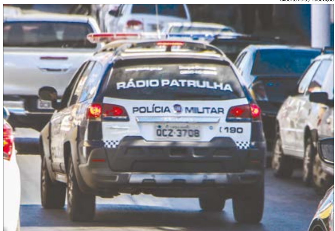
Gilberto Leite/ Ilustração