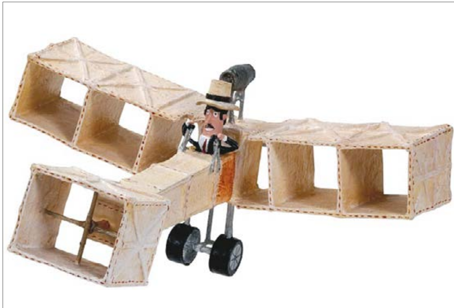
O Santos Dumont e seu avião são feitos com papel e retrós de linha, uma atividade lúdica que a criançada adora

Para isso, precisaremos de um retrós de linha vazia, uma tampinha de pasta de dente, dois arames de fechar embalagem de pão e papelão. E também precisaremos aprender a fazer papieta-