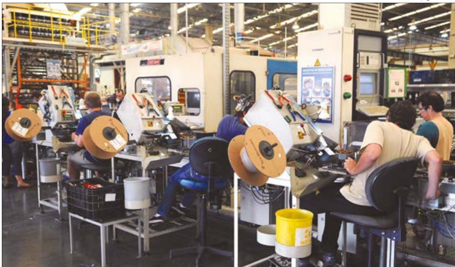
Centrais sindicais defendem que corte de salários e jornadas se torne medida permanente para preservação de empregos

A Força Sindical e a União Geral dos Trabalhadores (UGT), que representam juntas um quarto dos trabalhadores sindicalizados, segundo os últimos dados oficiais, têm defendido uma política permanente de manutenção de empregos para episódios de crise. A ideia deve ser levada à área econômica nesta semana. A reportagem procurou a Central Única dos Trabalhadores (CUT), a maior central do País, para saber sua posição