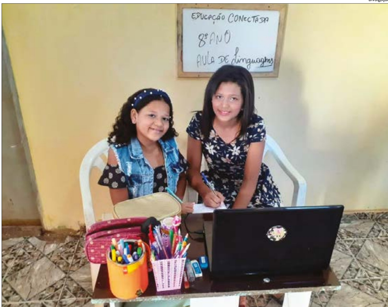
Alunos da rede estadual já estão estudando em casa pela plataforma digital Aprendizagem Conectada, disponibilizada pela Seduc