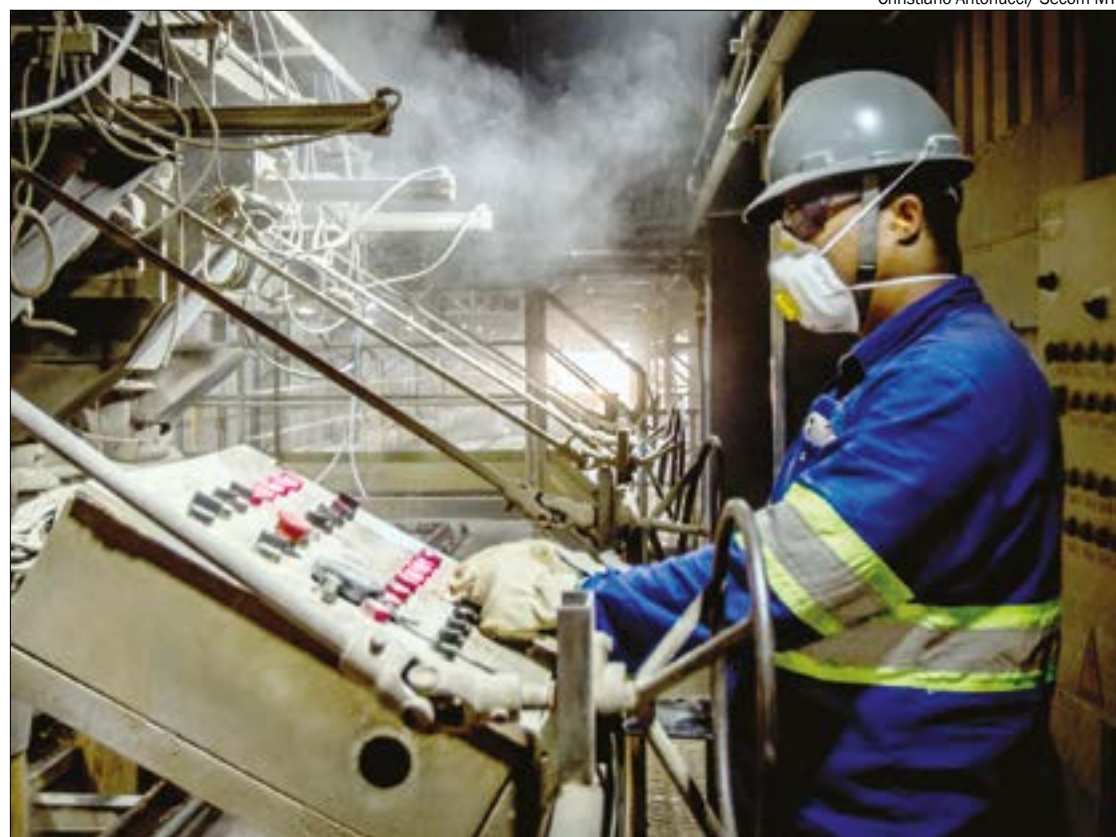
Trabalhador opera terminal da Ferronorte em Rondonópolis; expansão da ferrovia pode gerar até 5 mil empregos