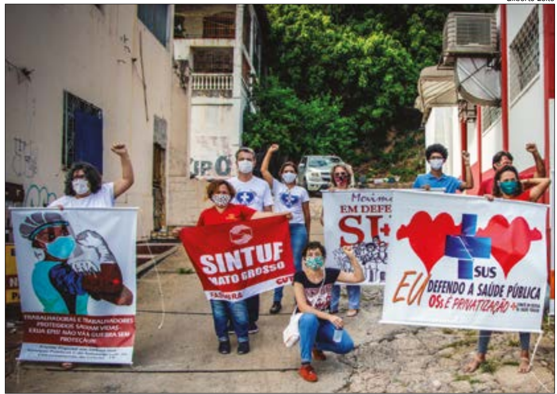
Em ato realizado na capital nesta terça-feira (12), profissionais da saúde homenagearam os colegas de profissão mortos pela Covid-19

“Esta homenagem simbólica está sendo realizada para lembrarmos dos