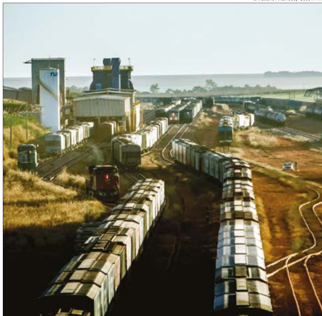
Mudanças feitas pela ANTT sem aval do TCU põem em risco a expansão da Ferronorte em Mato Grosso

Os documentos do processo de renovação estão em análise pelo relator do processo no TCU, o ministro Augusto Nardes. Ele poderá dar parecer favorável às justificativas para as mudanças feitas pelo governo, o que permitirá a assinatura da renovação, ou solicitar mudanças no projeto. Porém, a decisão final cabe ao plenário do TCU, composto por nove ministros.