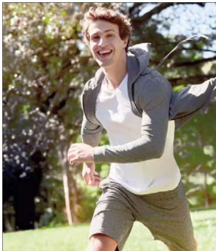
Mais um look exclusivo da Casa das Cuecas, que fica localizada no shopping Estação Cuiabá