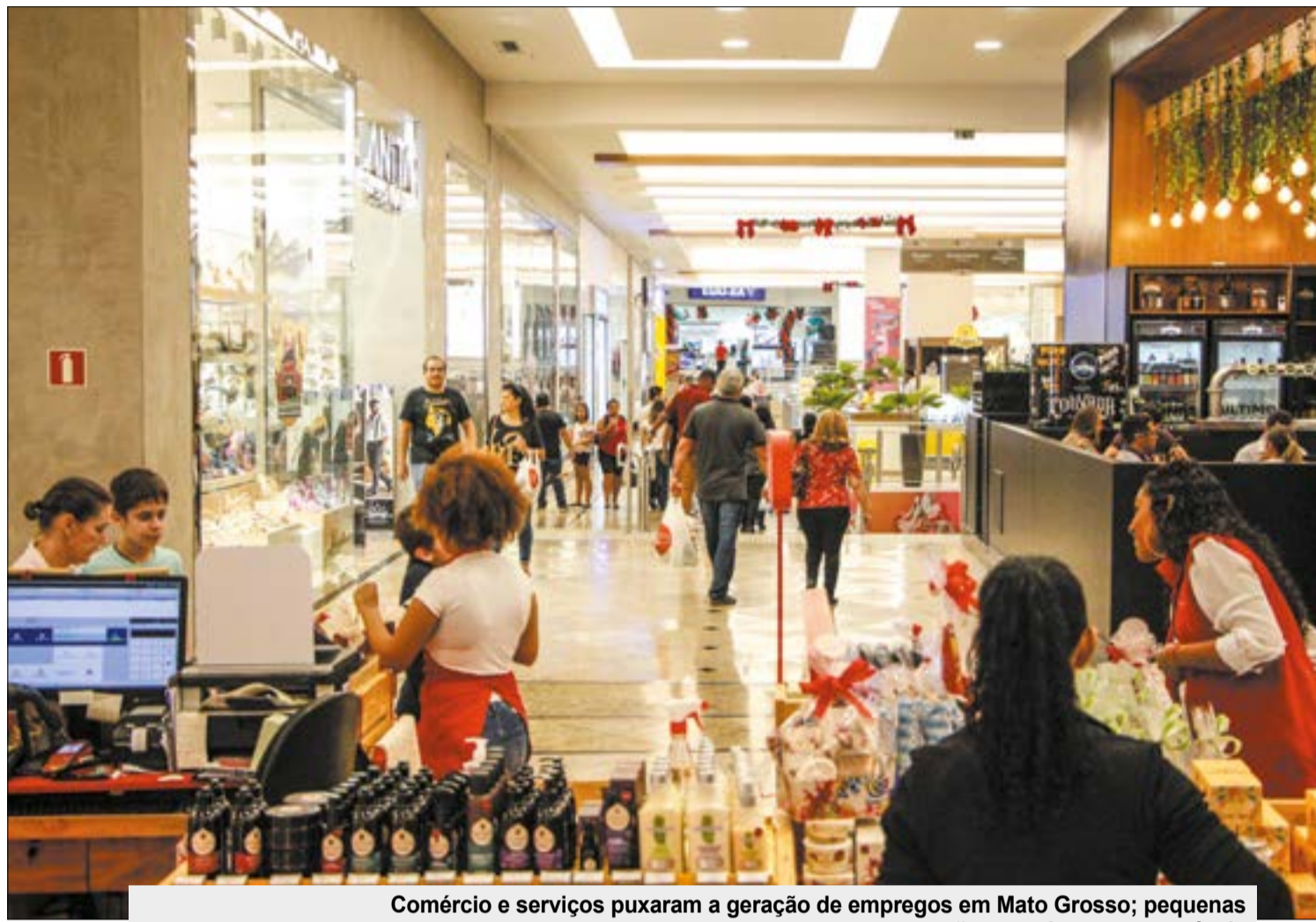
Comércio e serviços puxaram a geração de empregos em Mato Grosso; pequenas empresas são as maiores responsáveis

Também apresentaram aumento no número de vagas a agropecuária, com 4.660 novas vagas, construção civil, que gerou 2.253 novos empre-