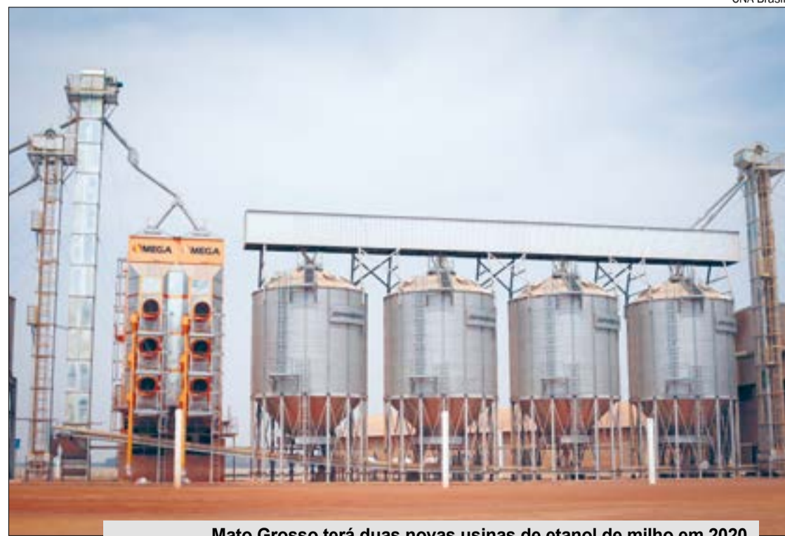
Mato Grosso terá duas novas usinas de etanol de milho em 2020

“Ainda hoje, os meses de entressafra da cana conferem uma volatilidade maior. Mas é esperado que com a consolidação do mercado do etanol de milho essa realidade mude”, pondera Nolasco.