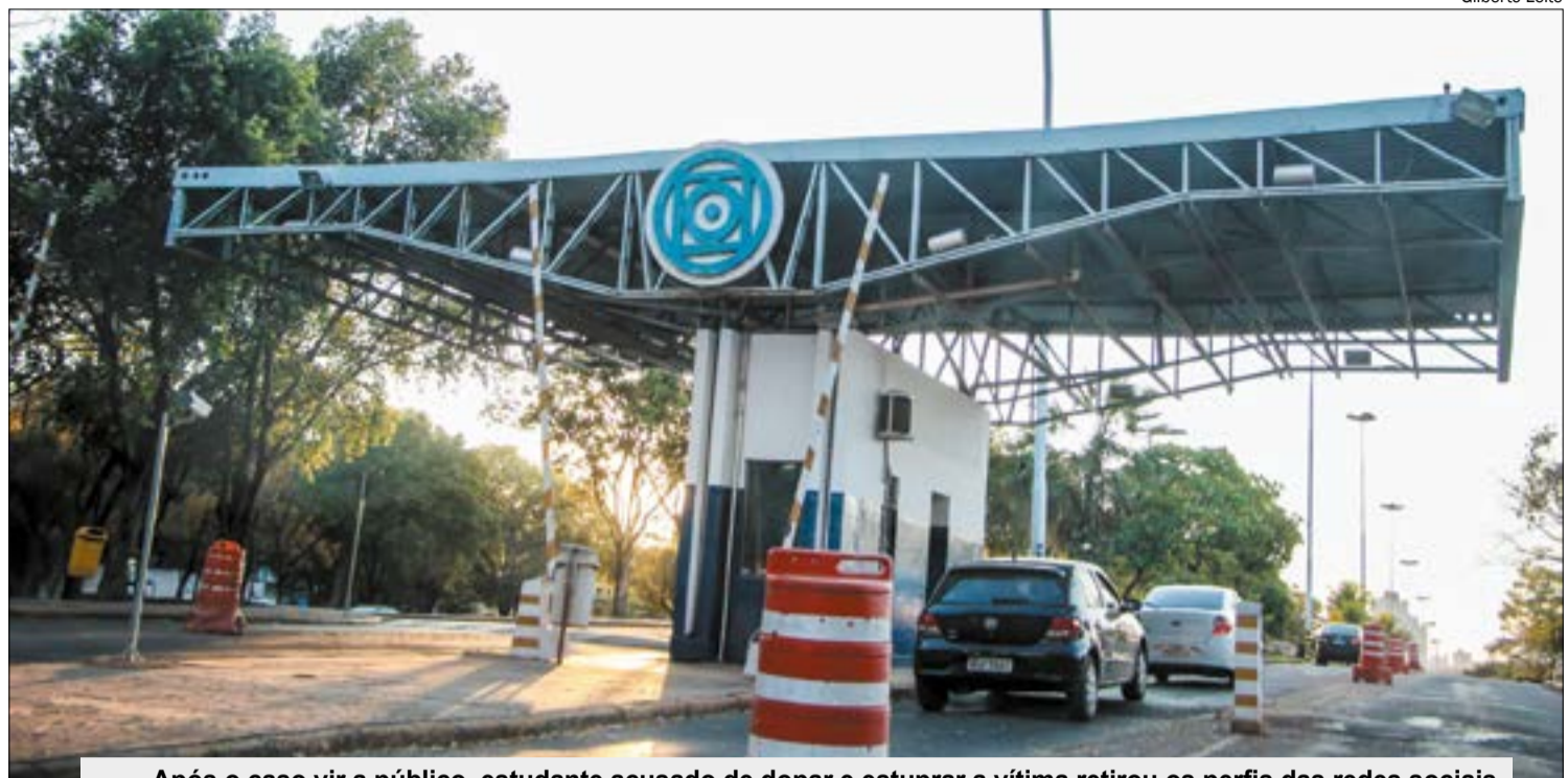
Após o caso vir a público, estudante acusado de dopar e estuprar a vítima retirou os perfis das redes sociais

lhes que eu prefiro não falar e resumindo foi isso. Fui violentada quando estava psicologicamente vulnerável", disse ela no chocante relato, que tem ganhado apoio de amigos e desconhecidos após o estupro sofrido.