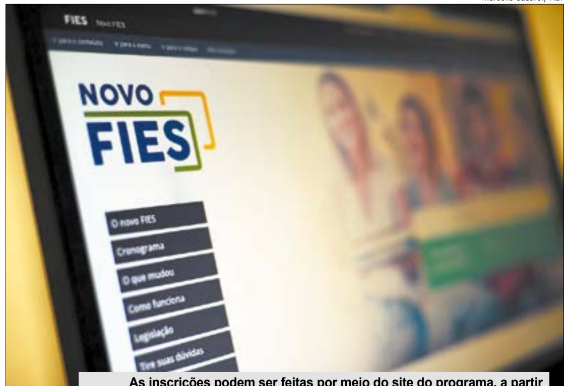
As inscrições podem ser feitas por meio do site do programa, a partir de um cadastro vinculado ao CPF