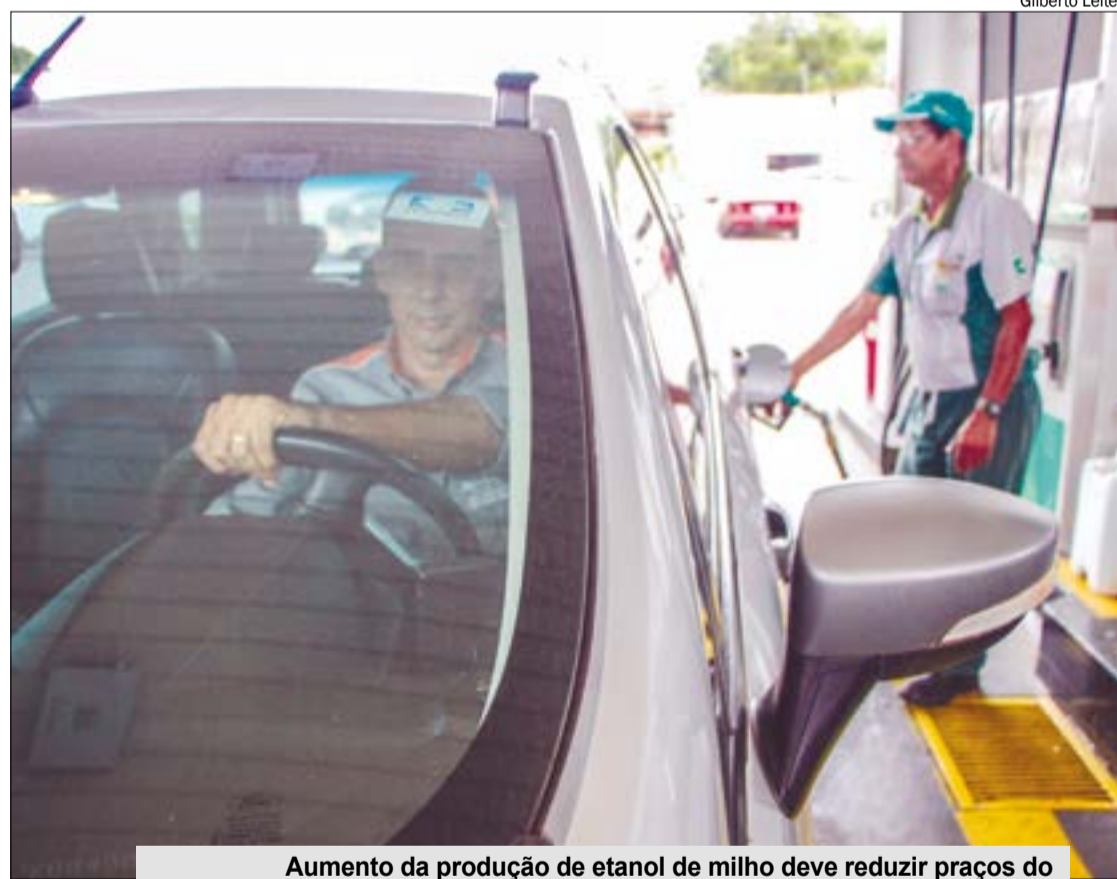
Aumento da produção de etanol de milho deve reduzir preços do combustível na entressafra da cana

Com tanta matéria-prima disponível, a expectativa é que a produção de etanol de milho praticamente dobre neste ano, alcançando 1,4 bilhão de litros ante os 660 milhões litros do ano passado. Para toda essa produção serão consumidos 3,3 milhões de toneladas de milho, mais que o dobro do ano anterior (1,5 milhão t).