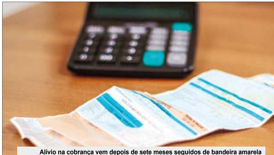
Alívio na cobrança vem depois de sete meses seguidos de bandeira amarela ou vermelha na conta de energia

Em casos de possíveis abusos na cobrança, basta procurar a unidade do Procon mais próxima ou registrar sua reclamação no www.consumidor.gov.br .