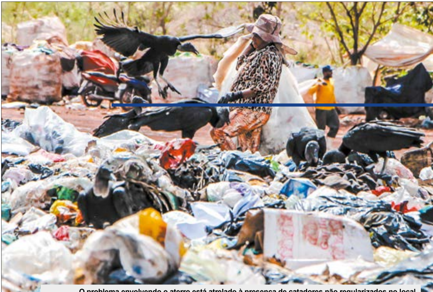
O problema envolvendo o aterro está atrelado à presença de catadores não regularizados no local

A classe criou uma terceira proposta, que será