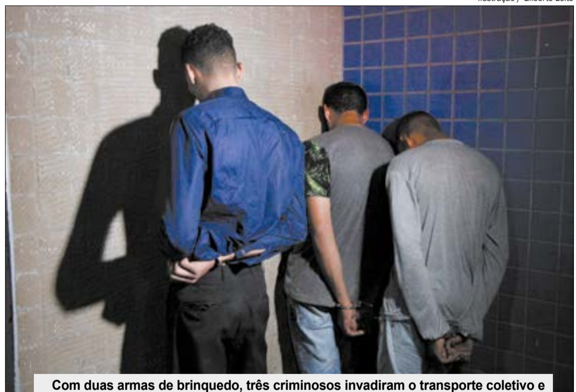
Com duas armas de brinquedo, três criminosos invadiram o transporte coletivo e fizeram um 'rapa' nos passageiros