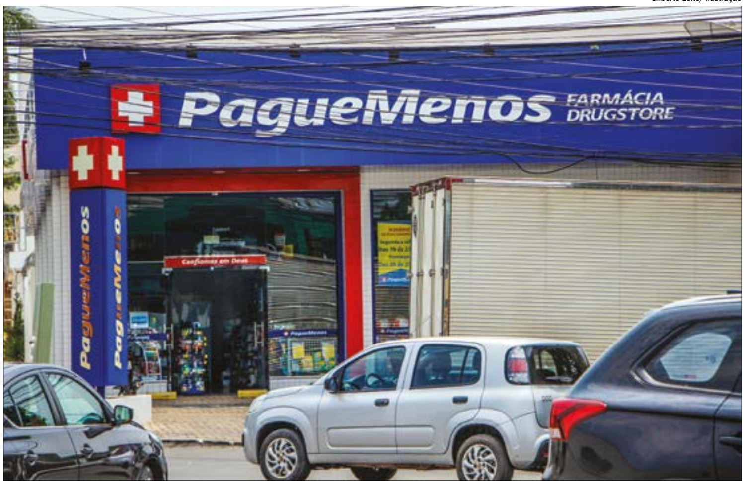
Anvisa aprovou em caráter temporário e excepcional a utilização de “testes rápidos” para a Covid-19 em farmácias

Na normativa consta apenas que os estabelecimentos que desejarem