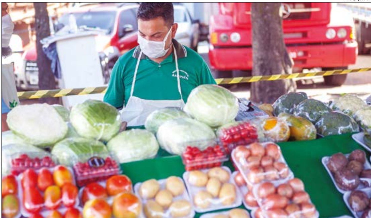
Tomate e batata foram os principais vilões da cesta básica em abril