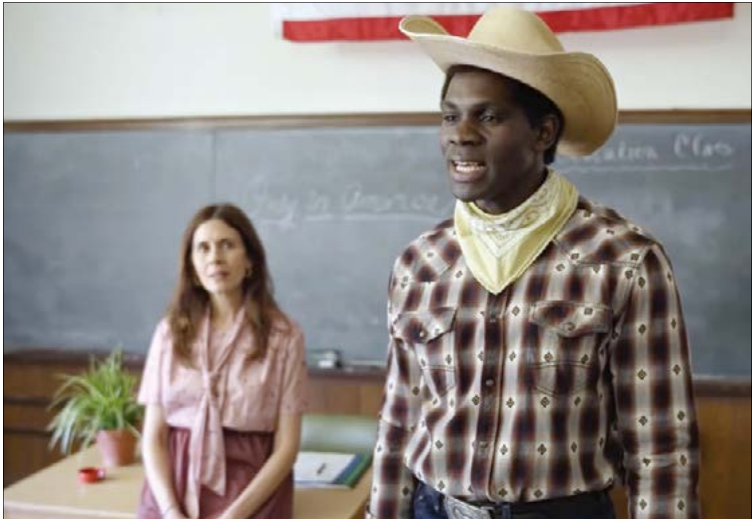
Little America retrata, com sensibilidade, histórias reais de imigrantes americanos