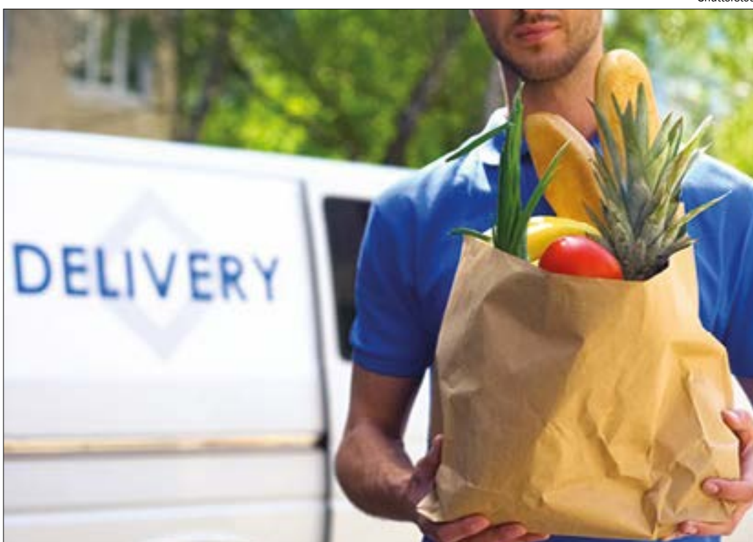
Empresas entregam desde remédios até hortifrúti na porta da sua casa

A loja física permanecerá aberta entre as 7h30 e 17h30. Entrega é grátis para