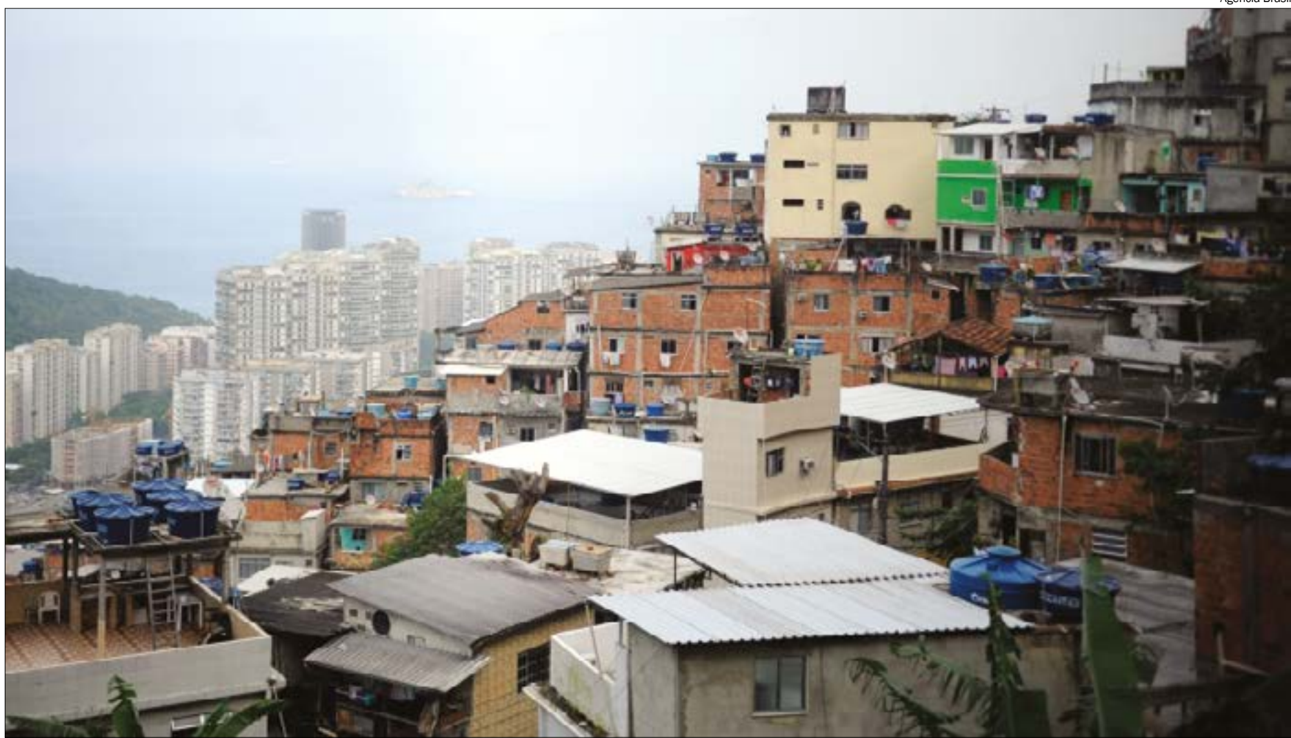
Apesar de grande parte viver em casa própria, metade da população tem menos de meio salário para pagar as contas

Além das casas, são cerca de 10 milhões de apartamentos no país, o equivalente a 14,2%. Já as casas de cômodos, cortiços ou cabeças de porco são 126 mil, o equivalente a 0,2%. Entram nessa classificação, por exemplo, moradias onde as pessoas utilizam o mesmo ambiente para diversas funções como dormir, cozinhar e trabalhar.