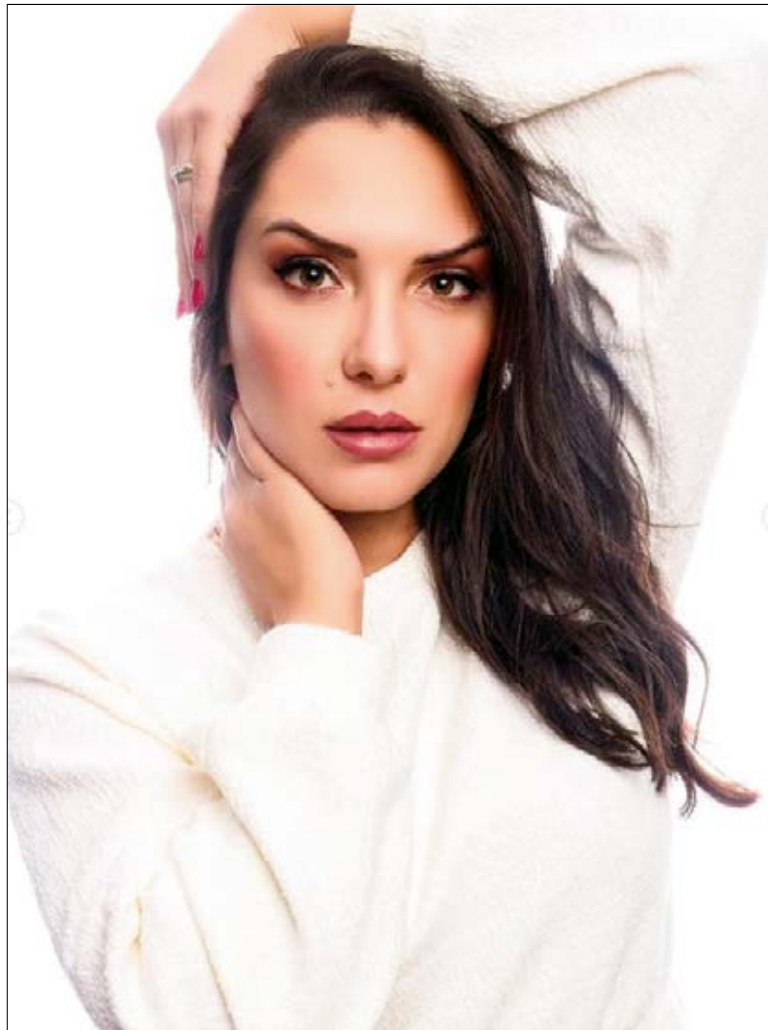
A atuante deputada estadual Janaina Riva, que movimentou as redes sociais com este lindo ensaio fotográfico. Sou fã e amei!!!

E vai uma inédita aí para os meus leitores. O renomado chef Waldemar Untar é quem vai assinar o buffet da Feijoada de Inverno 2022. Competente como ele e sua equipe são, com certeza darão um show de sabores e beleza para as ilhas gastronômicas do evento.