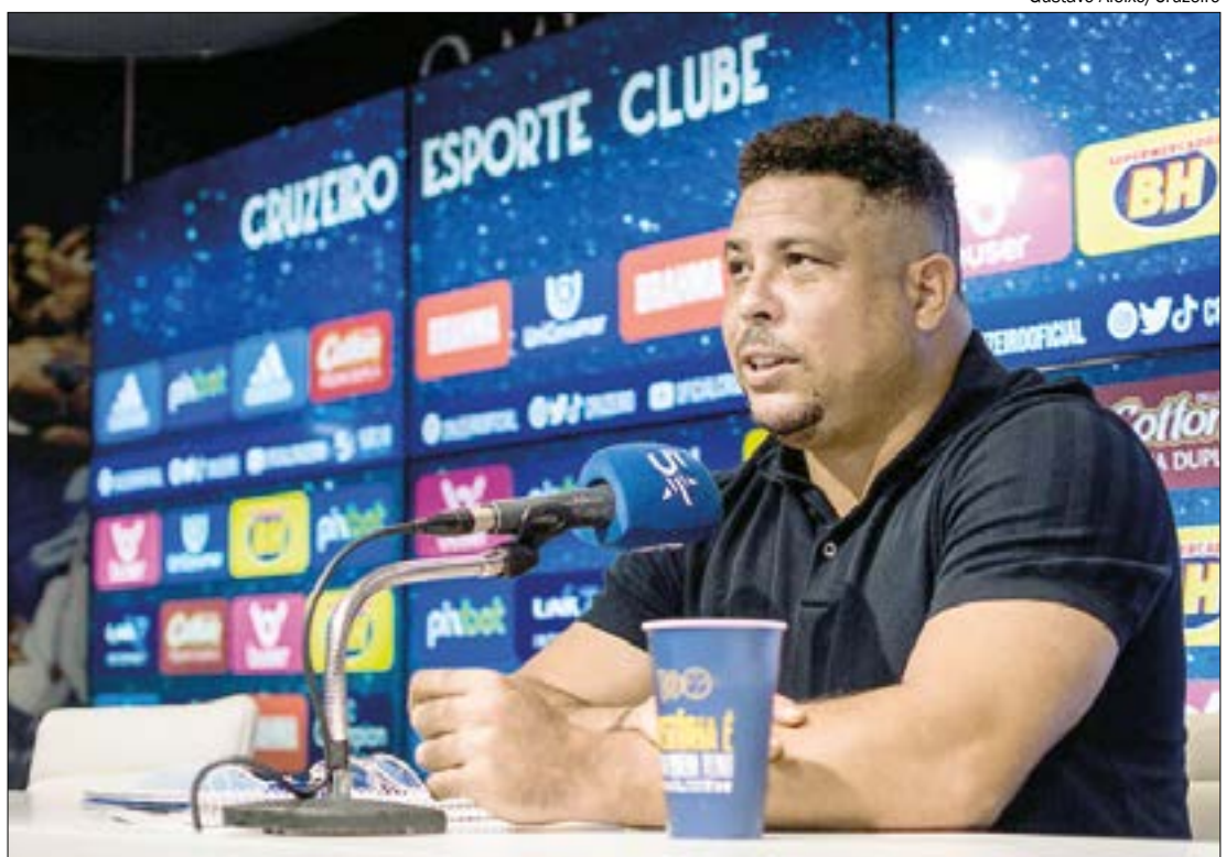
Em cinco meses de gestão Ronaldo, Cruzeiro 'organiza a casa' e já lidera a Série B do Brasileiro

A austeridade da gestão Ronaldo forçou a revisão da contratação do técnico Vanderlei Luxemburgo, que foi alvo de críticas à época. Também levou à revisão de contratações já anunciadas e a liberação de outros atletas que 'não compensavam', como o ídolo cruzeirense Fábio.