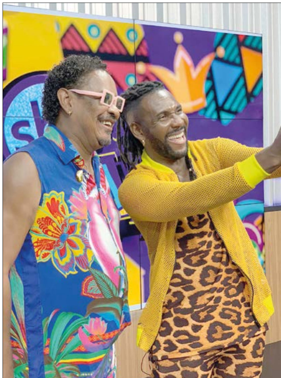
A dupla Compadre Washington e Beto Jamaica, que promete muito Tututu pá... o famoso bordão do É o Tchan do Brasil, que vai arrepiar todo mudo dia 08 de julho, no Mirante das Águas. Corra e adquira seu ingresso antecipado pelo fone: 99612-1439

E aí? Já se programou para a festa mais colorida da temporada? A alegria com certeza já está no ar e promete contagiar a todos no Baile do Hawaii com É o Tchan do Brasil, que vai acontecer dia 08 de julho, no Mirante das Águas. Uma superestrutura já está sendo montada para a festa e o mais importante... as coreografias têm que estar na ponta do pé, hein! Vamos ensaiar...