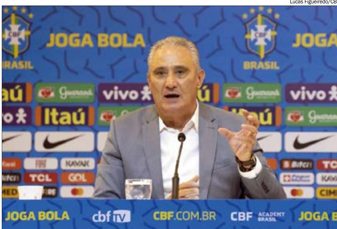
Tite comenta expectativas com a 'geração da perninha rápida', ao explicar convocação de Danilo, do Palmeiras

Além de Danilo, Tite promoveu o retorno de Gabriel Jesus, que faz grande final de temporada no Manchester City. O objetivo desta 'mescla' de atletas novos e mais experientes é consolidar o trabalho já realizado até agora e trazer sangue novo para evolução do time.