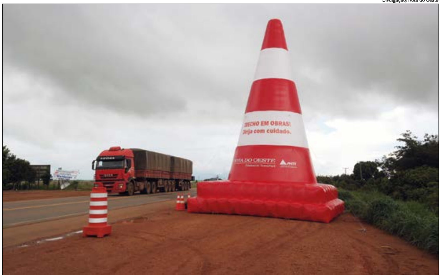
Processo para devolução pode andar rápido, mas nova licitação da BR-163 deve levar cerca de dois anos até ser concluída

A Ordem dos Advogados do Brasil - Mato Grosso entrou no debate em meados de 2020, quando foi formada a Comissão Especial da Rodovia BR-163, com advogados-presidentes das