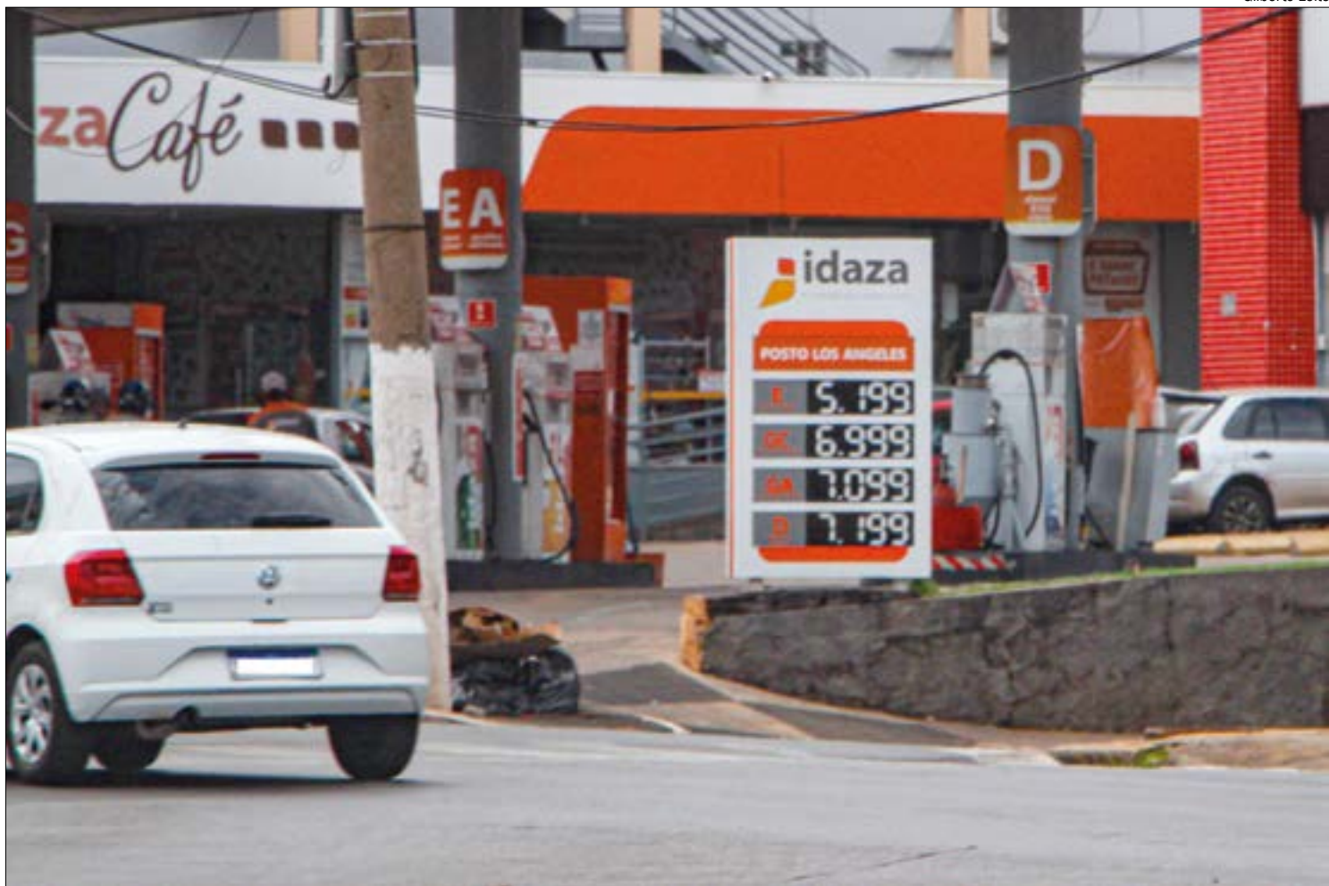
Projeto de lei que poderia usar lucro da Petrobras para reduzir preços dos combustíveis está parado no Congresso Nacional