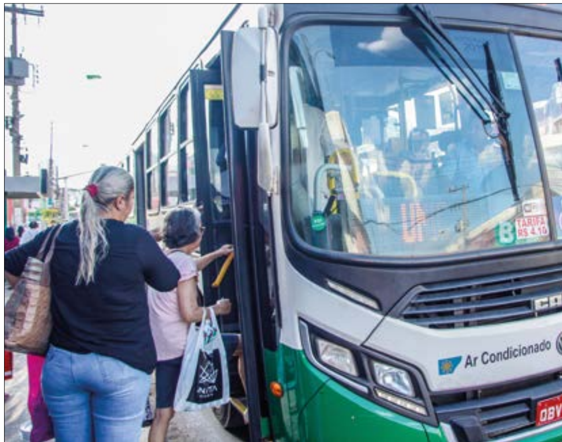
Esse valor, mais que o dobro da tarifa antiga, seria o necessário para cobrir as despesas declaradas pelas empresas

*Estagiário sob supervisão do editor Gabriel Soares