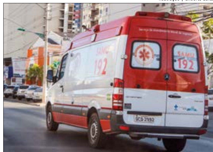
A vítima brincava no quintal de casa quando foi atingida. O alvo passava pelo local e levou quatro tiros