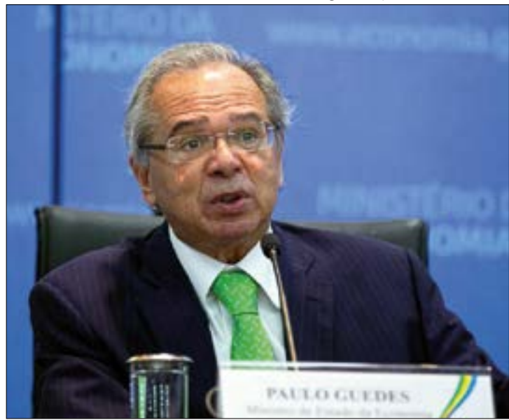
Proposta de taxação dos mais ricos deve ser incluída na reforma tributária do governo