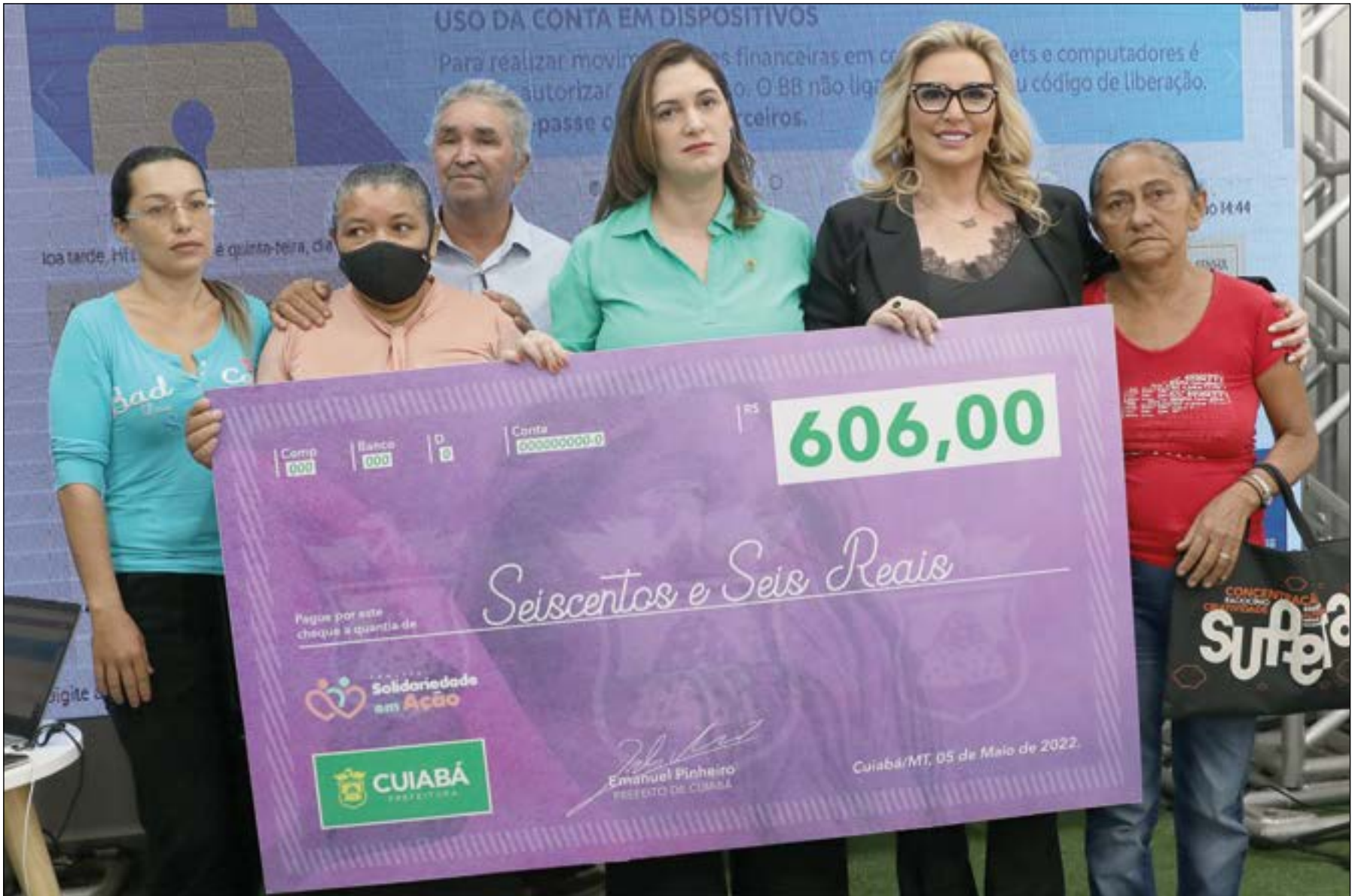
Vicente Aquino | Prefeitura de Cuiabá