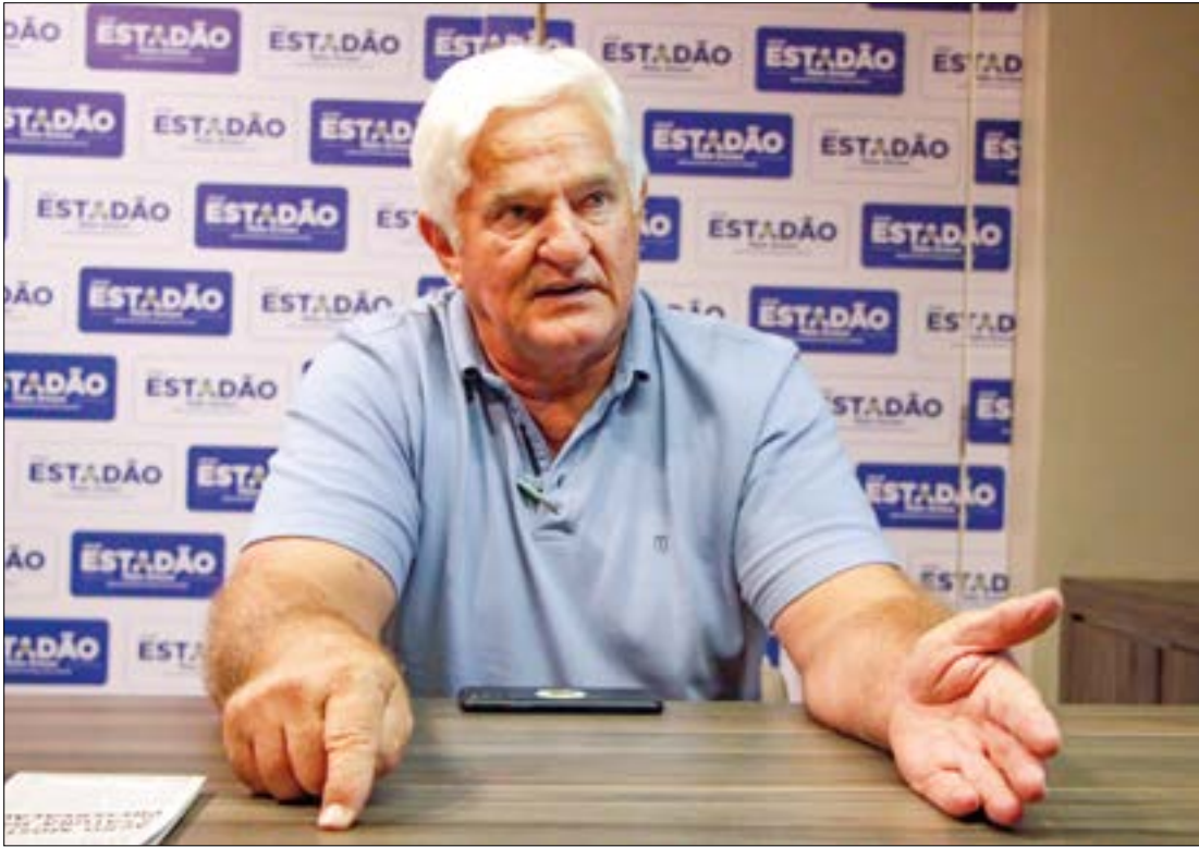
Galvan aponta que agricultores norte-americanos têm até 40 vezes mais recursos disponibilizados pelo governo

brigando há muito tempo. Todo ano sabe que tem safra, chega o período de plantar, aí vira essa novela.