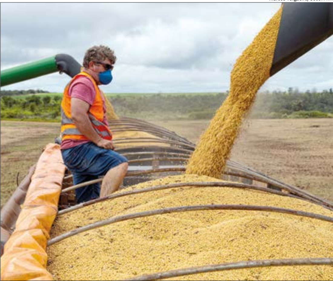
Prolongamento da crise na Ucrânia e outros problemas globais ameaçam a segurança alimentar do planeta