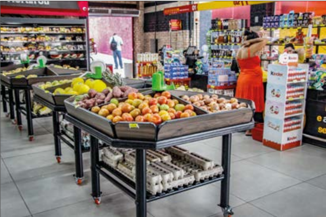
Alguns produtos da cesta básica apresentaram redução nos estoques, devido à alta procura, o que eleva os preços