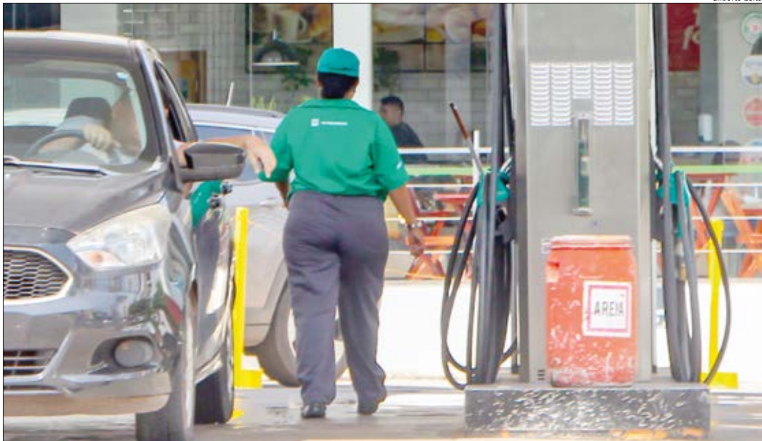
Preços já começaram a recuar nas usinas na última semana e movimento deve se acelerar ao longo do mês

"O objetivo da indústria é fornecer o produto mais barato possível. Se não lançar o mais barato possível, é porque não tem uma oferta suficiente. Isso gera uma