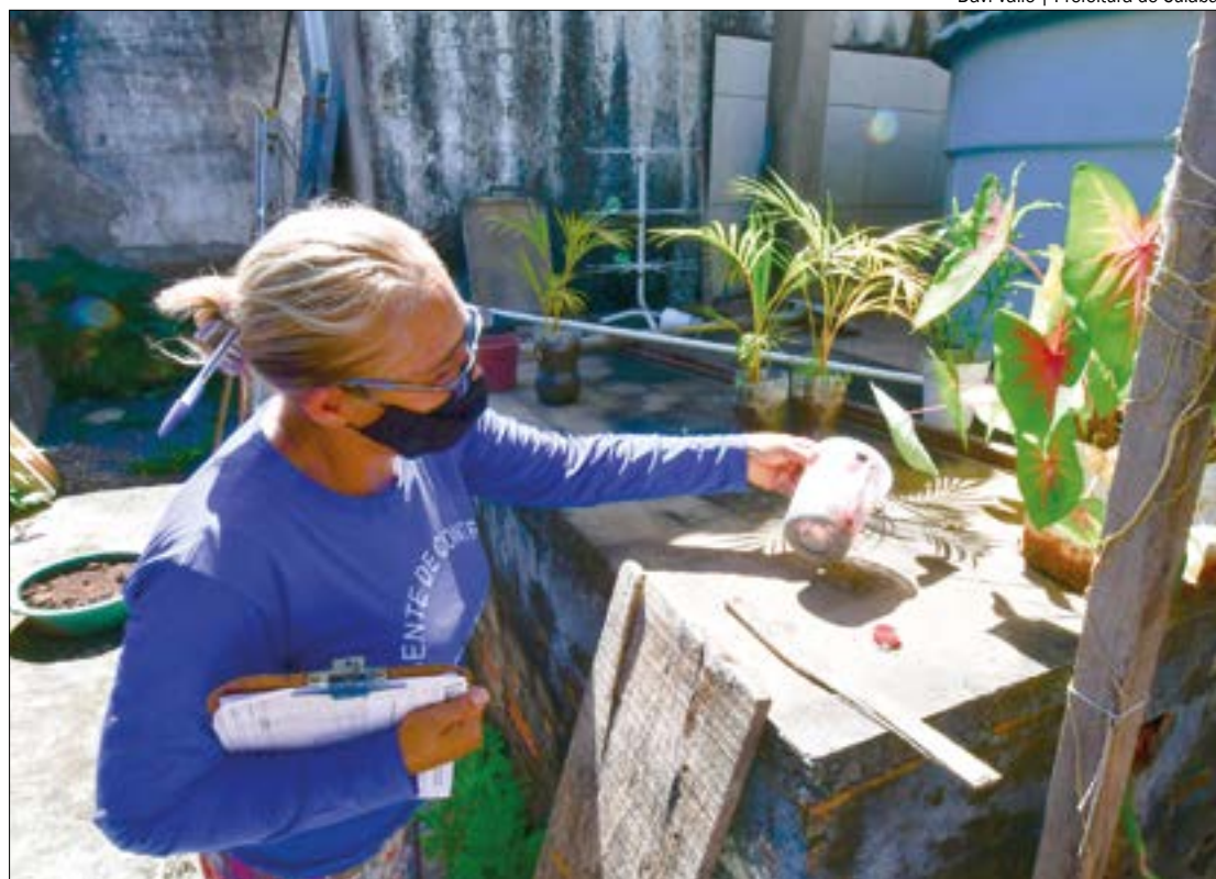
É importante manter quintais limpos, retirar recipientes abertos de locais descobertos e verificar caixas d'água

Conforme o Centro de Informações Estratégicas de Vigilância em Saúde (Cievs), até o dia 9 de abril, 95.358 casas residenciais foram visitadas pelos agentes de saúde. Destes, 10.134 receberam o tratamento qualificado para