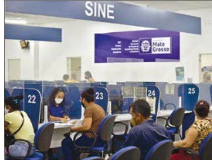
Sinop, a capital do Nortão, é a cidade com maior número de vagas: são 257 oportunidades

Em Sorriso (a 199 km de Cuiabá) são 215 postos de trabalho divulgados nesta semana. Entre as oportunidades estão, 24 vagas para auxiliar administrativo, 4 vagas para electricista de instalações industriais, 20 vagas para motorista car-