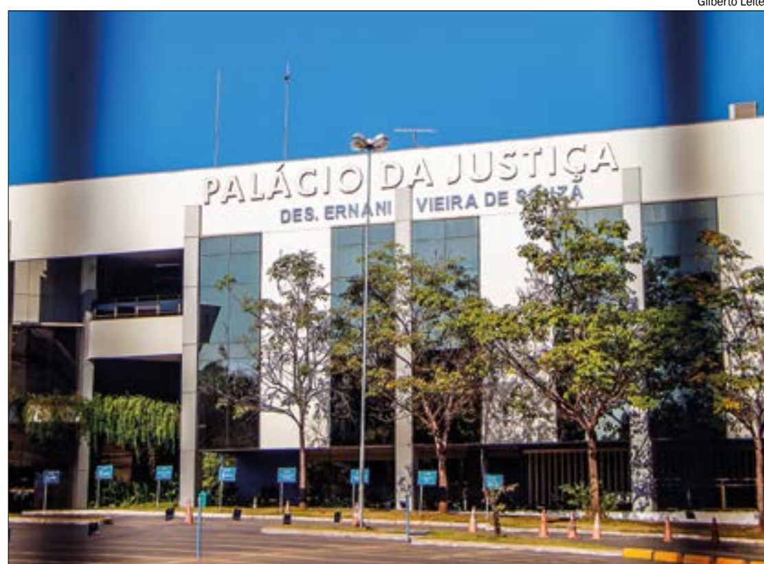
TJ concluiu que não há ilegalidade ou vício no decreto que criou o parque

O procurador de Justiça enfatizou que o simples fato da área estar situada em faixa de fronteira não confere a ela o caráter de área devoluta, "tampouco autoriza a sua inserção no rol de bens pertencentes à União". Acrescentou ainda que a alegação do apelante careceu de prova, "tendo em vista que não trouxe aos autos elementos que se prestassem a comprovar que as áreas englobadas pelo Parque Estadual Serra Ricardo Franco, de fato, integram faixa de fronteira em sua totalidade".