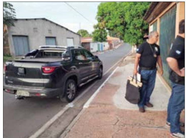
Segundo a Polícia Civil, alvos da operação receberam salários e prêmio saúde como se fossem médicos