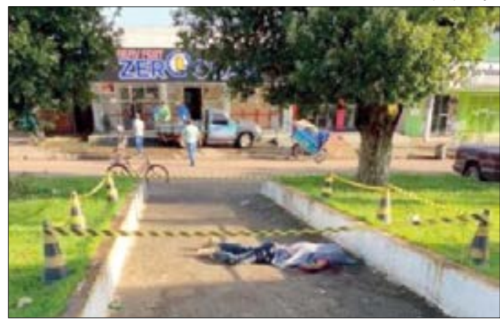
Testemunhas contaram que o suspeito chutou e bateu a cabeça da vítima no chão por diversas vezes