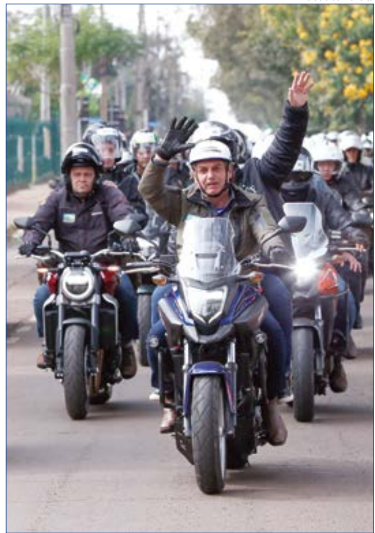
Palácio do Planalto