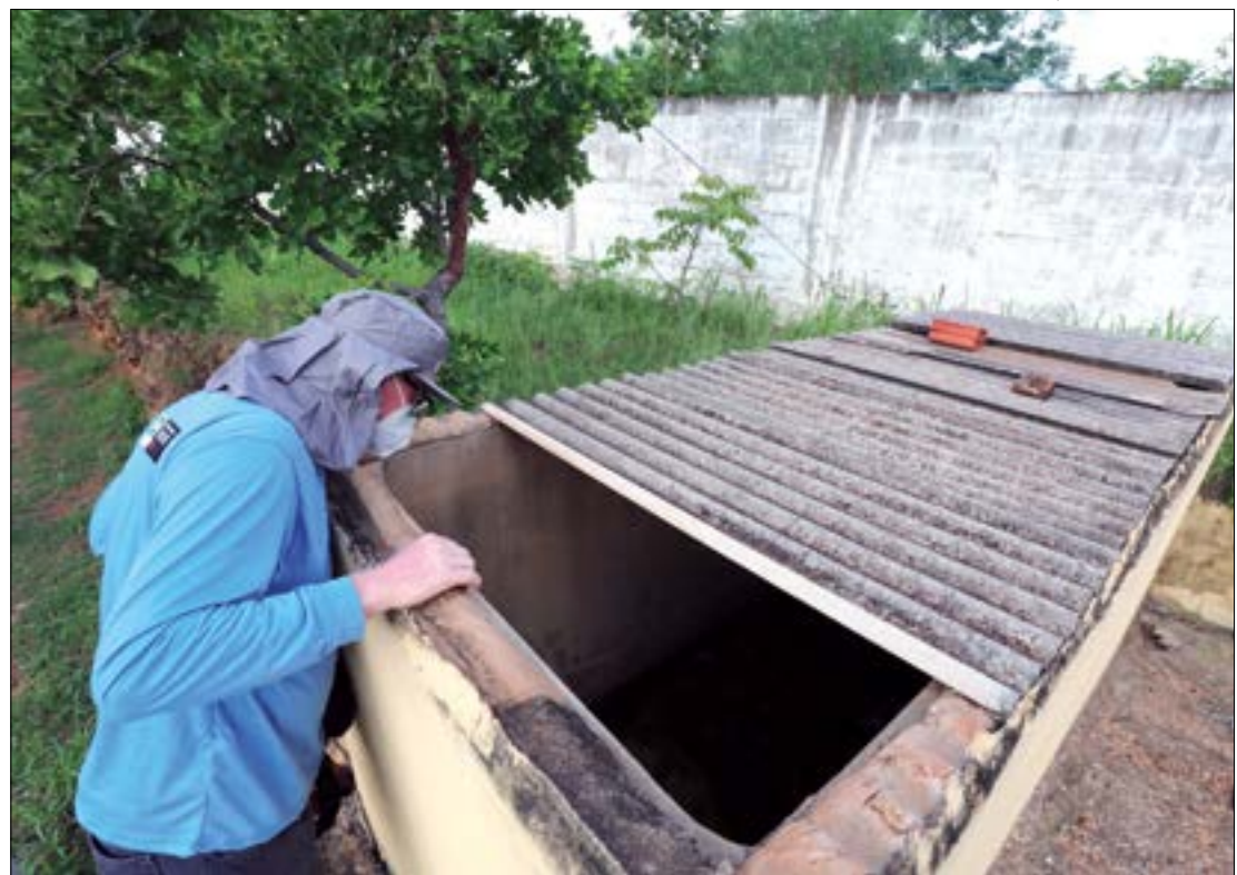
Todos os bairros de Cuiabá registraram infestação do Aedes aegypti, o mosquito transmissor da dengue, zika e chikungunya