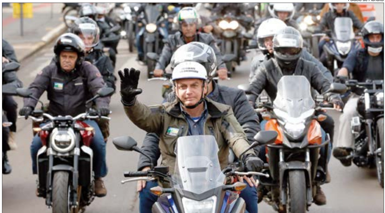
Bolsonaro só deve interagir com seus apoiadores no trajeto entre o aeroporto e o Grande Templo, informou assessoria

Bolsonaro estará em Cuiabá para participar da 45ª Assembleia-Geral Ordinária (AGO), promovida pela Convenção-Geral dos Ministros Evangélicos das