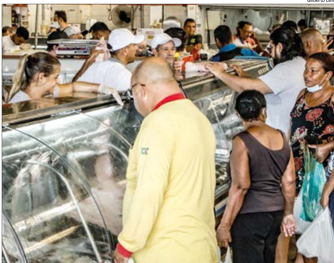
Cesta básica acumula quatro semanas de alta e economista não vê sinais de melhora no cenário

A inflação é medida pelo Índice Nacional de