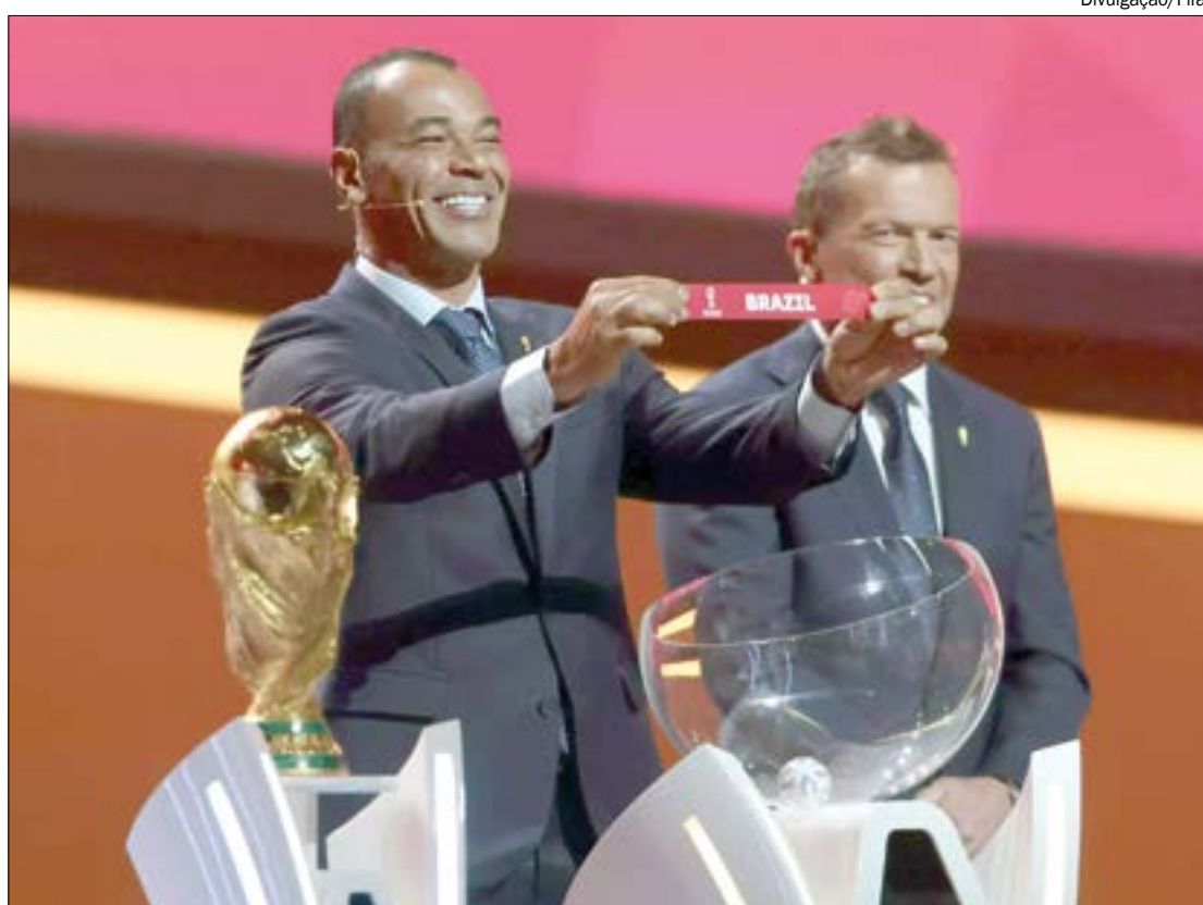
Brasil conseguiu escapar da Alemanha e Holanda, caindo em um grupo relativamente fácil

Até por isso, a entidade ainda não definiu os horários das partidas. Elas serão distribuídas entre os horários e estádios disponíveis em cada dia, em um formato mais flexível, na tentativa de 'facilitar a vida' dos donos de direitos de transmissão.