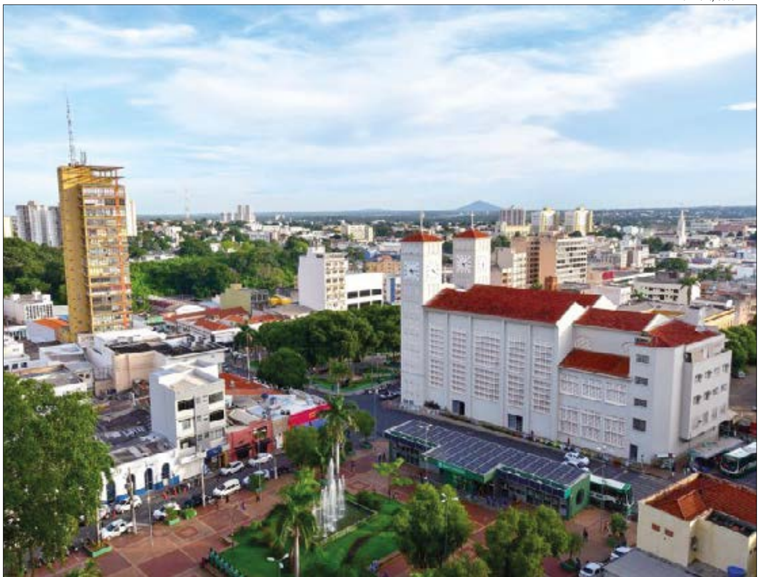
Programação de aniversário teve início nesta quinta-feira (31) e se estenderá até o dia 8 de maio