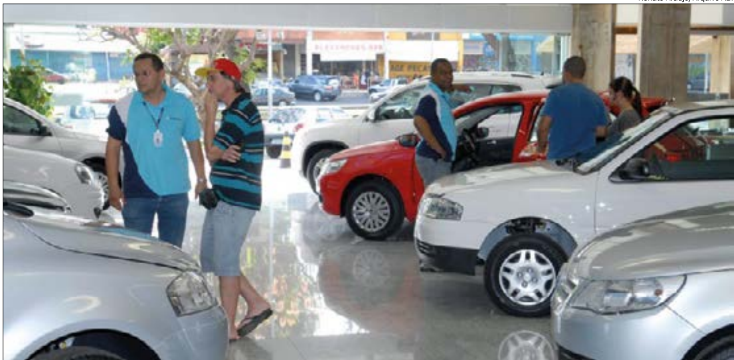
Redução na oferta de carros novos fez consumidores migrarem para o mercado de usados e inflou a bolha no setor

Boscolo ainda avalia que após a volta da normalidade nas cadeias de suprimentos globais, que foram afetadas pela pandemia, o mercado de veículos deve retornar a patamares mais toleráveis de forma rápida, com taxa zero, descontos e bônus. Os analistas, entretanto, apontam que isso só deve ocorrer no final de