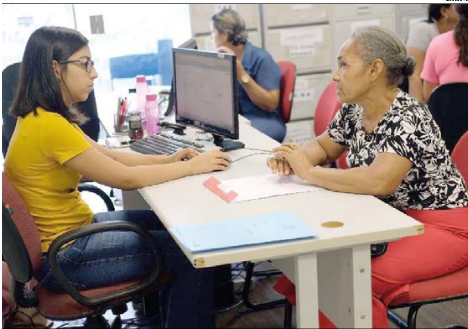
Empresas que oferecerem empréstimo por telefone podem levar multa de mais de R$ 1 milhão

SANÇÕES - A lei, de autoria do deputado estadual Paulo Araújo, prevê ainda que, caso descumpra a legislação, a instituição poderá ser multada em até 5 mil Unidades de Padrão Fiscal do Estado de Mato Grosso (UPF). A multa, em caso de reincidência, será acrescida de 100% do seu valor. "Atualmente, o valor da UPF-MT é de R$ 212,10.