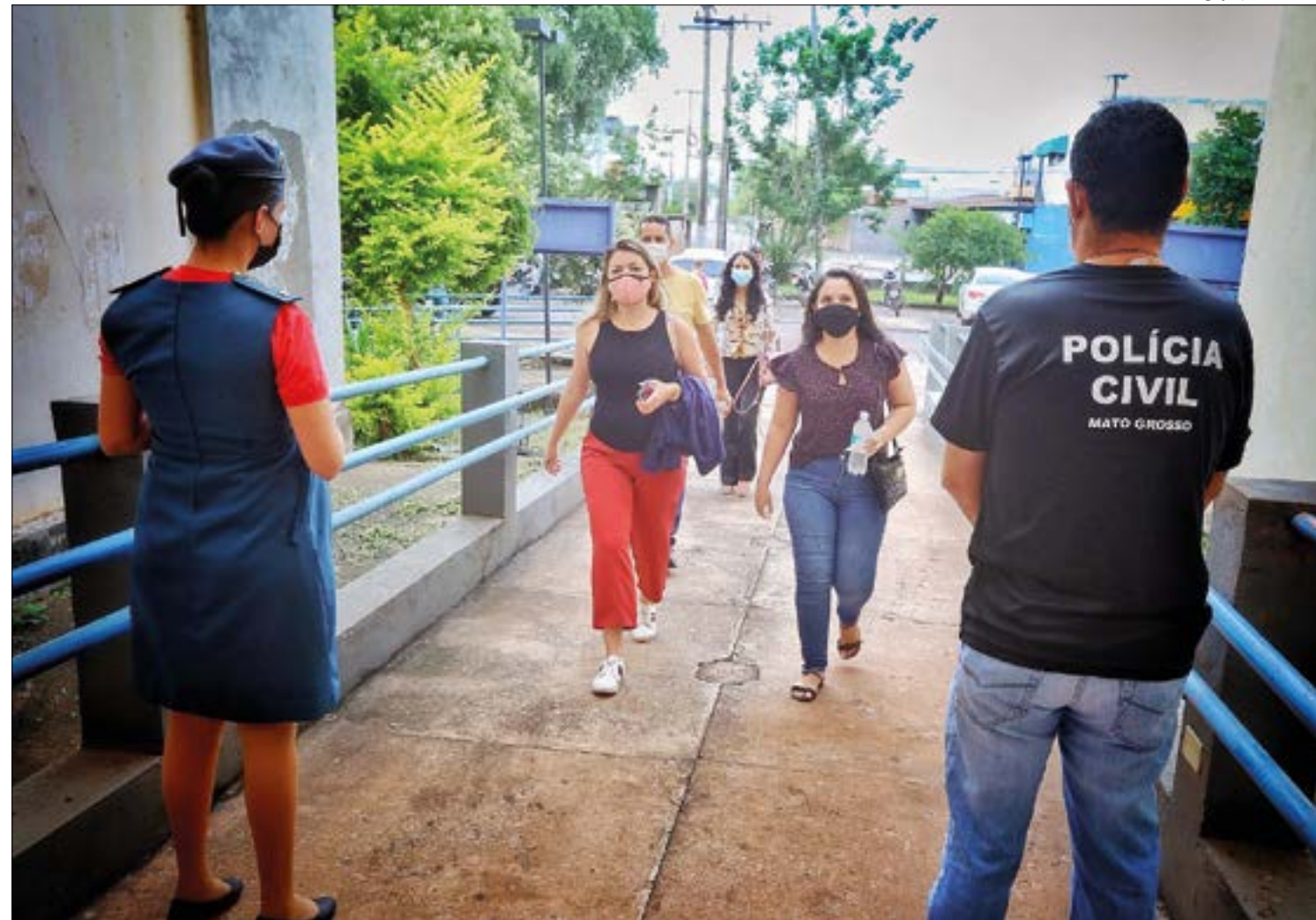
Com mais de 66 mil inscritos, concurso da Sesp é alvo de ‘enxurrada’ de denúncias e está sob investigação