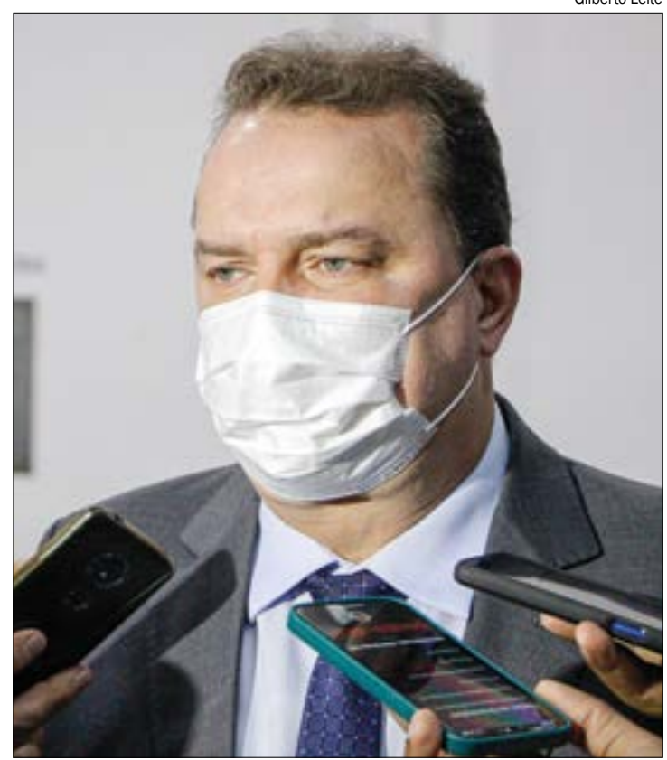
Russi ressalta importância dos intérpretes de Libras para inclusão das pessoas surdas

Além disso, no início do mesmo mês o Legislativo debateu o tema em um ciclo de palestras pela Consolidação e Inclusão Social da Pessoa Surda.