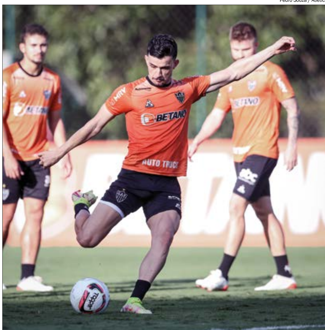
Atlético-MG e Flamengo foram autorizados a chegarem em Cuiabá só na véspera da partida

Após o Atlético notificar que só viria a Cuiabá na véspera do jogo, o Flamengo alegou falta de isonomia na decisão e também pediu o mesmo 'benefício'. O clube carioca já tinha reservado vagas em um dos melhores hotéis da cidade e havia programado sua logística para desembarcar na capital nesta quinta-feira (17). Também havia reservado horários para