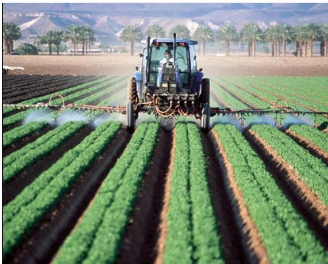
Aprosoja cobra explicações da Bayer sobre problemas no fornecimento de glifosato, herbicida mais usado no Brasil

A Associação dos Produtores de Soja e Milho de Mato Grosso (Aprosoja/MT) emitiu nota criticando a falta de explicações convincentes da empresa, que alegou apenas 'situação de força maior' e que estabeleceu prazo de três meses para resolver o problema, prazo considerado muito longo, devido ao risco de prejuízo às lavouras.